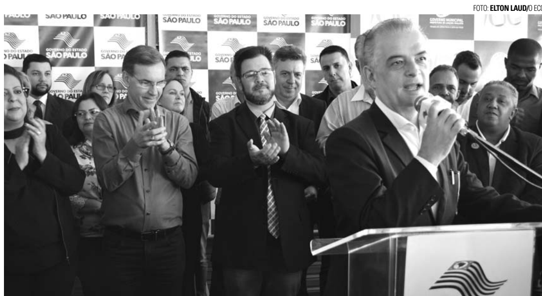
SOLENE - Governador Márcio França prestigiou inauguração do novo terminal rodoviário de Lençóis Paulista

O prefeito Anderson Prado de Lima relatou à reportagem que o novo terminal rodoviário vem para facilitar a interligação com os municípios, inclusive com a possibilidade da abertura de novas linhas. "Lençóis Paulista está localizada no coração do estado de São Paulo e uma obra como esta é de extrema importância, tanto que fomos prestigiados com a presença do governador Márcio França. A cidade tem crescido e se desenvolvido. Vamos ter o advento da ampliação da Lwarcel, da vinda da Sepac, e passamos a ter um terminal rodoviário amplo e moderno que vai ajudar na interligação com os outros municípios. Estamos aguardando as licitações que estão na Artesp (Agência Reguladora de Serviços Públicos Delegados de Transporte do Estado de São Paulo) para a abertura de novas linhas", destacou o prefeito.