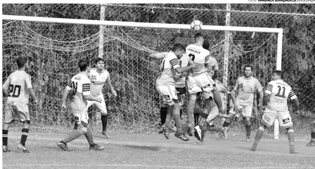
NA CONTA - Nacional (calção branco) vence Independente por goleada na Série B