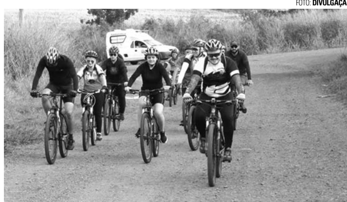
NA TRILHA - Desafio teve percurso de aproximadamente 25 quilômetros entre as duas cidades

A largada aconteceu às 7h30, no Ginásio Municipal de Esportes Antonio Lorenzetti Filho (Tonicão), em Lençóis Paulista. Na chegada em Macatuba, os participantes foram recepcionados com um almoço no Centro de Lazer do Trabalhador.