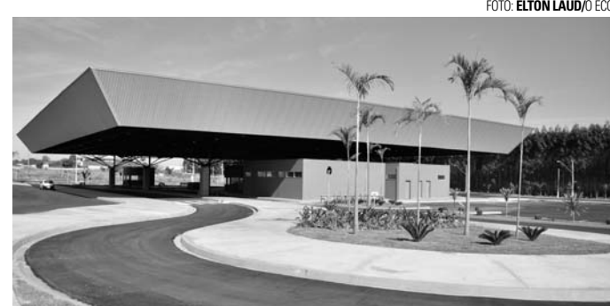
MODERNO - Novo Terminal Rodoviário facilitará interligação com outros municípios

conceito de sustentabilidade ambiental e também de acessibilidade. Contempla sistema de captação de água de chuva que é armazenado em duas cisternas e depois bombeada para o sistema de irrigação dos canteiros e jardins. O sistema tem capacidade de armazenamento de 30 mil litros de água. A rodoviária também tem rampas para acesso de deficientes físicos e cadeirantes.