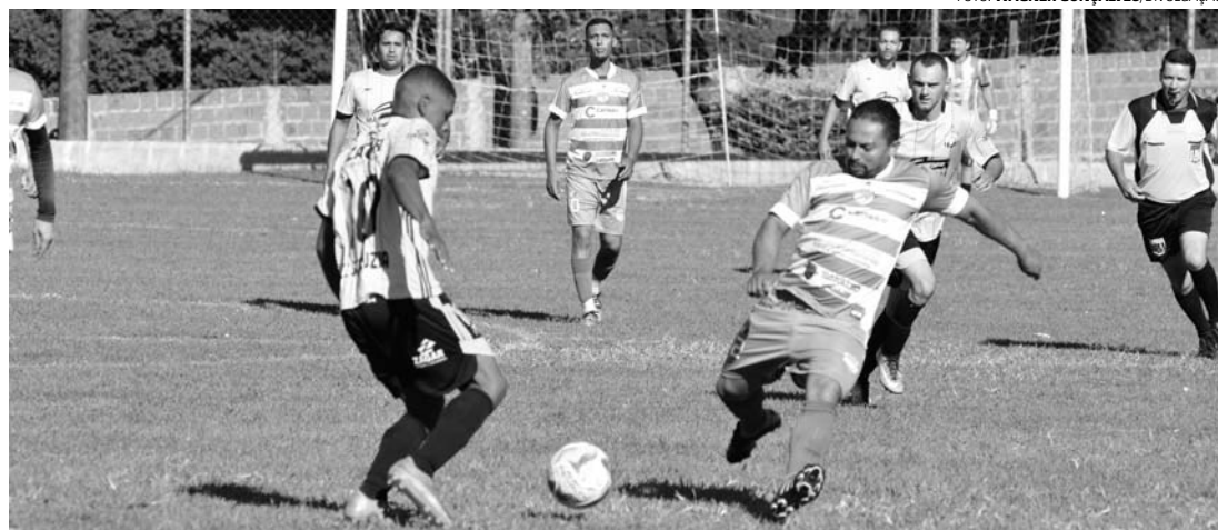
NO PÁREO - Santa Luzia (calção preto) goleia Atleticano Lençoense e assume terceira colocação da Série A

No próximo domingo (24) serão disputadas quatro partidas pela competição promovida pela Secretaria de Esportes e Recreação do município. No Estádio Distrital Eugênio Paccola, na Cecap, às 8h, o Grêmio Cecap enfrenta o Açaí; em seguida, às 10h, jogam Santa Luzia e Asa Branca. Em Alfredo Guedes, às 8h, o Atleticano Lençoense encara o Atlético Lençóis; na sequência, às 10h, entram em campo Expressinho e Nova Lençóis.