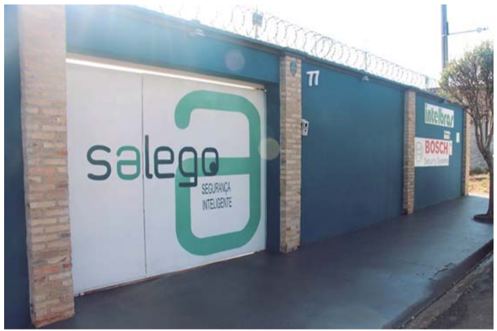
SERVIÇO - Cuidando da segurança de seus clientes 24 horas por dia, a Salego Segurança Inteligente está localizada na Rua Candido Alvim de Paula, 77, no Jardim Ubirama. Mais informações sobre os produtos e serviços oferecidos pela empresa podem ser obtidas pelos telefones (14) 3264-5949 ou (14) 9 9890-5949.