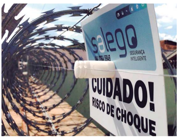
SEGURANÇA - Empresa é especializada em instalação de câmeras, alarmes, monitoramento e demais dispositivos de segurança