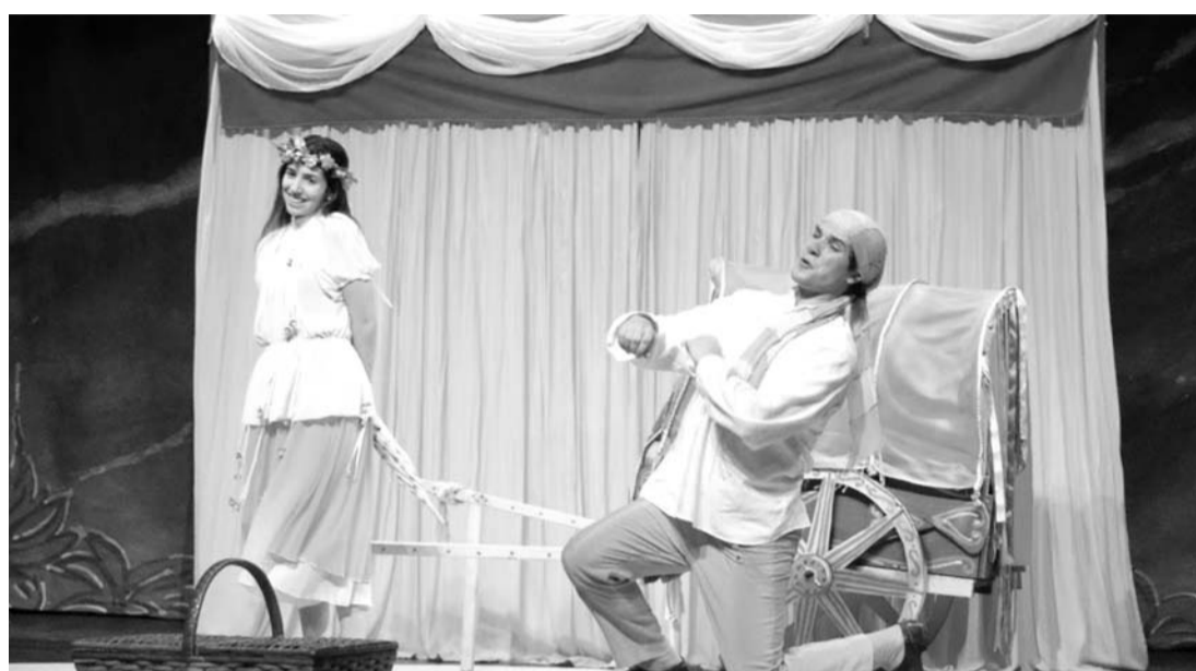
PARA AS CRIANÇAS - Peça "Libel e o Palhacinho" diverte o público infantil a partir das 16h deste domingo (15)

A peça "Libel e o Palhacinho" conta a história de uma menina (Libel) que é cheia de sardas, dentuça e vestindo roupas usadas, que sofre diante de comentários de seus colegas de escola. Seu único amigo é um palhacinho feito de pano, que foi trancado por uma 'bruxa ruiva' em uma caixa mágica. A menina, a procura de seu melhor amigo, vive uma grande aventura, além de encontrar diversos personagens como uma freguesa maluca, um ci-