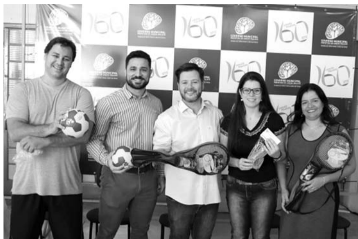
PREMIAÇÃO - Kits esportivos foram entregues nas escolas Maria Zélia e Eliza Pereira na manhã de ontem (13)

As Escolas Maria Zélia Camargo Prandini (Júlio Ferrari), Eliza Pereira de Barros (Centro) e Philomena Briquesi Bosi (Al-