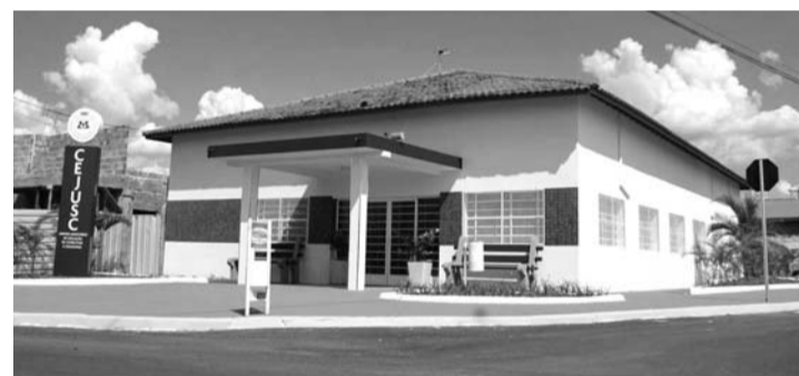
ATENDIMENTO - Procon de Pederneiras fica em prédio anexo ao Cejusc

A partir da segunda-feira (16), unidade ficará aberta apenas no período da manhã