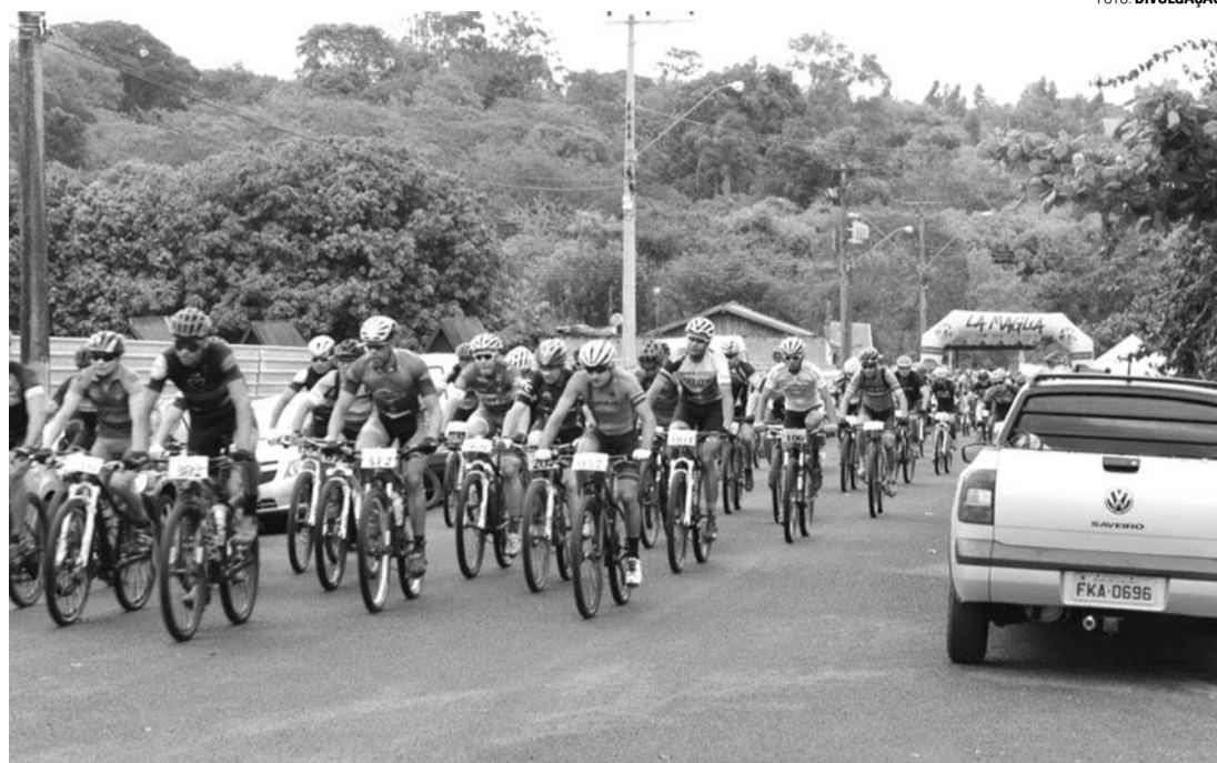
NA TRILHA e NO ASFALTO - Primeira etapa do Circuito Pedal Sem Limites deve reunir centenas de ciclistas em Lençóis Paulista

Antes da prova será servido um café da manhã aos participantes, que também devem contar com diversos pontos de hidratação ao longo do percurso. A largada está prevista para às 9h15, na categoria Pró, e para às 9h30, na categoria Sport.