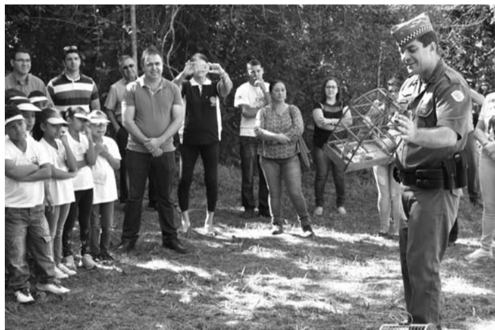
PRESERVAÇÃO - Durante o evento Polícia Ambiental fez a soltura de dois pássaros apreendidos

Durante o evento, participantes fizeram o plantio de mudas de árvores