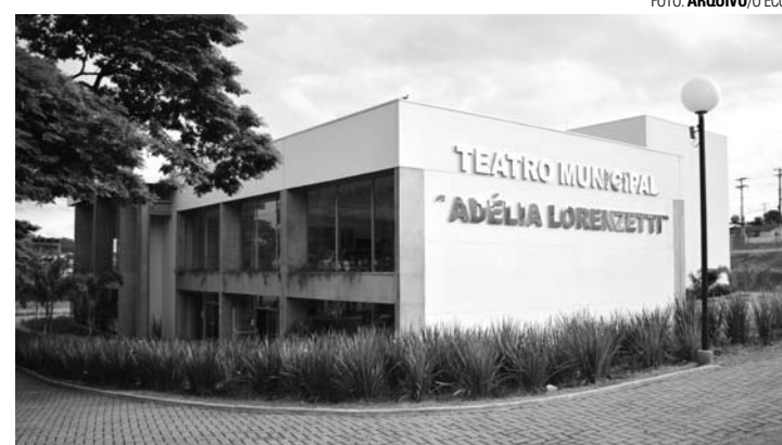
EXPECTATIVA - Final do Rainha da Facilpa 2018 acontece na segunda-feira (23), no Teatro Municipal

A votação on-line do Rainha da Facilpa 2018 foi encerrada no último domingo (15) pelo site www.rainhadafacilpa.com.br . As 14 candidatas mais votadas, que serão conhecidas no baile