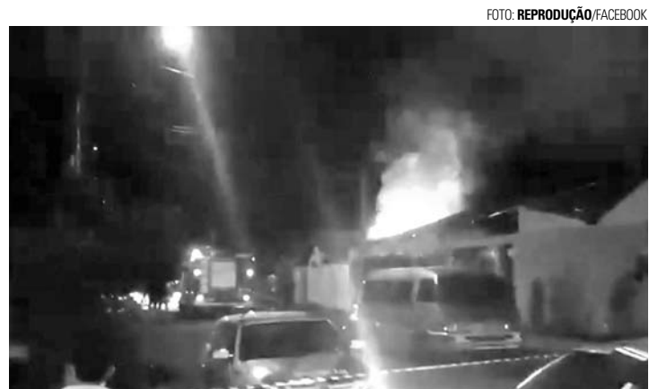
RÁPIDO - Fogo teria se alastrado rapidamente, impedindo o resgate da vítima