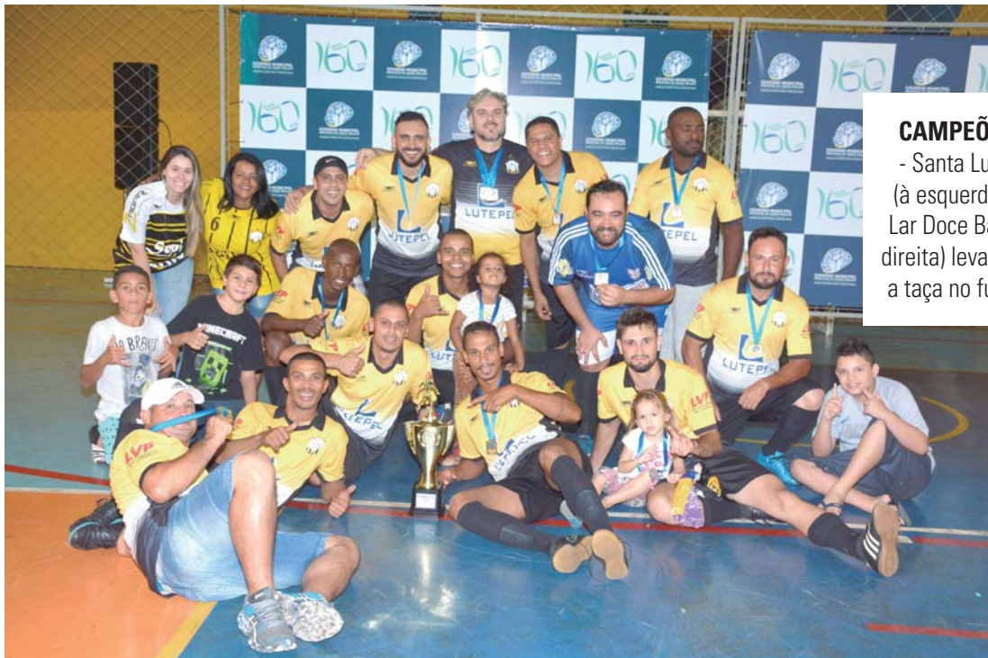
CAMPEÕES - Santa Luzia (à esquerda) e Lar Doce Bar (à direita) levantam a taça no futsal