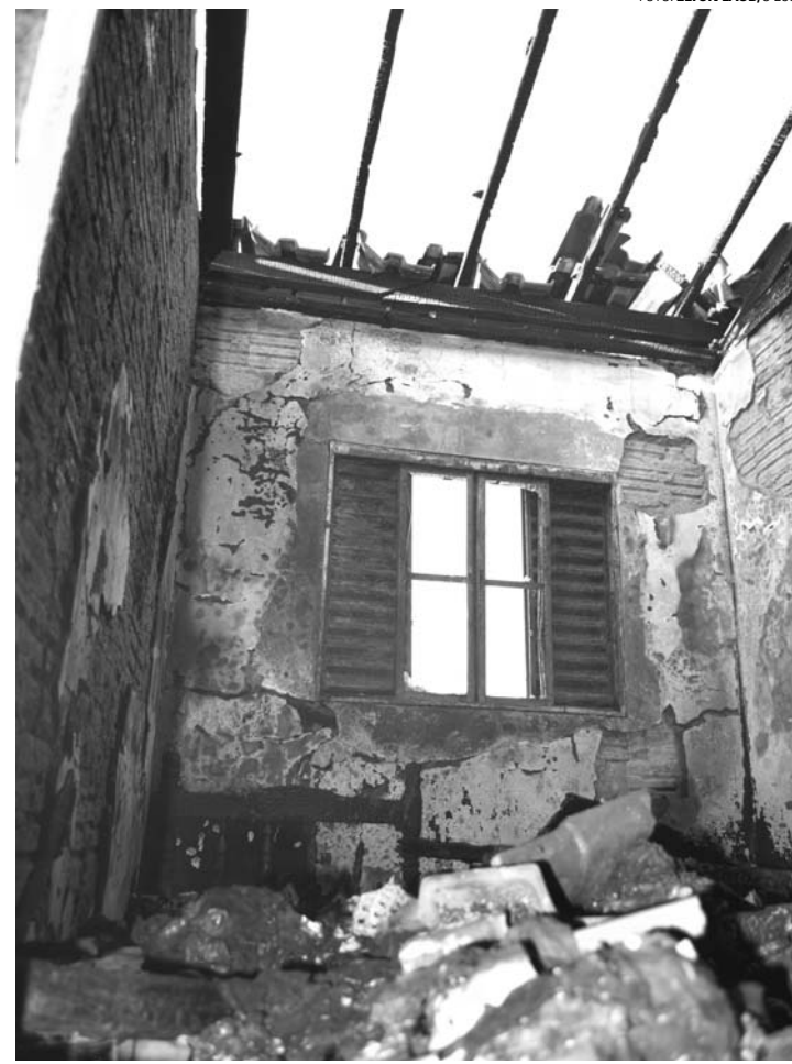
DESTROÇOS - Casa ficou completamente destruída após o incêndio

A residência foi tomada quase que inteiramente pelo fogo e alguns pontos correm risco de desabamento. A família, que está hospedada na casa de parentes e vizinhos, perdeu boa parte dos pertences e precisa de ajuda para retomar a vida neste momento difícil. Quem tiver condições pode contribuir fazendo a doação de roupas, sapatos, cobertores, além de móveis, utensílios domésticos e até materiais de construção.