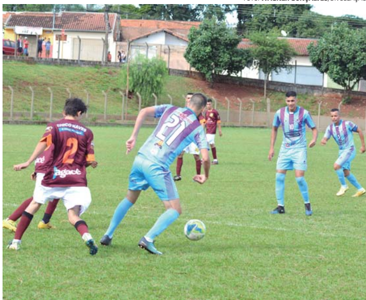
SEM PROBLEMAS - Açaí (camisa listrada) goleia São Cristovão e encara Expressinho na semifinal da Copa Lençóis