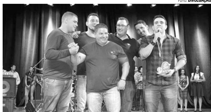
FESTIVAL - Banda Renovados foi a vencedora na categoria grupo musical