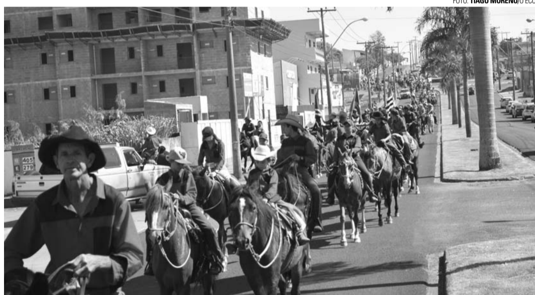
COMITIVAS - Cerca de mil cavaleiros e amazonas participaram da tradicional cavalgada

Por volta das 10h, as tropas partiram da concentração em uma área aberta entre o Núcleo Habitacional Luiz Zillo e o Jardim Nova Lençóis e seguiram por um percurso