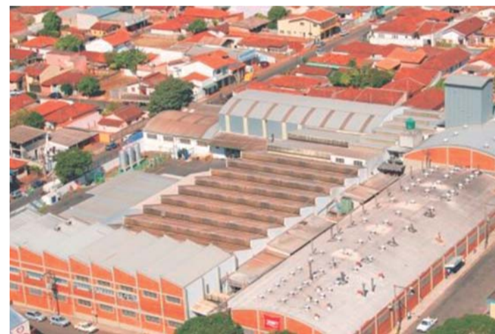
GIGANTE - M. Dias Branco, dona da Zabet, anuncia compra da Piraquê por 1,5 bilhão

Também segundo a nota, "Durante o período de análise da transação, as companhias continuarão operando de forma independente" e a empresa "[...] oportunamente,