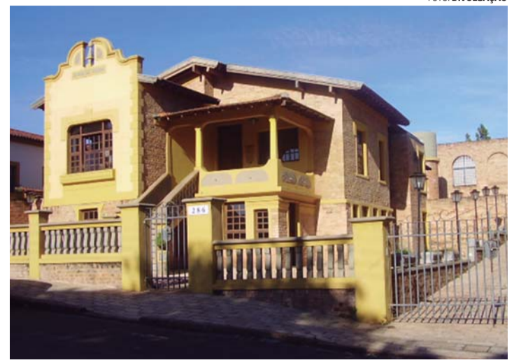
CLIQUE JOVEM - Encontros acontecem no Espaço Cultural Cidade do Livro

O projeto é patrocinado pelo Grupo Lwart, com realização do Instituto Ideia Coletiva, e apoio da Diretoria de Cultura de Lençóis Paulista, por meio do Programa de Ação Cultural (ProAC) do Estado de São Paulo. Serão oferecidas 50 vagas e as inscrições estão abertas de 5 a 20 de fevereiro, por meio do site www.jovens.art.br .