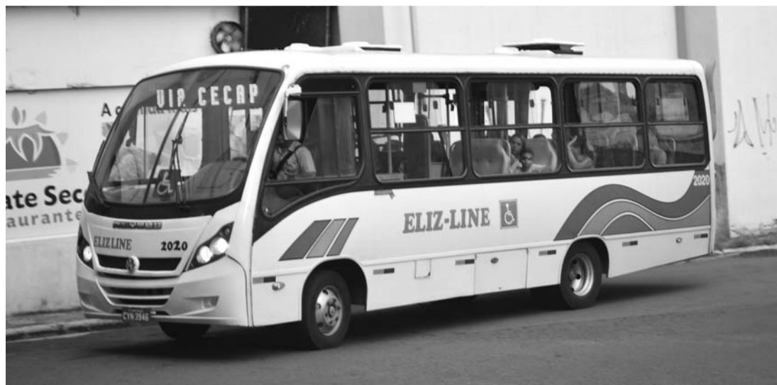
CAOS - Eliz-Line foi multada em R$ 125 mil após fiscalização comprovar diversas irregularidades

de acordo com informações obtidas pela reportagem, a empresa foi vendida para outro proprietário que, até o momento, é desconhecido não apenas