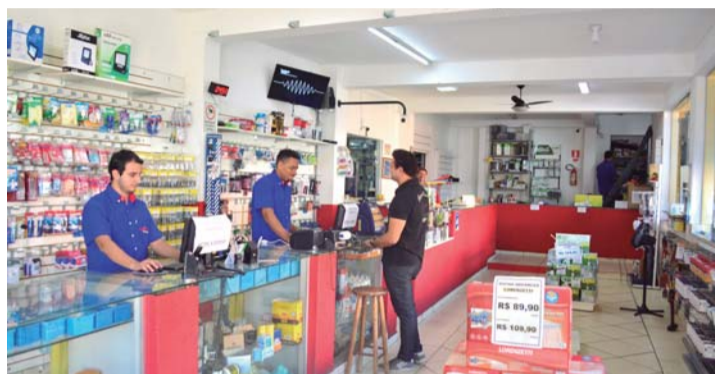
VARIEDADE - Eletro Santa Clara comercializa todo tipo de materiais elétricos e trabalha com as melhores marcas do mercado

Há mais de 30 anos no mercado, empresa atende Lençóis Paulista e região