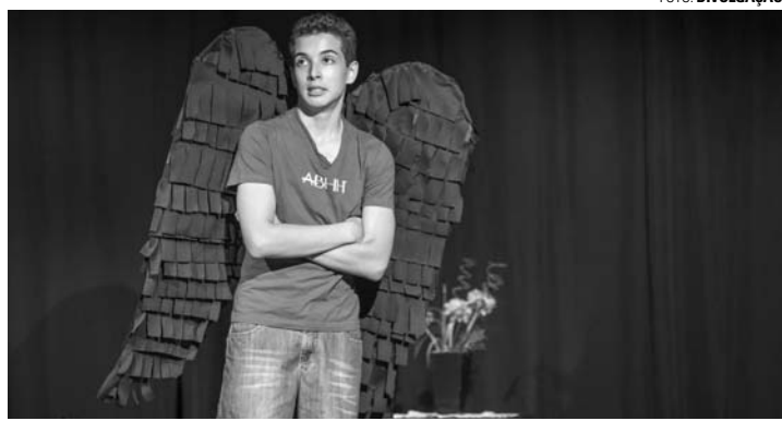
CISNE PROMETIDO - Peça será encenada na sexta (9), às 20h30

A história, que se passa nos anos de 1980 na fictícia cidade de Jaguaretê do Rio Pequeno, fala de um adolescente de asas, fruto de um união de uma bailarina com um peão de rodeio, que vivenciará situações esdrúxulas e inusitadas. "A trama tem como objetivo proporcionar, além do entretenimento, uma discussão e reflexão acerca das pessoas que sofrem discriminação sem terem, ao menos, a oportunidade de manifestarem seus senti-