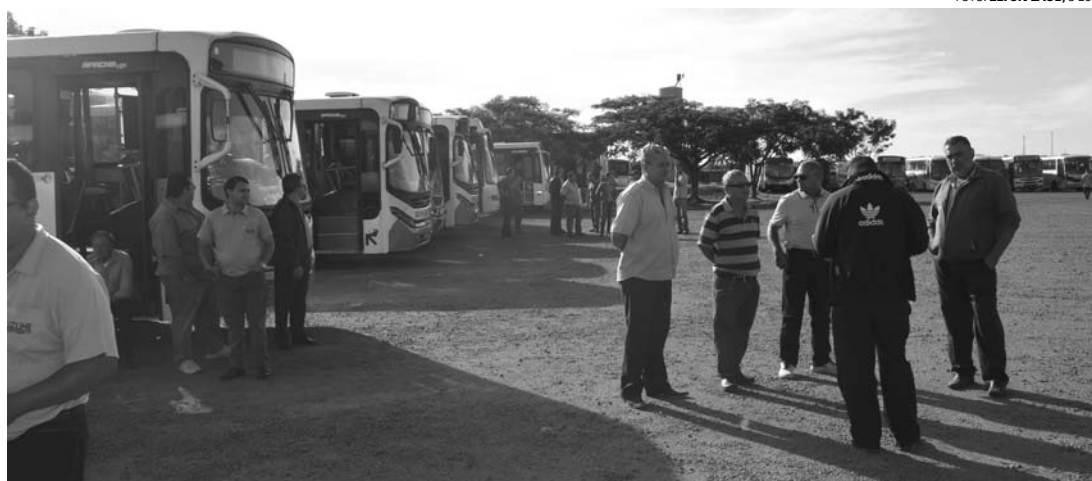
BRAÇOS CRUZADOS - Funcionários da Eliz-Line paralisaram totalmente o serviço nessa terça-feira (6)

A movimentação na frente da garagem da empresa começou por volta das 5h. Segundo informações de alguns funcionários, houve, inclusive, a tentativa da retirada de alguns ônibus da garagem durante a madrugada por um grupo de indivíduos supostamente orientados pelos proprietários da empresa. O grupo acabou desistindo e deixando o local depois que a Polícia Militar foi acionada. Por volta das 8h, os cerca de 50 funcionários que estavam no local se mostravam dispostos a manter a paralisação até