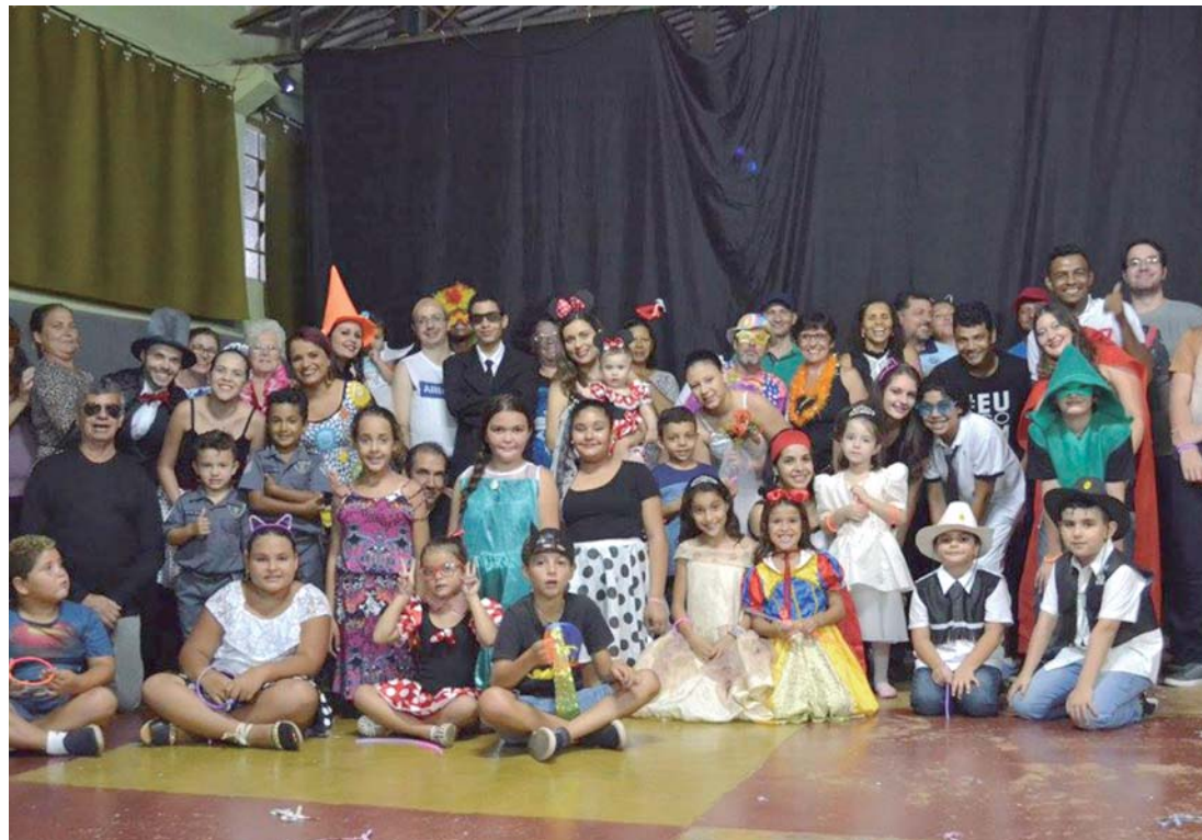
BAILA CRISTO - Sábado de Carnaval terá muita animação e devoção a Deus em Agudos