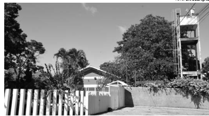
PROVA - Candidatos devem comparecer à escola Lina Bosi a partir das 8h30

O concurso será realizado para o preenchimento de vagas para os cargos de Assistente de Saúde da Família, Enfermeiro, Farmacêutico, Fonoaudiólogo, Médico