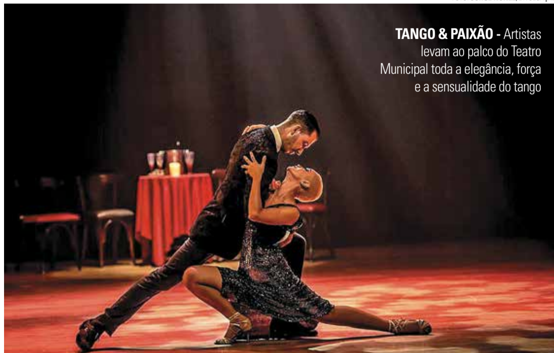
TANGO & PAIXÃO - Artistas levam ao palco do Teatro Municipal toda a elegância, força e a sensualidade do tango