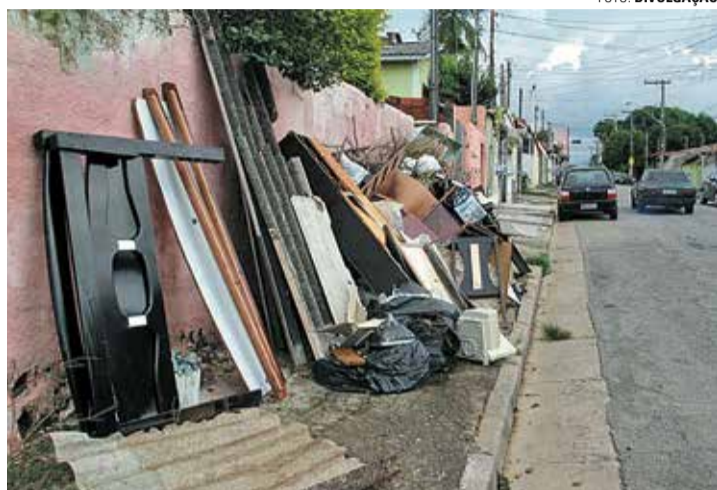
LIMPEZA - Materiais inservíveis devem ser colocados nas calçadas no dia anterior à coleta

Segundo a assessoria de imprensa, não existe registro de casos de chikungunya e zika vírus. Entretanto, neste ano foram confirmados 62 casos de dengue na cidade, sendo 44 casos autóctones (contraídos dentro do município) e 18 casos importados. "É importante lembrar que as cidades de Bauru e Agudos registraram epidemia de dengue, inclusive com mortes. Por isso, a importância de se fazer o mutirão neste mês de dezembro para eliminar os criadouros do mosquito, que se