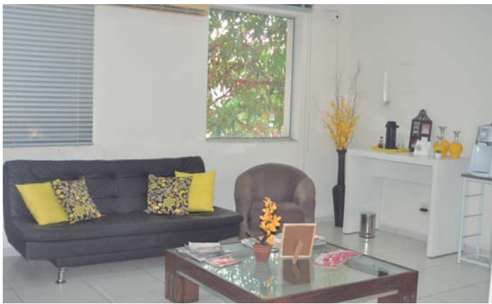
MODERNO – Em um ambiente amplo, salão de beleza conta com uma sala de espera aconchegante para seus clientes