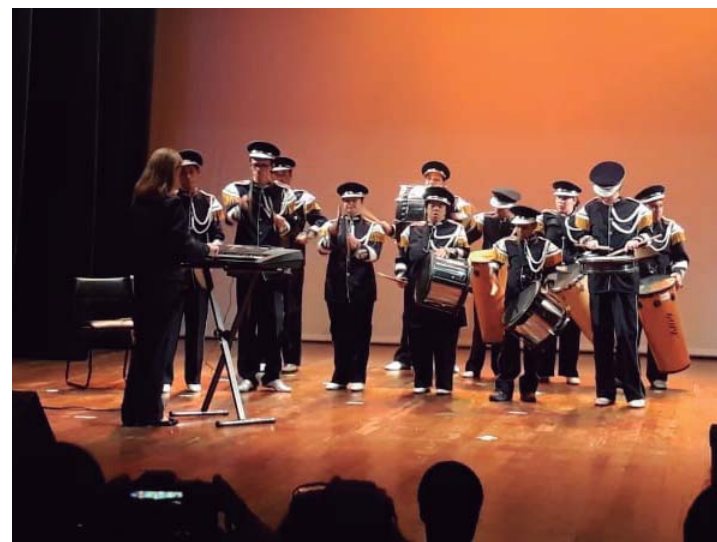
CONQUISTA - Fanfarra da Apae Lençóis Paulista conquista 1º lugar no Festival Nossa Arte

O Lions Club de Lençóis Paulista vai realizar neste mês a tradicional feijoada. As adesões já estão à venda por R$ 30 e incluem 1 litro de feijoada, arroz branco, farofa, vinagrete, couve e laranja. A entrega será feita no domingo (26), a partir das 11h, na sede do Clube.