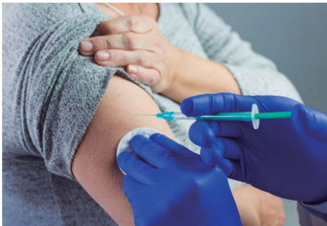
DIA D – Unidades de Lençóis e região estarão abertas neste sábado (4) para vacinação do público

Na primeira fase da vacinação, que teve início em 10