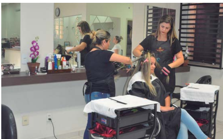
CAPACITADOS – Cabeleiros do Espaço Mulher contam com capacitação e especialização pela Academia L'Oréal, Keune e Wella