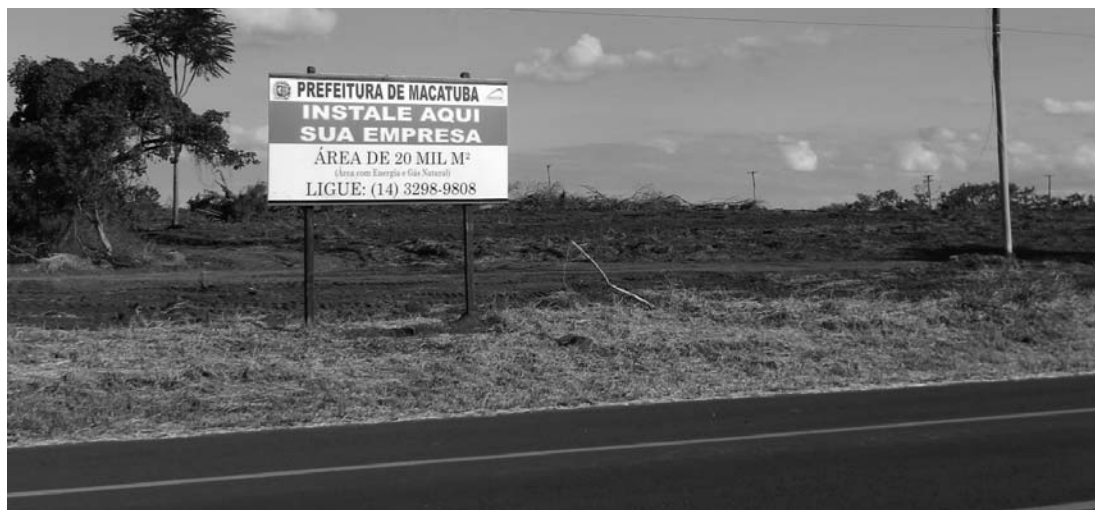
TERRENO - Prefeitura de Macatuba está disponibilizando áreas para instalação de empresas

rio Alves Nunes” foi passado um pente fino para avaliar se as empresas que receberam terrenos e barracões estavam cumprindo com as obrigações contratuais. Em dois anos várias ações foram realizadas, áreas e prédios foram retomados e documentados e o resultado foi a instalação de novas empresas. Os terrenos disponíveis já estão em processo de licitação.