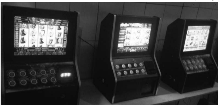
OPERAÇÃO - Polícia Civil apreendeu 10 máquinas caça-níqueis e seis máquinas de cartão utilizadas para apostas de jogo do bicho

Operação também recolheu seis máquinas de cartão utilizadas para fazer apostas de jogo do bicho