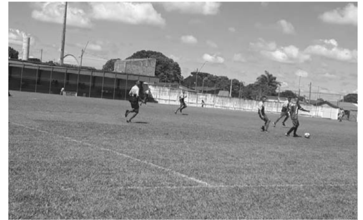
TRANQUILO - Caiuby goleia SEME e abre vantagem no Grupo C

No próximo domingo (3) serão disputadas quatro partidas válidas pela quinta rodada da competição, que é promovida pela Associação de Árbitros de São Manuel e Re-