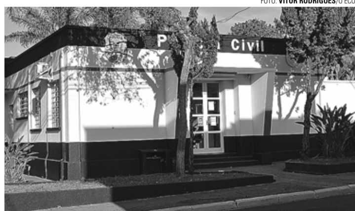
ATO INFRAACIONAL - Após roubo, adolescente de 15 anos é encaminhado à Fundação Casa

ções do Boletim de Ocorrência registrado pela 5ª Cia da Polícia Militar, o roubo aconteceu por volta das 17h, na Rua