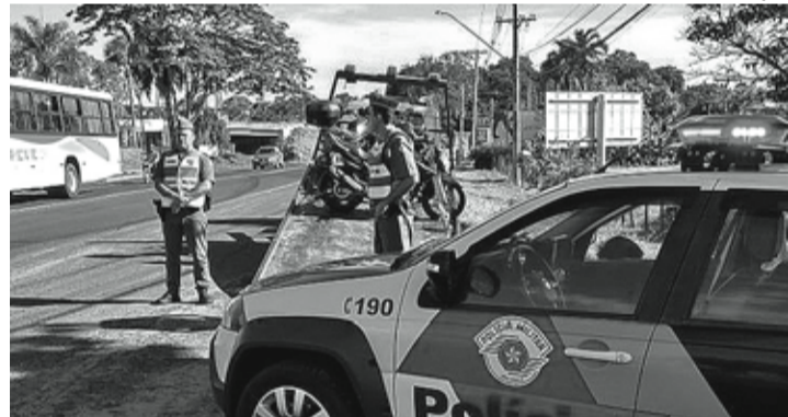
OPERAÇÃO - Polícia Militar reforça efetivo durante todo o mês de dezembro

A Polícia Militar iniciou a operação Natal Mais Seguro para reforçar o policiamento em todo o estado. Desde a última segunda-feira (7), as ações de patrulhamento preventivo e ostensivo foram ampliadas em diferentes regiões do interior, em conjunto com a Polícia Civil e forças de segurança municipais. A ação