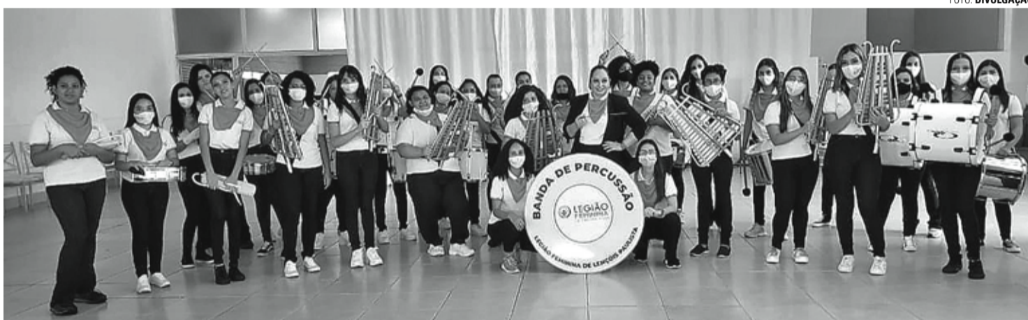
DESTINO - Banda de Percussão da Legião Feminina foi criada a partir de um projeto contemplado pelo Fundo Municipal da Criança e do Adolescente

Doações aos fundos municipais do Idoso e da Criança e do Adolescente devem ser feitas até o dia 30