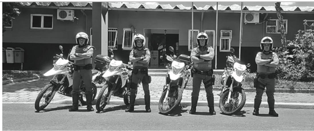
MAIS ÁGIL - Policiais responsáveis pela nova ronda passaram por treinamento específico

Aliado a isso, a Polícia Militar identificou nos últimos meses um problema grave que vêm acontecendo na cidade: a perturbação de sossego por motociclistas que têm abusado na forma de condução de seus veículos. “Notamos que têm aumentado o número de chamados com problemas relacionados à direção perigosa de motos, motociclistas que andam sem escapamento para chamar atenção com barulhos e os que fazem manobras