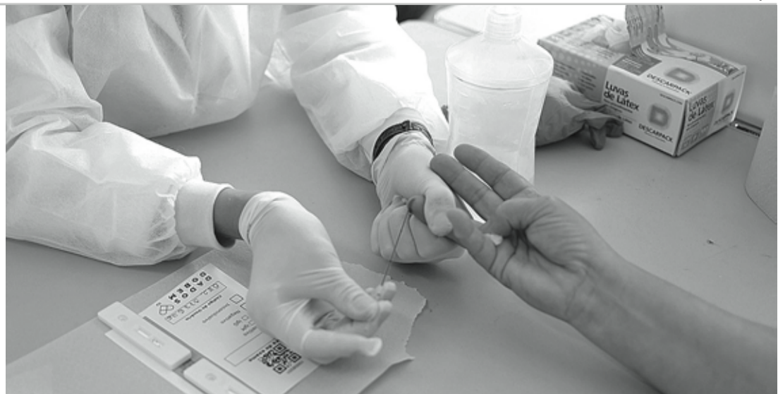
ACOMPANHAMENTO - Testagem em massa visa acompanhar evolução da pandemia no município

Para cada unidade serão disponibilizados 200 testes. A distribuição de senhas tem início às 8h e a testagem acontece até às 17h, com agendamento de horário. Para participar, é preciso apresentar o Cartão Cidadão, CPF (Cadastro de Pessoa Física) e um documento de identidade com foto. Os testes