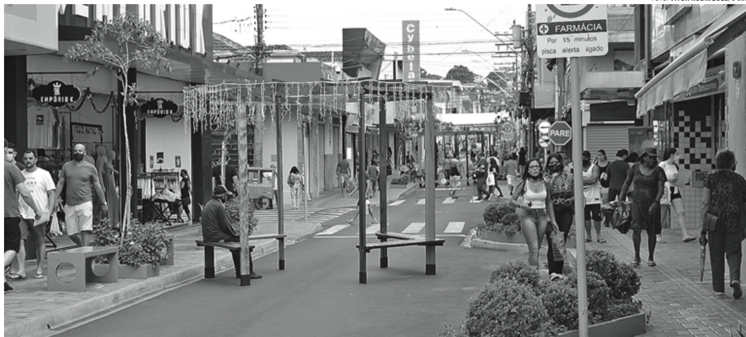
MOVIMENTO - Lojistas fazem balanço positivo das vendas na primeira semana com o comércio atendendo em horário especial de Natal

O clima de otimismo e confiança também pode ser percebido em outros estabelecimentos,