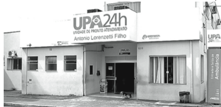
ACIDENTE - Com várias fraturas, passageira encaminhada à UPA precisou ser transferida para um hospital de Bauru