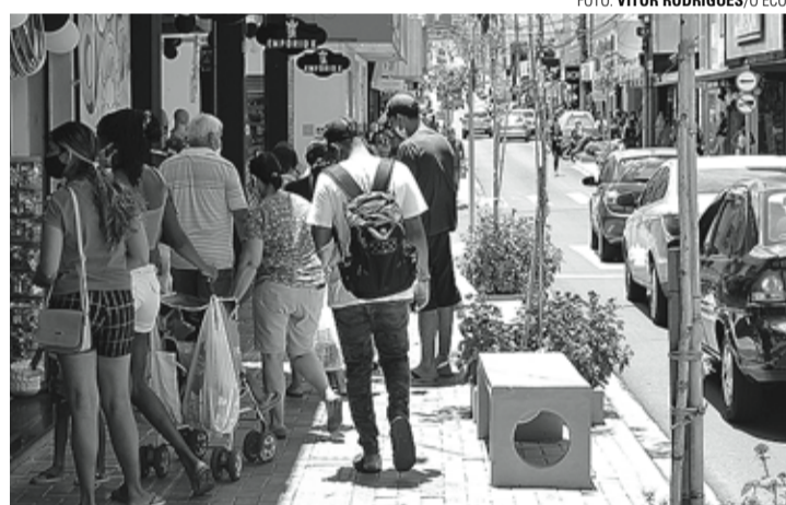
RETOMADA - Com expectativa de aumento de vendas, contratações temporárias no comércio devem impulsionar geração de emprego

Apesar disso, a cidade acumulou saldo positivo de 682 postos de trabalho no mês (1.542 contratações e 860 demissões). Como em quase todos os levantamentos anteriores, o destaque foi a construção, que criou 351