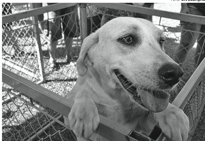
GESTO DE AMOR - Apenas neste ano, coordenadoria promoveu a adoção de 122 animais

Estarão disponíveis para adoção 20 cães e 19 gatos, adultos e filhotes. Os animais já estão vermifugados, vacinados, castrados e microchipados. Além disso, os filhotes já têm a castração garantida pela Prefeitura Municipal assim que atingirem a idade adequada. Para realizar a adoção, é necessário