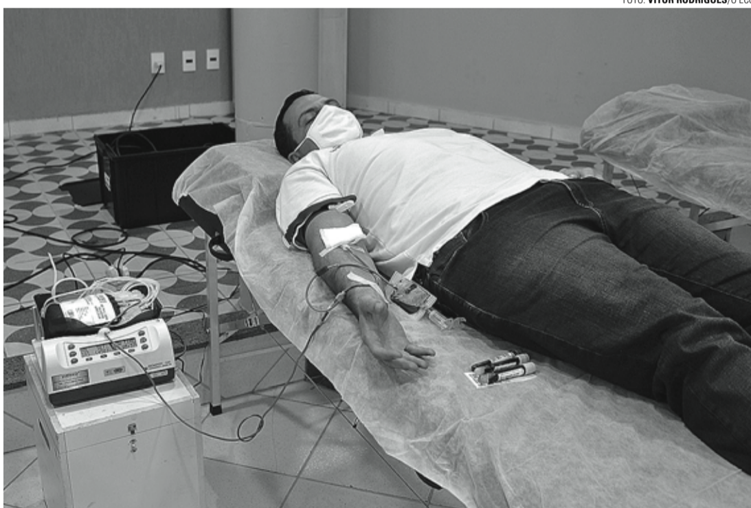
BOA AÇÃO - Campanha ajudou a reforçar os estoques do Hemonúcleo Regional de Jaú

Por conta da pandemia, ação teve número reduzido de senhas; 40 pessoas não conseguiram doar