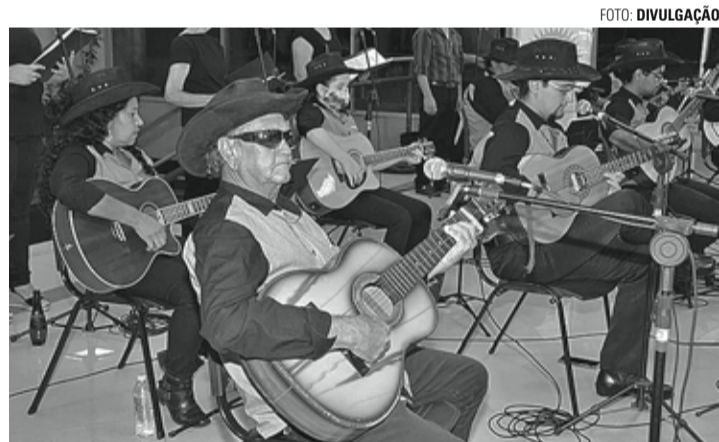
FESTIVAL - Lençóis Paulista foi selecionada em cinco categorias para o Revelando SP On-line; na foto, a Orquestra de Viola e Violão Boca do Sertão

O Revelando SP On-line é uma ação de valorização da cultura tradicional paulista organizada em um festival digital no qual os municípios do estado de São Paulo se fazem representar através de suas tradições culturais. Ao todo, o evento recebeu 480 registros, sendo 120 de cada categoria, como: artesanato, culinária, mestres e