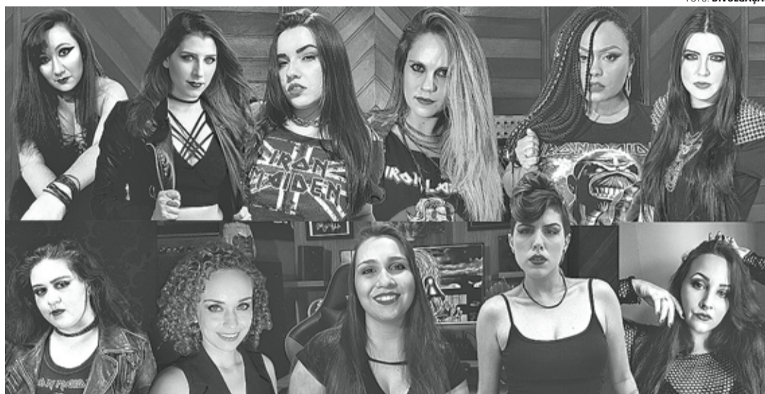
ACES HIGH - Tributo à banda Iron Maiden também transmite mensagem de superação às mulheres; na imagem, as 11 vocalistas que participaram do projeto

Como em outras oportunidades, a SoulsPELL preparou um tributo especial de final de ano, escolhendo o clássico "Aces High", da banda britânica Iron Maiden. Disponível no canal da banda no Youtube ( www.youtube.com/soulsPELLmetalopera ) desde a última sexta-feira (20), o vídeo é o ponto chave da campanha.