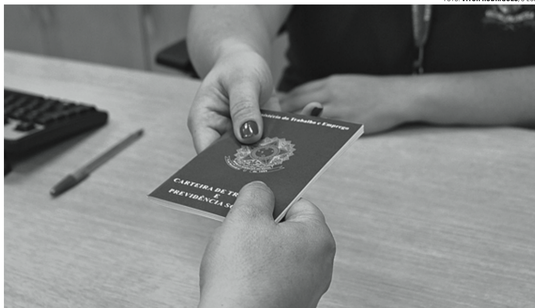
ALTA - Com economia em bom momento, mais trabalhadores estão saindo da informalidade em Lençóis Paulista

A indústria local também mantém a tendência de alta ob-