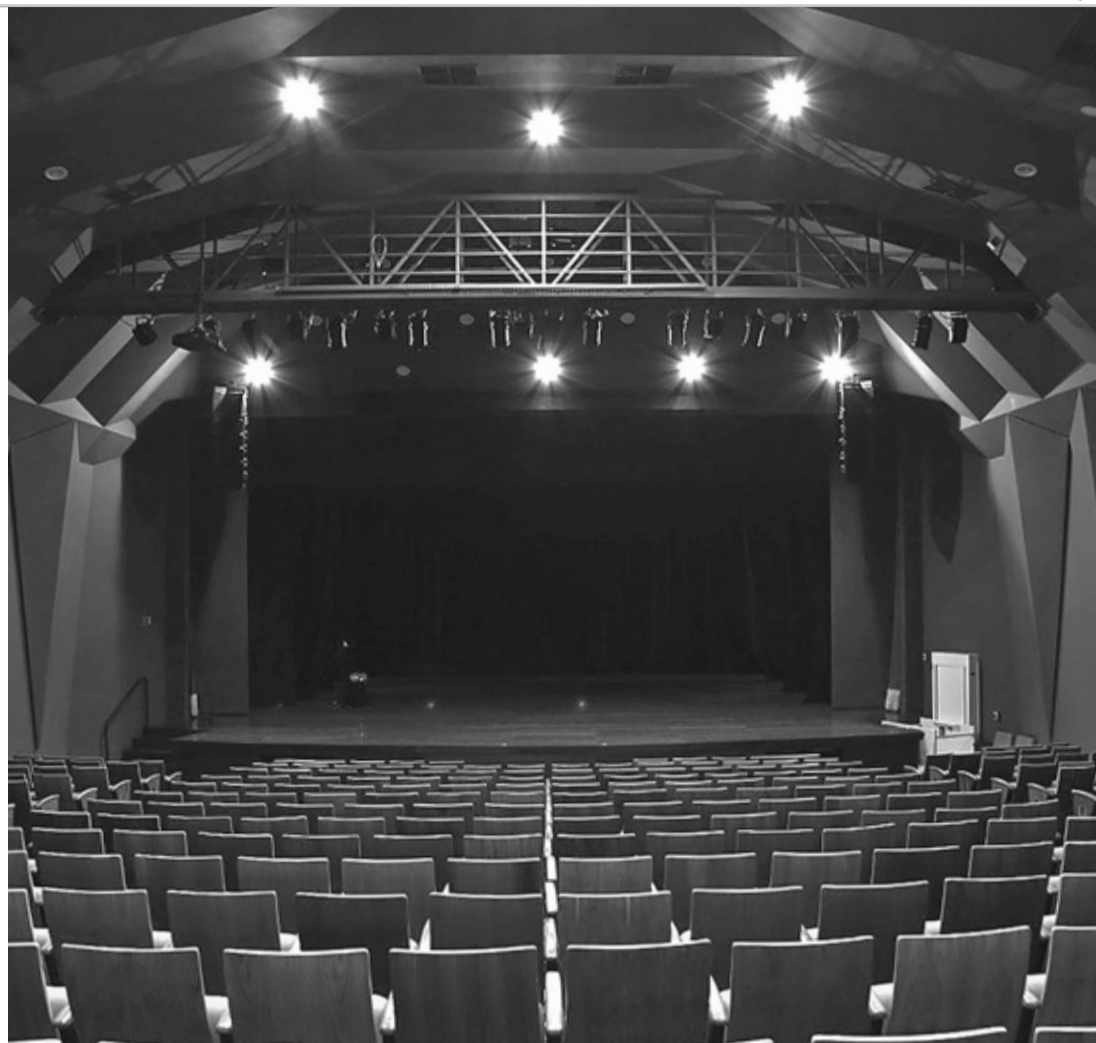
CHAMADA PÚBLICA - Inscrições para artistas e espaços culturais seguem até o dia 9 de dezembro

Os editais fomentarão iniciativas culturais mediante incentivo financeiro de projetos apresentados dentro das especificações expressas pela Prefeitura Municipal de Lençóis Paulista, em especial a de incentivar a criação artística em todas as suas formas de expressão, a pesquisa de novas linguagens, a formação e