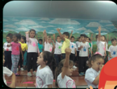
LAR DA CRIANÇA