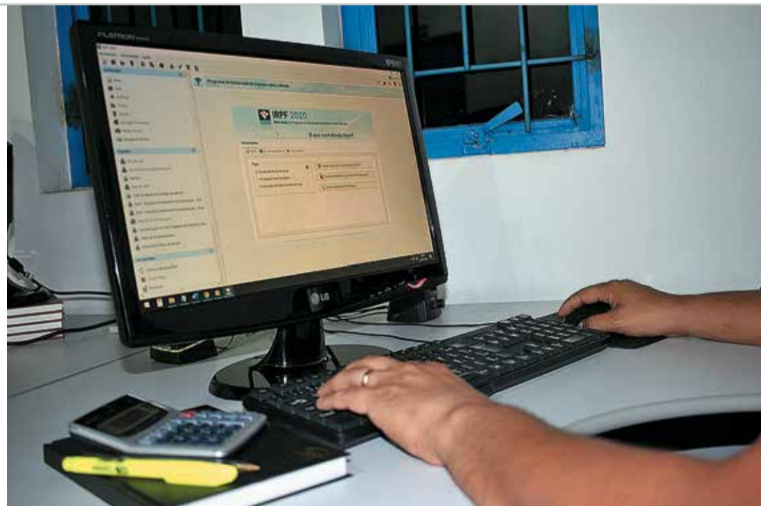
RECEITA FEDERAL - Programa do IRPF 2020 está disponível no site www.receita.economia.gov.br