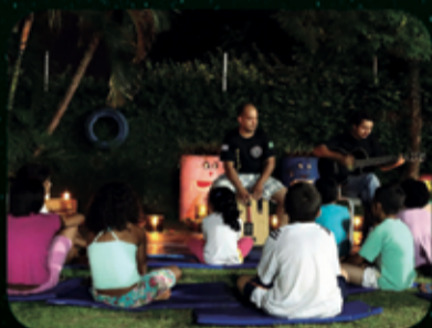
CASA ABRIGO AMORADA