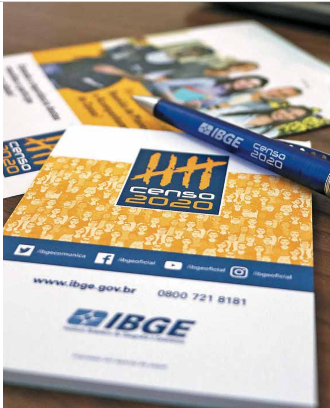
COLETA DE DADOS - Mais de 208 mil pessoas serão contratadas para a realização do Censo 2020

As aplicações das provas objetivas acontecem no dia 17 de maio, para os dois cargos de Agente Censitário, e no dia 24 do mesmo mês, para o cargo de Recenseador. Os horários e locais serão divulgados posteriormente no site citado acima. A publicação dos resultados finais está marcada para os dias 12 de junho e 3 de julho, respectivamente. Segundo o IBGE, os candidatos selecionados terão contrato de trabalho de três a cinco meses. O início do recenseamento está previsto para agosto.