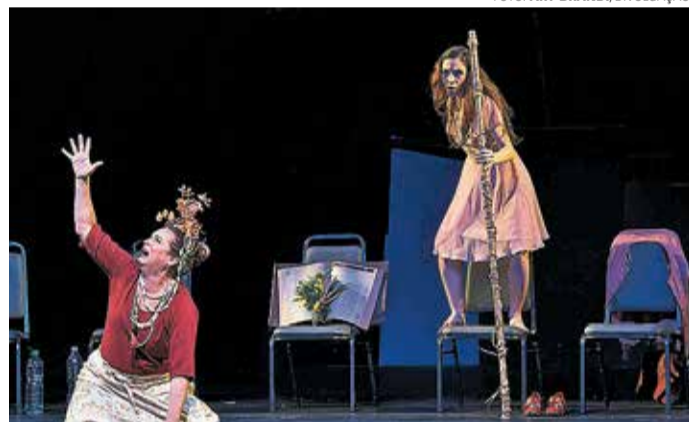
MULHERES DE SHAKESPEARE - Peça encerra programação do Teatro Municipal no dia 27 de março