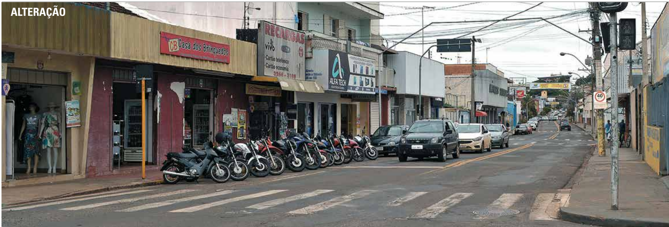
MÃO ÚNICA - Importante corredor de ligação da cidade, Avenida Vinte e Cinco de Janeiro passa a ter tráfego apenas no sentido bairro-Centro