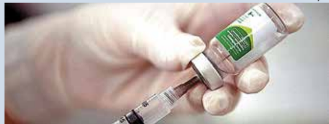
PRECAUÇÃO - Governo Federal antecipa vacinação da gripe por conta do coronavírus

Um dia após a confirmação do primeiro caso do novo coronavírus (Covid-19) no Brasil, o Governo Federal anunciou que vai antecipar para o dia 23 de março a Campanha Nacional de Vacinação Contra a Gripe (Influenza) - a abertura estava prevista para a segunda quinzena de abril.