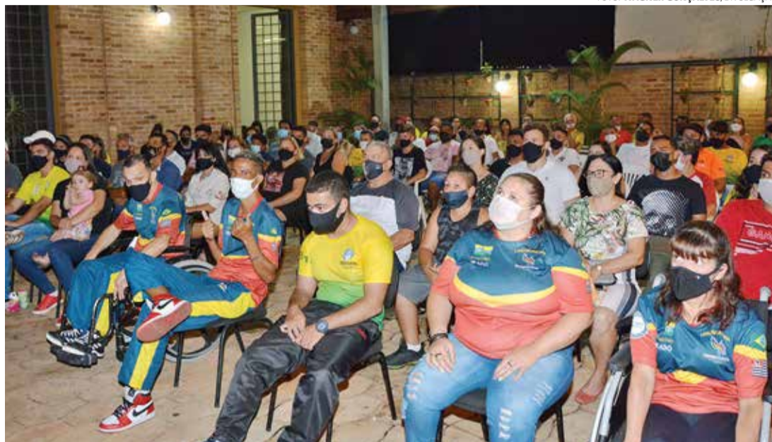
COM MÉRITO - Atletas lençoenses receberam o Diploma de Mérito Esportivo na terça-feira (21)

Criado como forma de reconhecer e homenagear os esportistas que tão bem representam Lençóis Paulista em suas respectivas áreas, o Diploma de Mérito Esportivo Lençoense é uma iniciativa conjunta dos poderes Executivo e Legislativo, promovida com apoio da Secretaria de Esportes e Recreação do município. A entrega acontece sempre no dia 21 de dezembro,