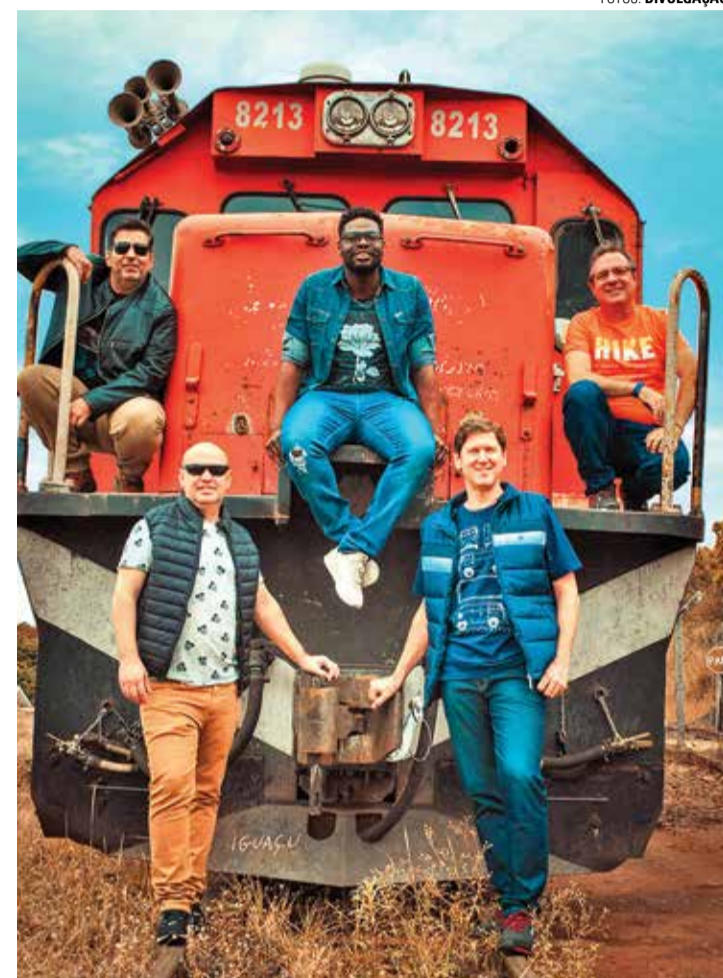
TUDO O QUE EU QUERIA - De volta à ativa e com novo vocalista, Mr. Zaap lança música e videoclipe

Para os fãs, fica a boa notícia: a Mr. Zaap tem outros projetos em andamento e não descarta a possibilidade de