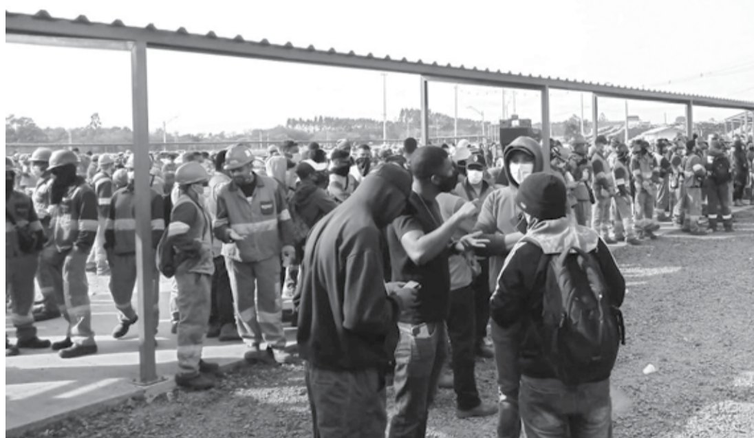
FIM DO IMPASSE - Bracell assumiu dívida da Niplan e começou a pagar trabalhadores nessa sexta-feira; grupo realizou várias manifestações na semana passada

Questionado sobre o ressarcimento, Stefanini garantiu que a empresa vai cobrar cada centavo. "Vamos buscar ressarcimento e reparação dos danos, inclusive à imagem da Bracell, alvo de citações inverídicas e levianas que fizeram com que uma empresa que passou 26 meses fazendo um projeto em plena a pandemia tivesse problemas na reta final por conta de covardia de parceiro mal escolhido", lamentou.