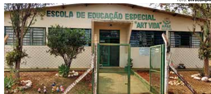
BENEFICENTE - Venda do pão com pernil visa arrecadar recursos

Adesões para a venda de pão com pernil podem ser adquiridas por R$ 15