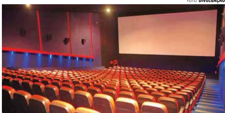
SOLIDARIEDADE - Objetivo da campanha é levar os pequenos ao cinema para comemorar o Dia das Crianças

do para a conta do Rotary Club através da chave PIX 14997417331. Outras informações podem ser obtidas pelos telefones (14) 99606-8144 e (14) 99736-0822. ■