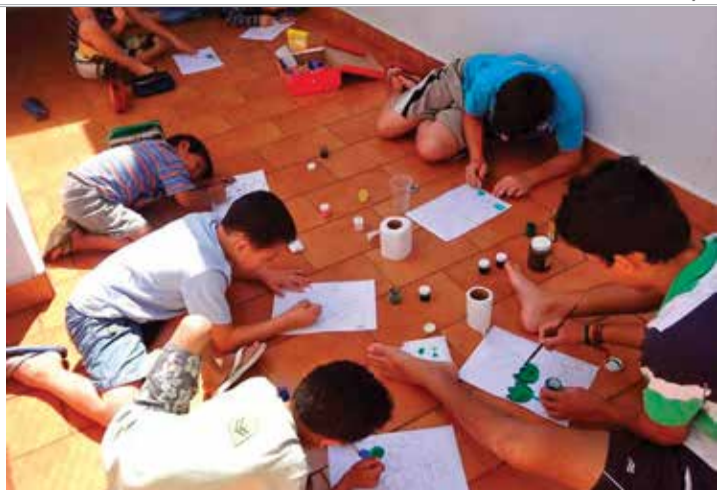
AJUDA - Casa Abrigo pede doações para auxiliar dois acolhidos com necessidades especiais

Com capacidade para abrigar 20 pessoas, a Casa está superlotada, funcionando 50% acima de sua capacidade, com 31 crianças e adolescentes com idade entre dois meses e 17 anos.