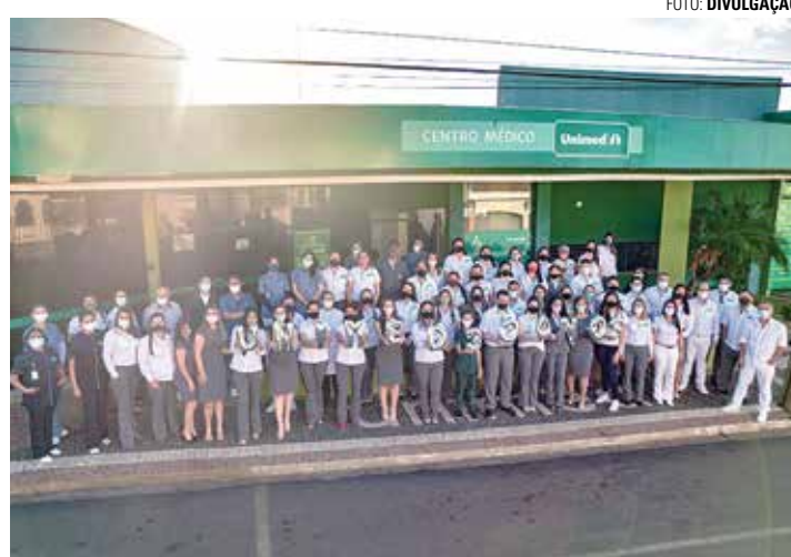
TRÊS DÉCADAS DE HISTÓRIA - Na segunda-feira (13), Unimed completa 30 anos de atuação em Lençóis, Macatuba, Areiópolis e Borebi

A Unimed reformou e ampliou o espaço para a realização de exames de endoscopia e colonoscopia. "Montamos uma clínica nova e moderna. Investimos nisso para que nossos beneficiários tenham conforto e confiança em nosso serviço de endoscopia e colonoscopia,