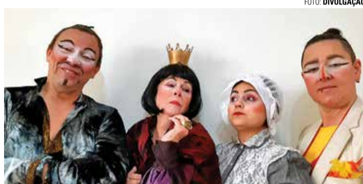
INFANTIL - Peça teatral vai ao ar a partir das 17h deste domingo (29)