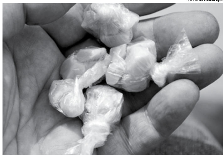
ILÍCITO - Polícia Militar apreendeu 32 pedras de crack e R$ 20 em espécie