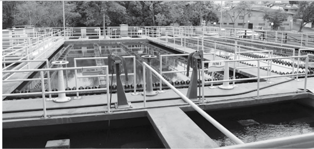
MELHORIA - Custeadas integralmente com recursos do SAAE, obras demandam investimento total de aproximadamente R$ 8,5 milhões em duas etapas

O diretor da autarquia explica que um dos objetivos do projeto é melhorar a qualidade da água captada para distribuição aos usuários. Segundo Cagarete, sem a influência da ocupação urbana e demais fatores inerentes à atividade hu-