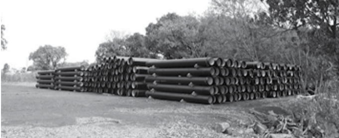
PREPARATIVOS - Empresa vencedora da licitação já iniciou a distribuição da tubulação ao longo do Rio Lençóis

A empresa vencedora da licitação, realizada em meados do ano passado, foi a Amaralina Construções e Empreendimentos, de Marília, que já está fazendo a montagem da estrutura de