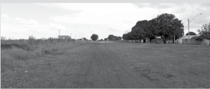
CECAP - SAAE aguarda liberação de convênio pelo Governo do Estado para licitar perfuração de poço profundo e construção de reservatório

Outro projeto da autarquia que visa melhorar o abastecimento de água na cidade é a construção de um novo reservatório e a perfuração de mais um poço profundo na Zona Leste, mais precisamente da região da Cecip, que conta com cerca de 3 mil imóveis e abriga, aproximadamente, 13,5 mil pessoas. Para a viabilização da obra, foram desafiados dois terrenos destinados à implantação de uma área de lazer, que foram reclassificados para uso institucional com aprovação da Câmara Municipal.