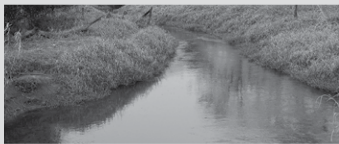
ALERTA - Com pior crise hídrica dos últimos 91 anos, Cagarete pede que população economize água; Rio Lençóis perdeu metade do volume

Apesar dos altos investimentos, o diretor do SAAE alerta a população sobre a importância do uso consciente de água, lembrando que o Brasil enfrenta a pior crise hídrica dos últimos 91 anos, com grandes rios atingindo níveis preocupantes que comprometem o fornecimento de água e já impõem racionamento a diversas cidades, sem contar o desabastecimento dos reservatórios das principais hidrelétricas, que ameaça provocar um colapso na geração de energia elétrica em todo o país.