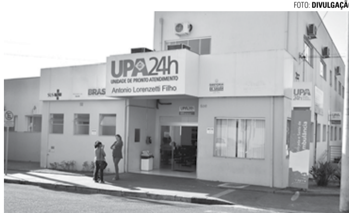
ATENDIMENTO - Motoqueiro, com diversos ferimentos causados pelo acidente, foi socorrido e encaminhado à UPA

A PM foi acionada e compareceu ao local da ocorrência, onde a vítima, M.I.S., de 32 anos, estava sendo socorrida pelo Corpo de Bombeiros para ser encaminhada à UPA. O condutor da moto teve escoriações na face, ombro e braço esquerdos, e sangramento pelos ouvidos.