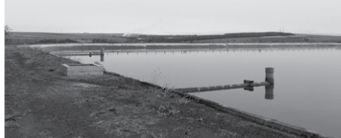
ESGOTOS - Estação de Tratamento de Esgotos localizada na região da antiga Fazenda Lageado também deve receber investimento em breve