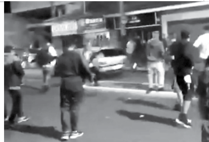
CONFUSÃO - Aglomerações na Av. Coronel Virgílio Rocha incomodam moradores de Macatuba desde o ano passado, como na imagem

Ele explica que a PM mantém duas viaturas aos finais de semana, que realizam rondas até as 2h e 6h da manhã, respectivamente. No dia 15, um traficante de drogas foi preso e teve que ser transferido para a CPJ (Central de Polícia Judiciária) de Bauru, deixando a cidade sem viaturas. Sem fiscalização, a aglomeração saiu do controle e uma briga se iniciou. Dois indivíduos ficaram feridos e o autor da agressão, que, segundo investigações, portava uma