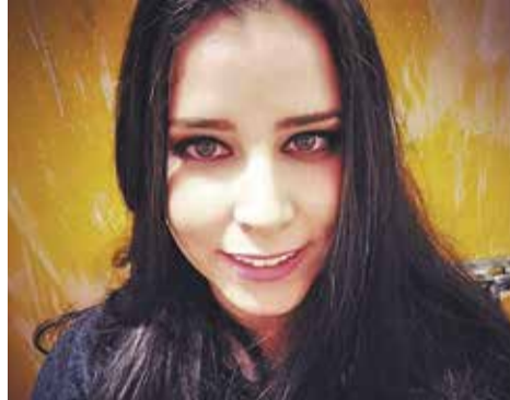
Dri Botaro, quinta-feira (24)