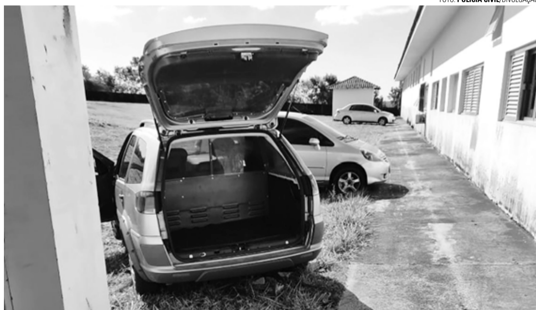
PRISÃO - Suspeito foi detido nos fundos do hospital de Areiópolis, onde dava plantão