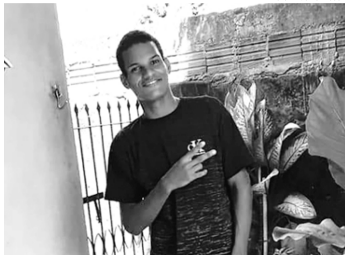
SEM PISTAS - Família do jovem busca informações há quase duas semanas

De acordo com ela, o jovem se mudou do Mato Grosso para Lençóis Paulista em fevereiro de 2020 e não conhecia