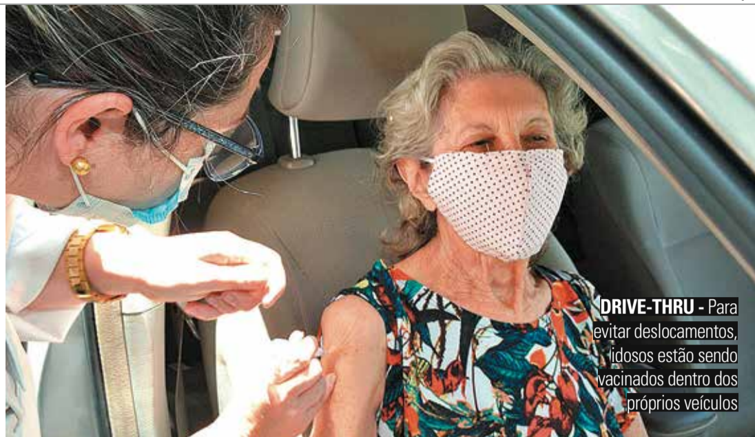
DRIVE-THRU - Para evitar deslocamentos, idosos estão sendo vacinados dentro dos próprios veículos