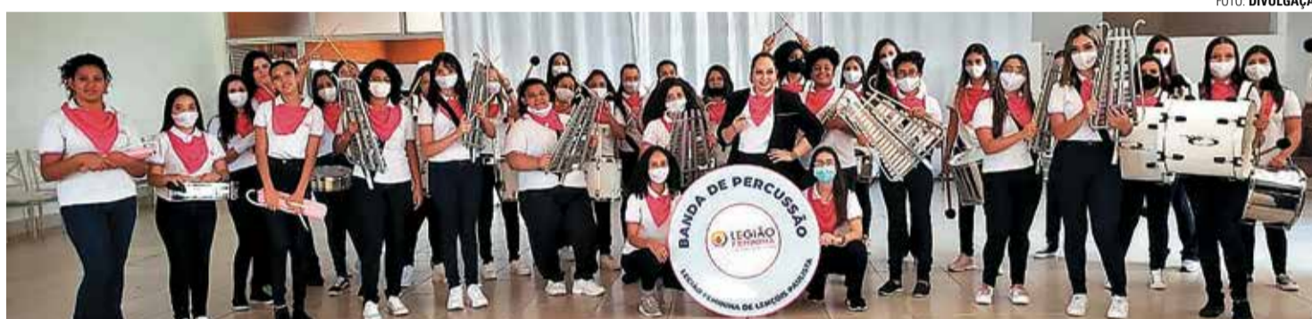
SUCESSO - Banda de Percussão da Legião Mirim Feminina realizou sua primeira apresentação no dia 4 de dezembro

Fundada em 1980, a Legião Mirim Feminina de Lençóis Paulista está sempre buscando contribuir para a construção de novos conhecimentos que auxiliem no desenvolvimento das jovens. A criação de uma banda de percussão era um desejo antigo da instituição, idealizado pelos fundadores, diretoria e colaboradores desde sua fundação, há mais de 40 anos. Em 2020, finalmente, o sonho se tornou realidade.