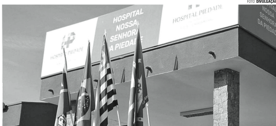
NOVO COMANDO - Hospital Piedade passará a administrar UPA e demais serviços de urgência e emergência