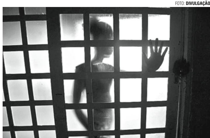
É LEI - Legislação brasileira caracteriza como estupro de vulnerável qualquer conjunção carnal ou ato libidinoso praticado contra menores de 14 anos, mesmo com consentimento

À Polícia Militar, que registrou a ocorrência por volta da 1h40 da sexta-feira (12), V.R.B afirmou que depois de trocar mensagens com G.I.O. por três dias, aceitou ir até sua residência para assistir a um filme. No local, de acordo com a jovem, o indivíduo começou a tocá-la de maneira imprópria e seguiu até consumir o ato sexual, mesmo