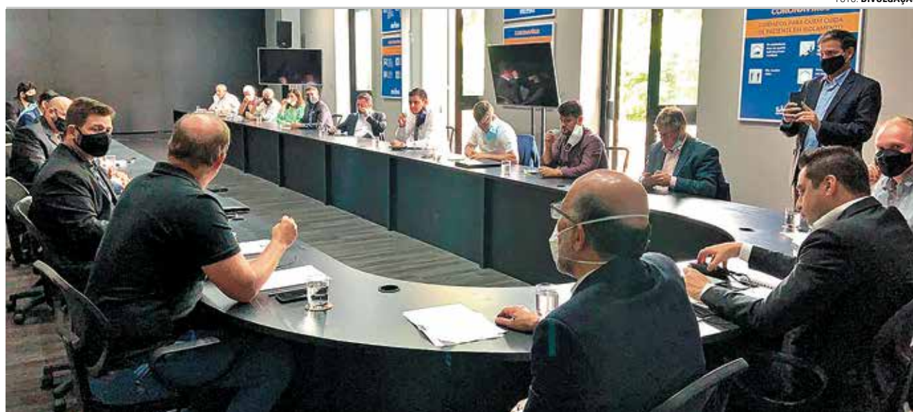
AUDIÊNCIA - Grupo de prefeitos esteve em São Paulo na quarta-feira (17) cobrando implantação de leitos para pacientes de Covid-19

Após ter recurso negado, Prefeitura de Lençóis tem até o final de abril para renomear espaços como Recinto de Exposições José Oliveira Prado, Escola Ézio Paccola, Parque do Povo José Antonio Marise, entre outros