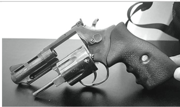
EM MÃOS ERRADAS - Arma roubada, similar à destacada na imagem, está registrada em nome da vítima

De acordo com o idoso, o suspeito revirou os cômodos da casa até chegar ao seu quarto, onde encontrou R$ 1 mil em espécie, além de um revólver calibre 38, da marca Taurus, com capacidade para seis munições. A arma, registrada no nome da vítima, estava carregada e tinha outros seis cartuchos extras. A.N.F. relatou que tentou reagir, mas foi empurrado pelo ladrão, que deixou a casa pelo portão da frente.