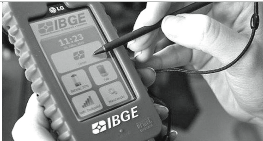
RECENSEAMENTO - Adiado no ano passado, Censo Demográfico do IBGE deve começar em agosto

Macatuba terá uma vaga para agente censitário municipal, duas para agente censitário supervisor e 14 para recenseador. Em Areiópolis a oferta é de uma vaga para agente censitário municipal, uma para agente censitário supervisor e 10 para a função de recenseador. Em Borebi, além de duas vagas para recenseador, exclusivas para a cidade, serão oferecidas uma vaga para agente censitário municipal e três para agente censitário supervisor, essas, porém, também contemplam os municípios de Paulistânia e Agudos.