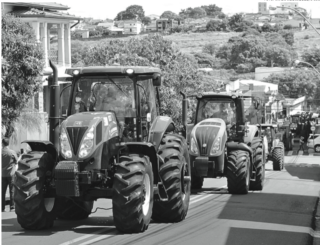
TRATORAÇÃO - Manifestação contra o aumento do ICMS percorreu diversas ruas de Lençóis na quinta-feira (7)

Em Lençóis Paulista e Macatuba houve "Tratoração" organizado pela Ascana, com apoio da Acilpa e da ACE; participaram quase 150 cidades