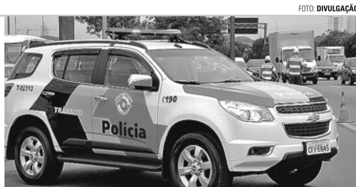
OPERAÇÃO - Policiais militares trabalham para garantir a continuidade da redução dos indicadores criminais

ve a apreensão de 30 quilos de drogas e nove armas de fogo. Durante a operação 9.585 veículos foram vistoriados, sendo 98 motoristas autuados por consumo de álcool, recusa ao teste do bafômetro e embriaguez ao volante. A PM também recuperou 26 veículos produtos de roubo ou furto.