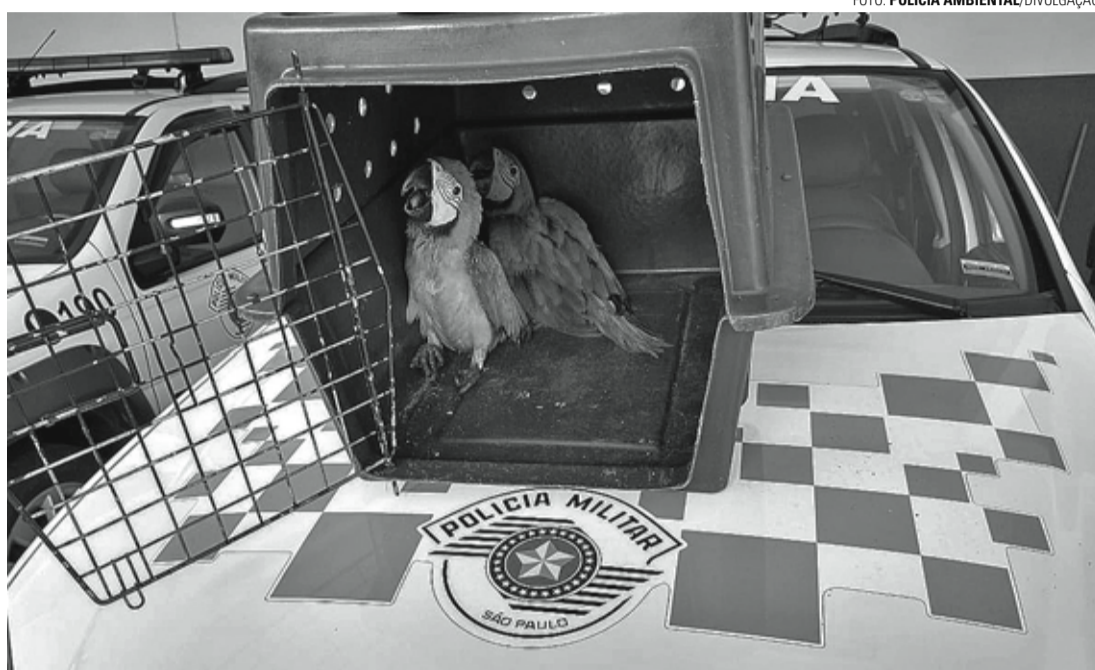
ATUAÇÃO - Polícia Ambiental salvou 18 mil animais silvestres mantidos em cativeiro em 2020

Ao longo do ano, o policiamento ambiental também permitiu apreender e resgatar 18 mil animais, dando continuidade ao