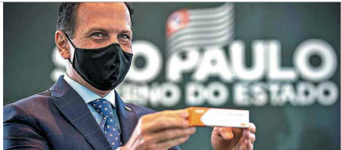
CORONAVAC - Governador realizou uma teleconferência com prefeitos para tratar do Plano Estadual de Imunização

Segundo o Governo do Estado, já foram recebidas aproximadamente 10,8 milhões de doses da CoronaVac da China e a expectativa é que com a produção feita pelo Instituto Butantan a quantidade su-