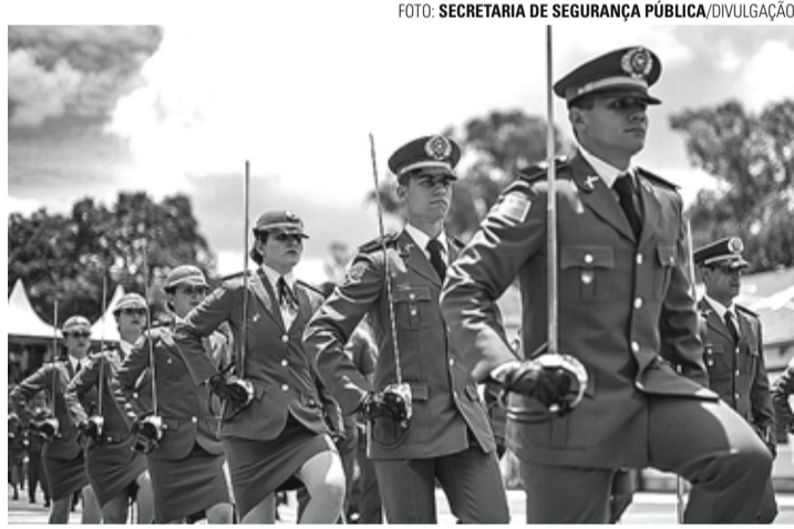
CARREIRA - Salário inicial para a vaga de aluno-oficial é de R$ 3.268,33

Os candidatos interessados devem se inscrever exclusivamente pelo site da Fundação Getúlio Vargas ( https://portal.fgv.br/ ). No ato, é necessário selecionar um dos 11 municípios onde serão aplicados os exames de conhecimento geral. O valor