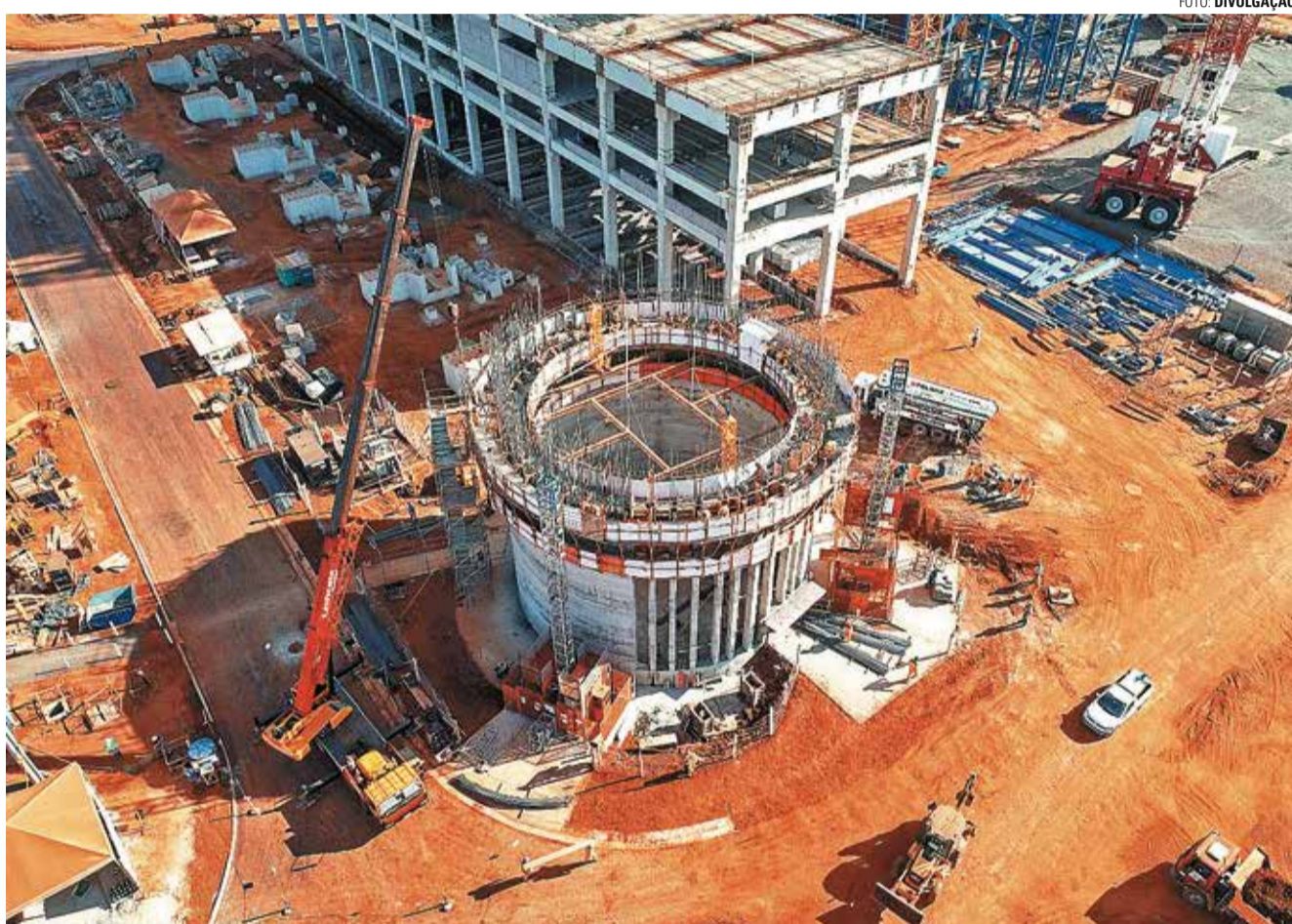
MEGAEMPREENHIMENTO - Obras de expansão da Bracell empregam milhares de trabalhadores e contribuem para o ótimo momento

Depois de uma vida inteira trabalhando, o segurado da Previdência Social precisa enfrentar um grande desafio para conseguir a desejada e merecida aposentadoria: lentidão no processo administrativo do INSS (Instituto Nacional do Seguro Social). A demora na análise de aposentadoria é desgastante e desanima quem precisa do benefício para sobreviver. A7