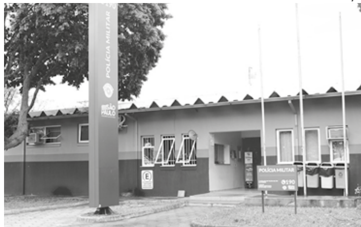
SEGURANÇA - PM atribui queda da criminalidade ao trabalho conjunto de várias forças policiais

O oficial da PM também cita o trabalho de outras equipes de segurança. "É importante ressaltar que temos uma base em Alfredo Guedes, que ajuda em muito no controle criminal na região rural. Então, é um conjunto de fatores que podemos citar, inclusive com o trabalho árduo com a Polícia Civil, que nos ajuda a desvendar os crimes em operações com as equipes. Reduzindo os crimes, aumentamos a sensação de segurança de toda a população", completa Pelegrin.