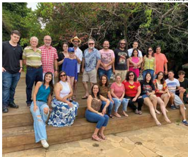
ENCONTRO - Primeira confraternização de final de ano da Alelp ocorreu no último sábado (3)

O presidente revela que há uma lista de 10 escritores que, em breve, podem ingressar na Alelp, mas reitera que as portas da entidade estão abertas para