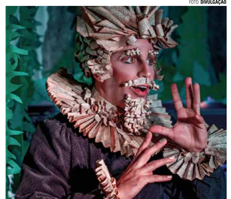
LÚDICO - Fábulas escolhidas para compor o projeto prometem cativar expectadores

Espectáculo passeia pelo universo do autor que é considerado referência até os dias atuais