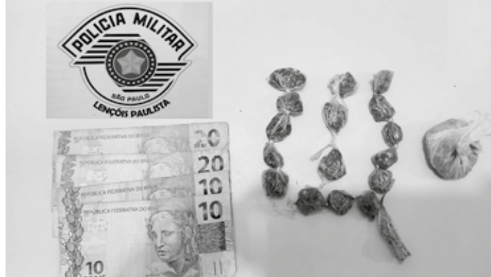
APREENSÃO - Polícia Militar apreendeu 17 porções de maconha e R$ 60 em espécie