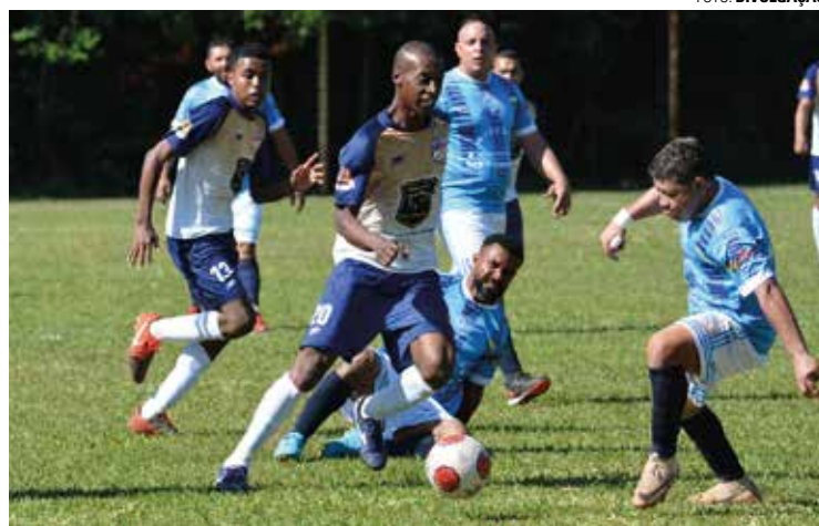
DUELO - Nova Lençóis (calção escuro) enfrenta o Reduto Atleticano por vaga na final

Segundo a Secretaria de Esportes e Recreação, a competição terá uma pausa nas próximas semanas por conta das festas de final de ano. O título da Copa União será decidido em jogo único marcado para o dia 8 de janeiro, no Estádio Municipal Eugênio Paccola, na Cecap. ■