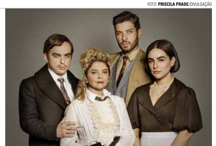
MONTAGEM - Dirigida por Jô Soares, peça é adaptada do texto original escrito em 1938 pelo dramaturgo britânico Patrick Hamilton

várias cidades desde a estreia, tem entrada gratuita, porém, como os ingressos começaram a ser distribuídos na última quarta-feira (7), os interessados devem consultar a disponibi-