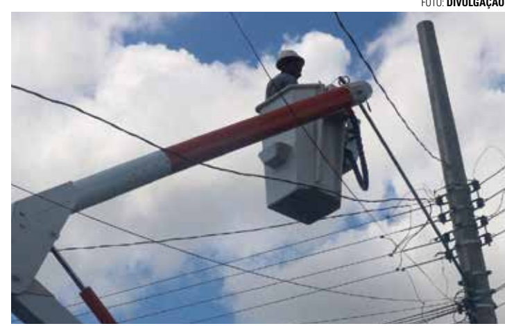
CRONOGRAMA - Trabalho está sendo realizado no Jardim Cruzeiro e deve ser concluído em toda a cidade até o final de janeiro

As lâmpadas de LED são totalmente sustentáveis, pois não contêm nenhum elemento poluente ou contaminante,