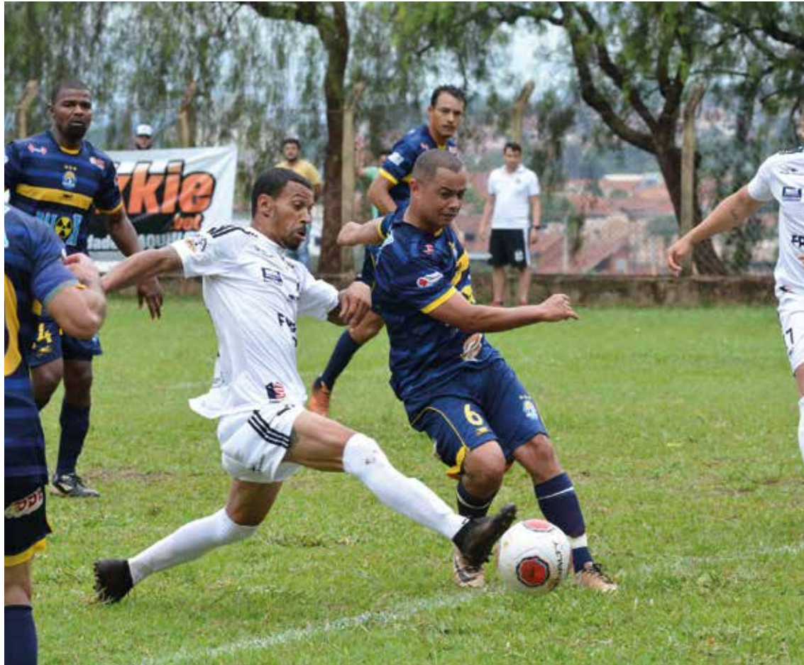
TUDO OU NADA - Após vitória sobre o Grêmio Cecap, Atleticano Lençoense (uniforme branco) encara Atlético Primavera por tricampeonato da Copa imprensa

O campeonato contou com as oito equipes que obtiveram as melhores colocações na Série A do Campeonato Amador deste ano, além de seis agremiações da região, que foram convidadas