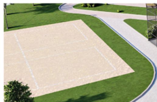
Quadras de areia