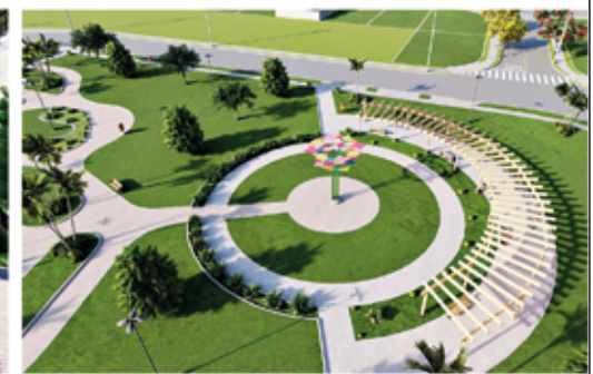
Pista de caminhada com gazebo

TODO SISTEMA DE LAZER JÁ ESTÁ PRONTO PARA USUFRUIR NO VILA DA MATA I