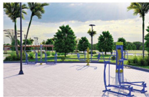
Academia ao ar livre