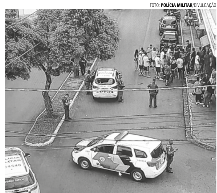
MOVIMENTAÇÃO - Na última sexta-feira (2), populares se amontoaram na Avenida dos Estudantes

Medida será tomada após diversas reclamações de moradores da Avenida dos Estudantes; local virou ponto de encontro de jovens e aglomerações são frequentes