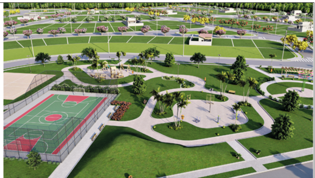
Praça com pista de caminhada, playground, quadras e academia ao ar livre

Excelente localização, fácil acesso e muito lazer para toda família.