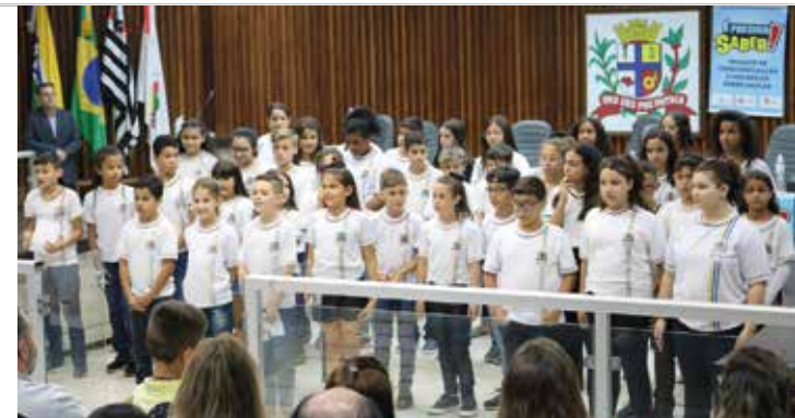
BENEFÍCIO - Vários projetos voltados às crianças são mantidos com recursos do IR, como o 'É preciso saber', de prevenção ao uso de drogas

"O contribuinte tem a possibilidade de apoiar iniciativas sociais e educacionais destinando parte de seu Imposto de renda devido. Isso é muito importante, pois contribuirá para o financiamento de