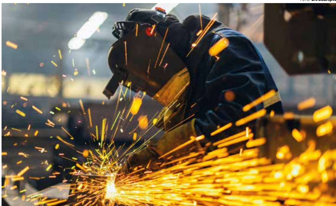
DOMÍNIO TOTAL - Indústria já criou mais de 1,6 mil empregos neste ano em Lençóis Paulista