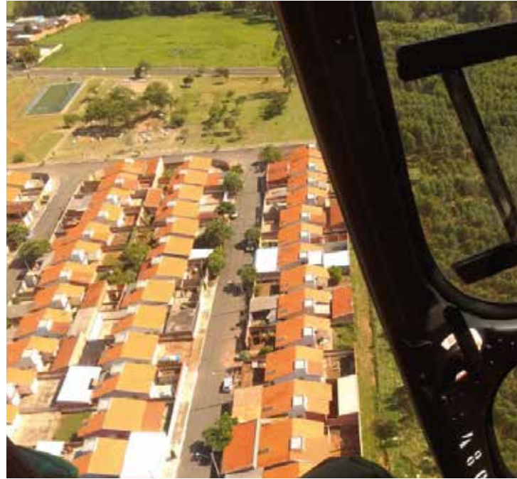
APOIO - Helicóptero Águia sobrevoou a região durante a operação em cumprimento dos mandados de busca, que prendeu cinco pessoas