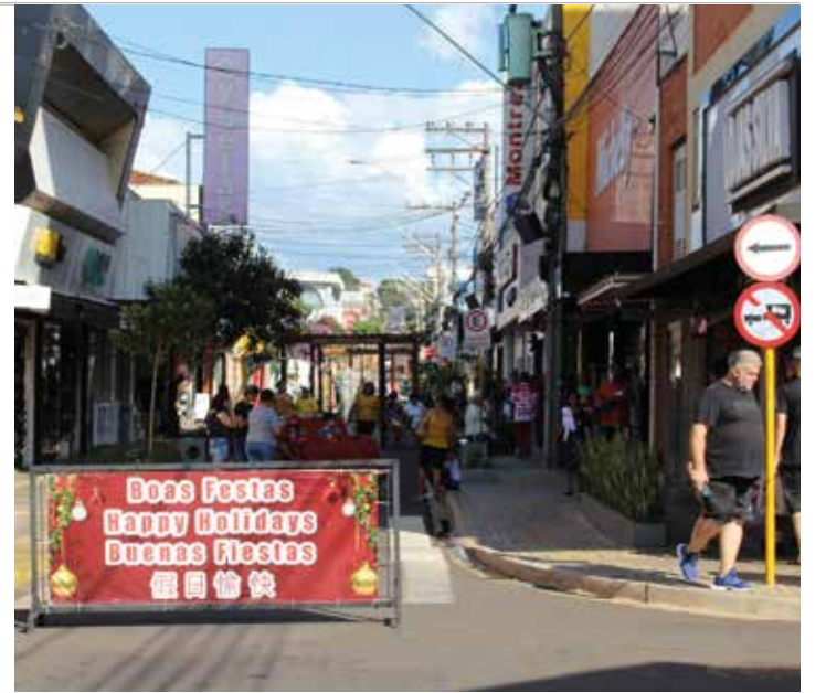
EM ALTA - Comércio deve registrar grande movimentação de clientes até o próximo sábado (24); lojas estão funcionando das 10h às 22h

"Como trabalhamos com muitos departamentos, a época do Natal tem ciclos de picos nos diferentes segmentos. O principal produto para se trabalhar é a decoração natalina, que vende muito de outubro a novembro. Quando as vendas das decorações começam a abaixar, começamos a sentir que os brinquedos começam a emergir", explica a proprietária.