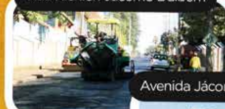
Avenida Jácomo Augusto Paccola