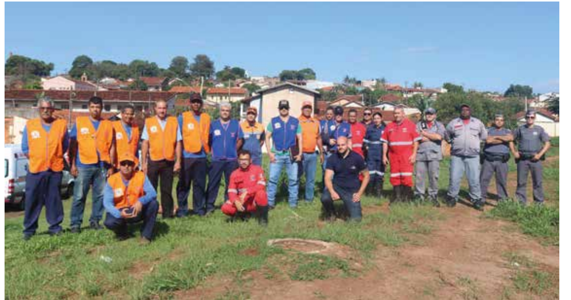
TREINAMENTO - Ação contou com membros da PM, Bombeiros, SAMU e servidores da Prefeitura Municipal