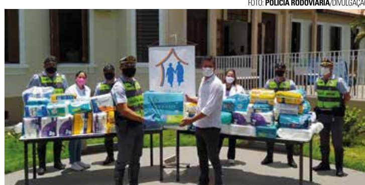
BOA AÇÃO - Fraldas e absorventes geriátricos serão destinados a entidades de Jaú e Bauru; na foto, itens arrecadados em 2021

A campanha já está em sua terceira edição na cidade de Jaú, estreando agora em 2022 em Bauru. No ano passado, mais de 1,6 mil fraldas geriátricas foram arrecadadas em Jaú. Vale reforçar que os itens doados podem ser de qualquer tipo, marca ou tamanho. A polícia também ressalta que doações em dinheiro