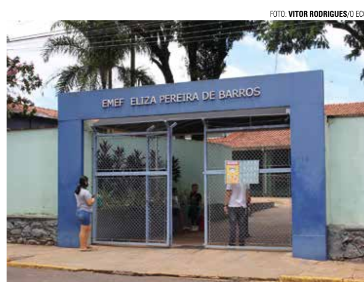
RATEIO - Benefício vale para profissionais da rede municipal de ensino