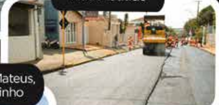
Acesso da Rodovia Osni Mateus, entrada do bairro Campinho