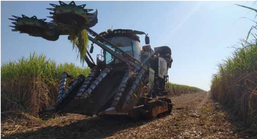
POSITIVO - Produção da Safra 2022/2023 foi de aproximadamente 75,4 toneladas de cana-de-açúcar por hectare