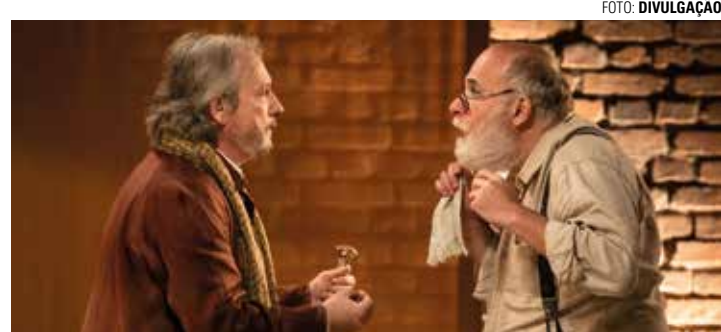
ADAPTAÇÃO - Peça tem texto do autor austríaco Thomas Bernhard