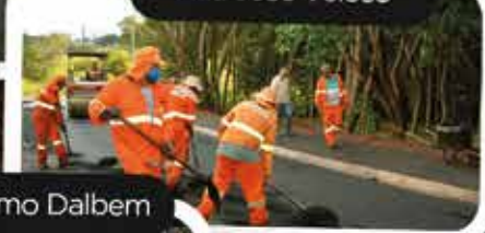
Rua Richieri Jácomo Dalbem