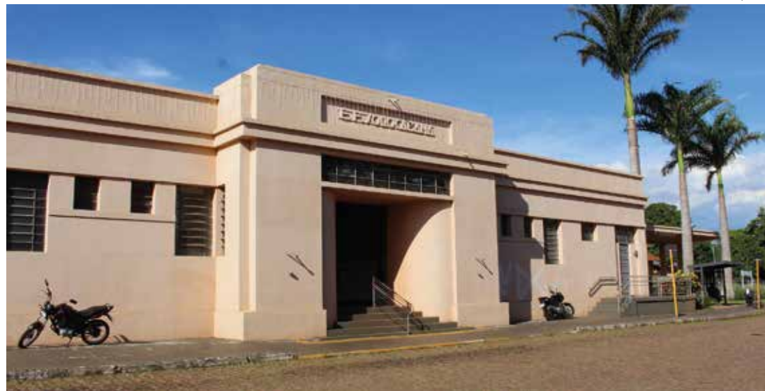
CESTA BÁSICA - Quem requerer à conversão da multa deve entregar cestas básicas na Ação da Cidadania

Também cabe destacar que há uma quantidade mínima de alimentos que devem compor as cestas básicas. São eles: 10 kg de arroz; 2 kg de feijão; 5 kg de açúcar cristal; dois pa-