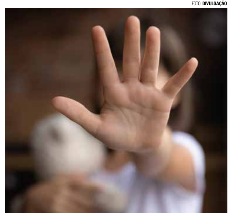
ESTUPRO DE VULNERÁVEL - Crianças de 13 e 10 anos denunciaram o próprio pai por abuso sexual; Polícia Civil segue investigando o caso

Meninas de 13 e 10 anos denunciaram que eram abusadas há sete anos pelo próprio pai