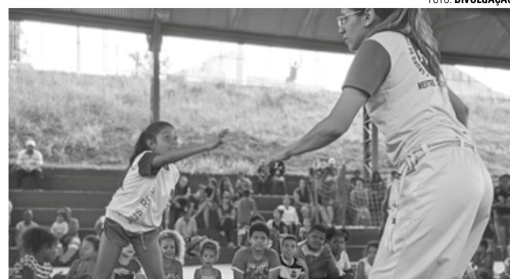
BAIRRO FELIZ - Projeto apresenta diversas atrações; na foto, grupo de capoeira na edição realizada no Jardim Primavera

Projeto voltado às crianças apresenta brinquedos infláveis e outras atividades