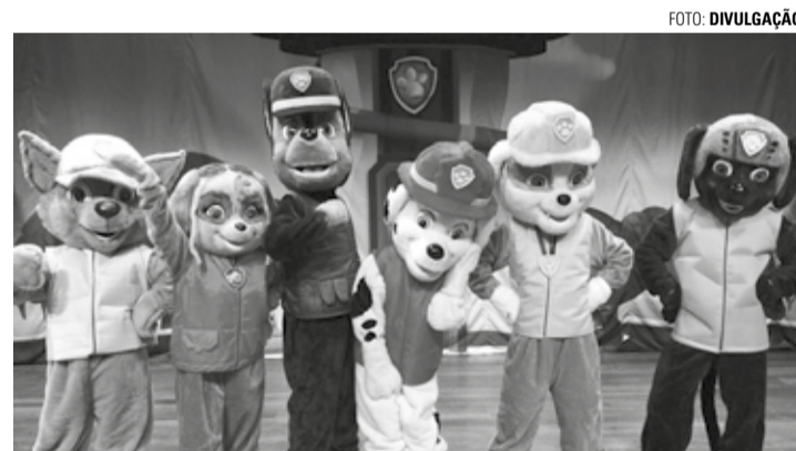
INFANTIL - Festival Kids apresenta espetáculos voltados às crianças

Em três sessões, atrações incluem Masha e o Urso, Patrulha Canina e Palhaços Tic Tac