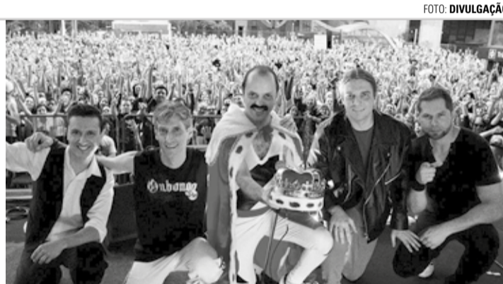
COVER - Grupo Queen Tribute Brazil apresenta clássicos de Freddie Mercury e companhia

Com um trabalho minucioso de performance, sonoridade e figurinos, a banda resgata com fidelidade e emoção as canções clássicas do rock, como 'Bohemian rhapsody', 'We will rock you', 'Under pressure', 'Radio ga ga', 'We are the champions', 'Love of my life', 'Another one bites the dust', 'Somebody to