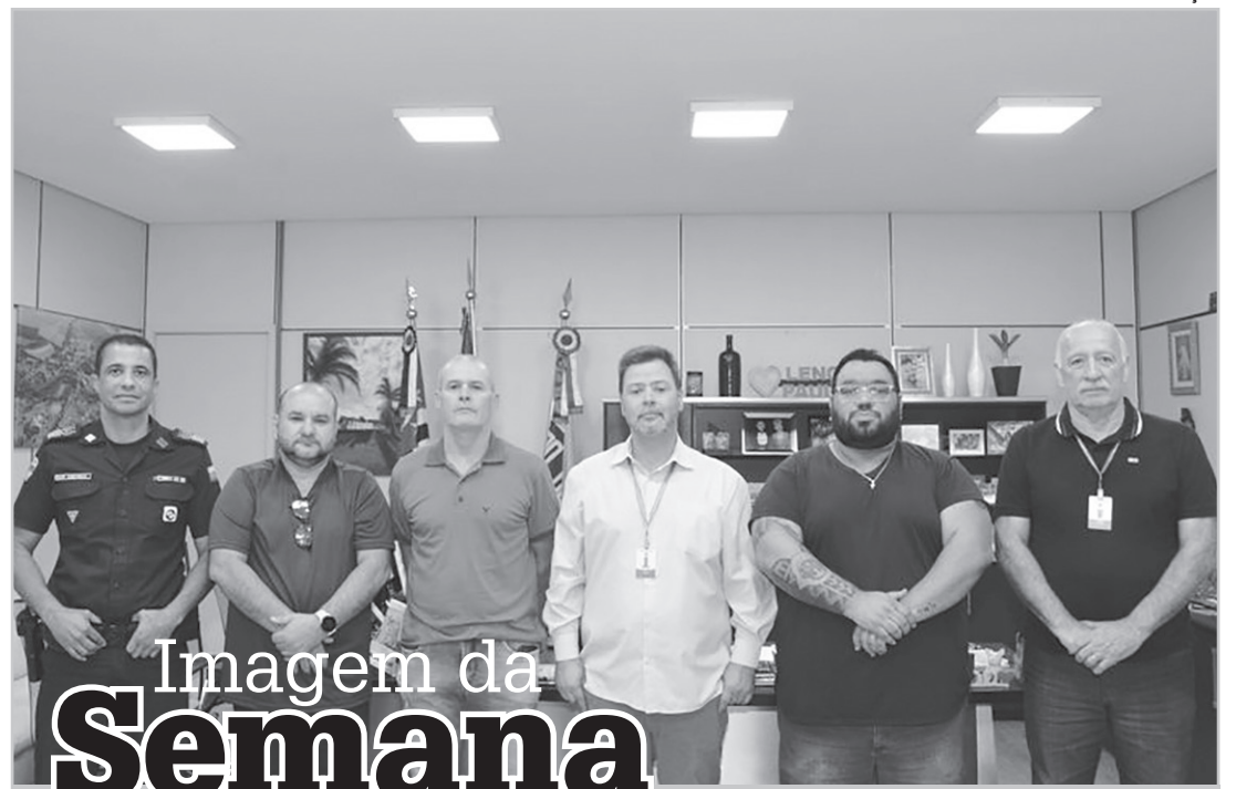
Imagem da Semana

Portanto, se você está tendo algum desses sintomas ou quer avaliar se você tem indicação de tratamento e os subsequentes tipos, procure seu endocrinologista ou ginecologista.