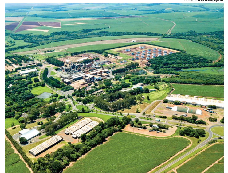
POTÊNCIA - Na foto, Usina São José, em Macatuba, que iniciou a história de sucesso da Zilor Energia e Alimentos; primeira safra ocorreu em 1946

“Mais do que uma homenagem, o reconhecimento que o prêmio dá a entidades e pessoas ligadas ao voluntariado é uma forma de agradecimento e também de incentivo pelo que elas fazem em prol da comunidade da qual também fazemos parte. Isso está no DNA do prêmio. É óbvio que existe a parte comercial, pois o prêmio também abrange todo um pacote de mídia que é oferecido para as empresas e profissionais, mas o caráter social sempre está presente”, completa Laud. ■