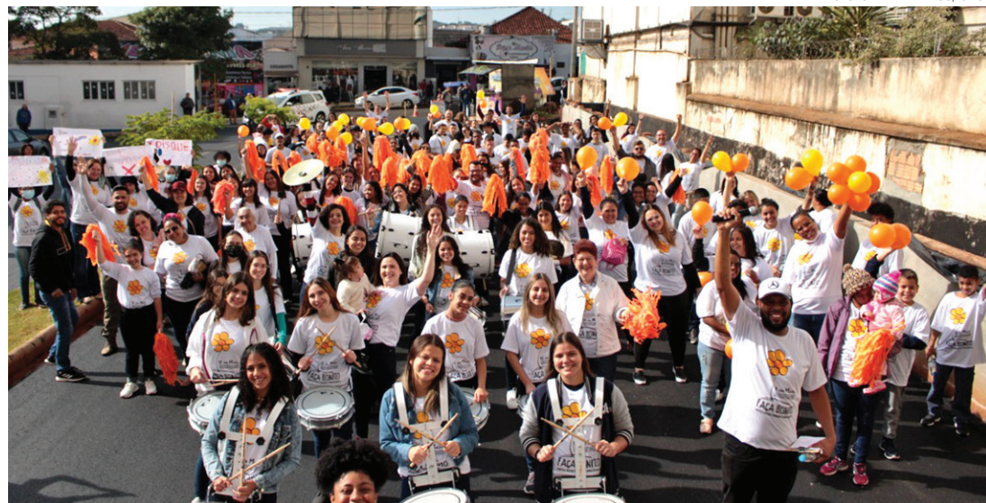
CONSCIENTIZAÇÃO - Ato organizado pelo CMDCA é aberto à participação de toda a comunidade lençoense

Além dos órgãos de proteção infantojuvenil, como CMDCA e Conselho Tutelar, o evento deve contar com a participação do Ministério Público, Polícia Militar, GCM (Guarda Civil Muni-