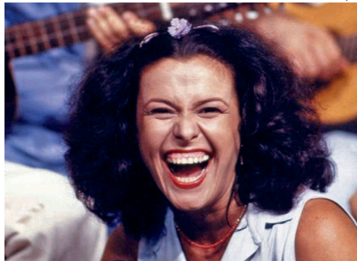
HOMENAGEM - Vida e obra de Elis Regina foi tema escolhido para o sarau