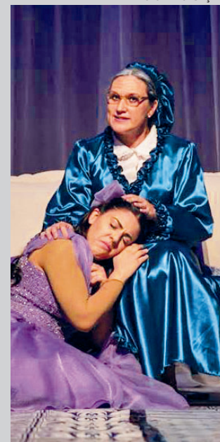
IRENE - Peça narra um conflito de gerações que coloca à prova muitos tabus na década de 1950

1950, o texto narra a história da personagem que dá nome à peça, uma jovem recém-saída de um colégio de freiras, que nada sabe sobre o mundo. Vivendo aos cuidados de Deolinda, sua conservadora avó, Irene se vê em uma trama marcada por sua própria inocência e o medo que sua