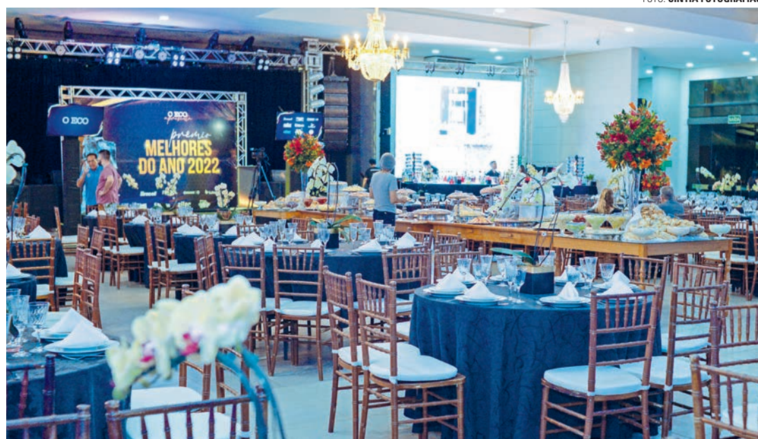
CONTAGEM REGRESSIVA - Com grande expectativa do público, Melhores do Ano tem 70% das adesões fechadas