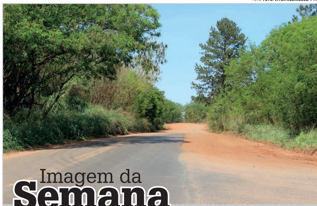
Imagem da Semana

Em suma, o Brasil somente sairá da era das grandes necessidades em que se encontra, quando o grau de cidadania atingir índices de elevação educacional. Quando todos os brasileiros estiverem comendo do mesmo prato cultural e educacional, inseridos no banquete da maior igualdade social, suas mazelas serão gradativamente eliminadas com doses de racionalidade, consciência política, respeito aos contrários e ética. Nesse momento, os braços de Cristo no Corcovado serão associados a um país mais justo, harmônico e solidário.