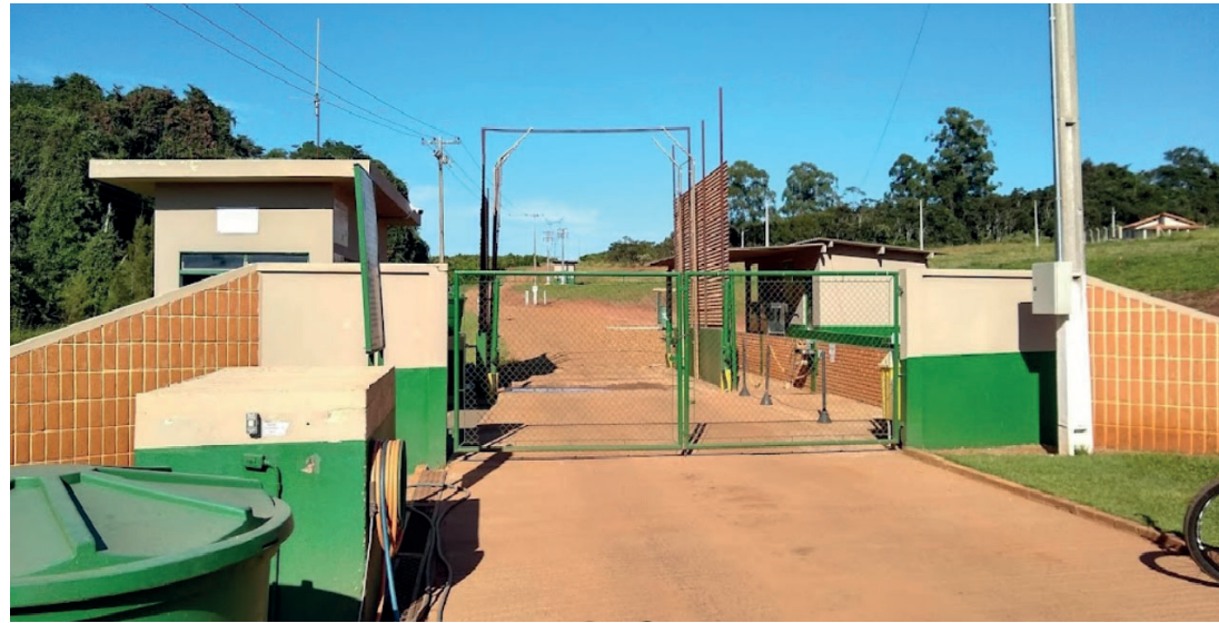
VIOLÊNCIA - Tentativa de roubo foi registrada na noite do último domingo (1), em uma área rural de Lençóis Paulista

Segundo informações, a equipe se deparou com o corpo do homem com apenas um calçado, vestindo duas camisas, duas calças e uma touca ninja. No bolso da calça foram encontrados três telefones celulares, além de uma carteira contendo diversos documentos pessoais. Também