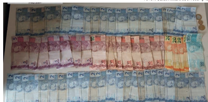
APREENSÃO - Drogas e dinheiro foram apreendidos pela Polícia Militar

Ele informou à PM que vendia entorpecentes para ajudar o pai com despesas de sua casa