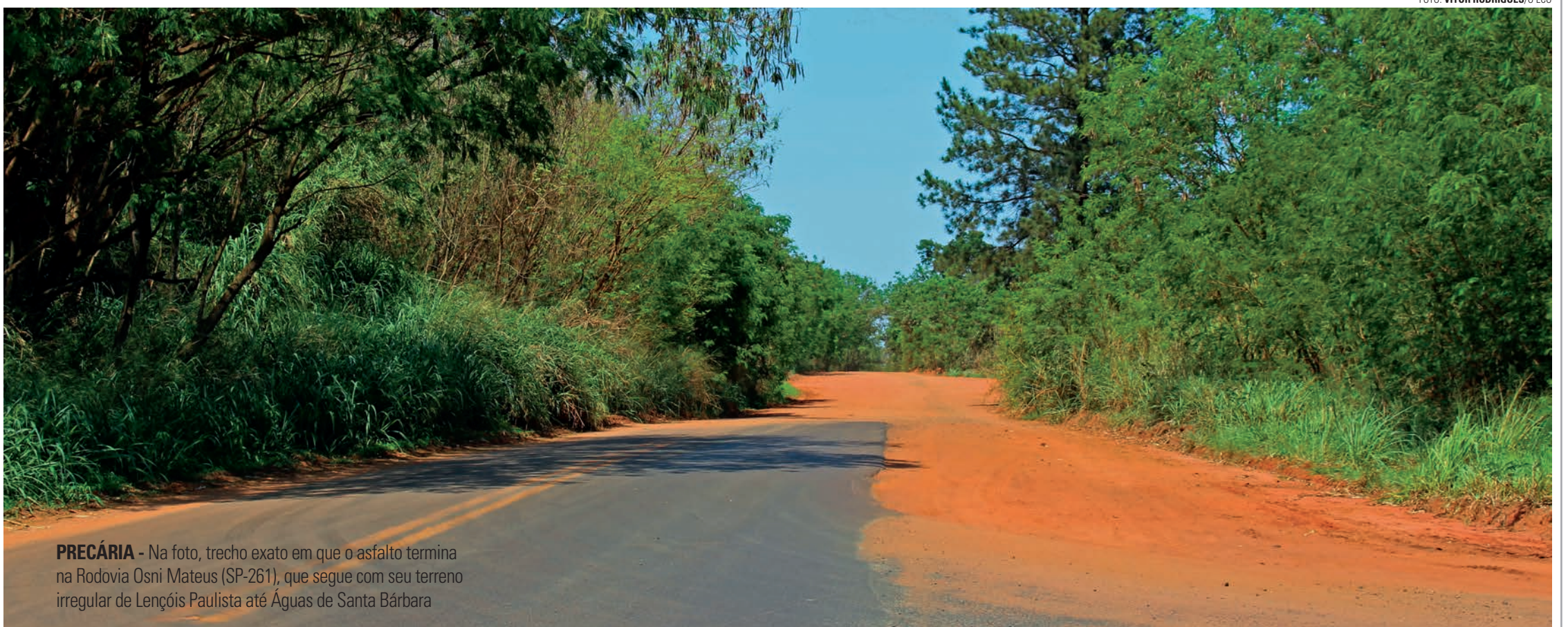
PRECÁRIA - Na foto, trecho exato em que o asfalto termina na Rodovia Osni Mateus (SP-261), que segue com seu terreno irregular de Lençóis Paulista até Águas de Santa Bárbara