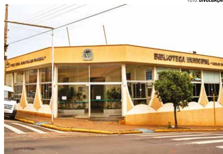
MAIS INFORMAÇÕES - Em caso de dúvidas, estudantes podem entrar em contato com a Secretaria de Educação e Juventude de Macatuba

Os estudantes têm o direito de receber 10 parcelas ao longo do ano (de fevereiro a junho e de agosto a dezembro), a partir de apresentação mensal de comprovante de frequência