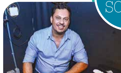
Aros, no Engenho Botequim