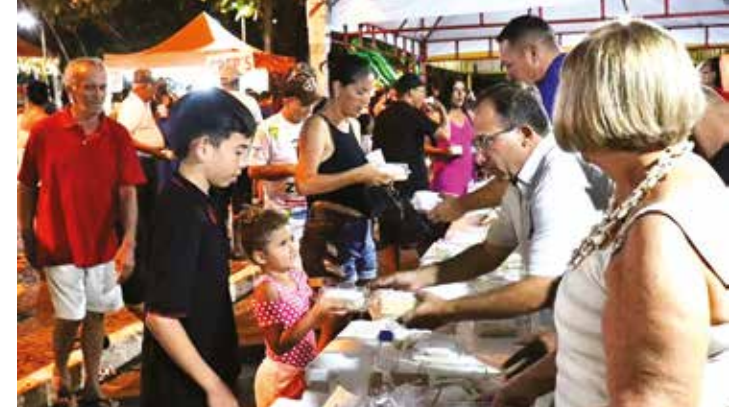
CLIMA DE FESTA - Evento de aniversário de Borebi foi acompanhado por munícipes de todas as idades na noite da última segunda-feira (8)