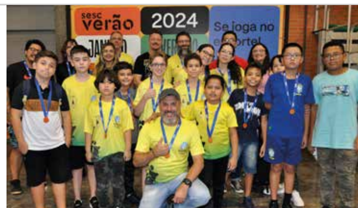
BOM COMEÇO - Delegação lençoense garantiu pódios na primeira etapa

O próximo desafio dos enxadristas lençoenses já é neste