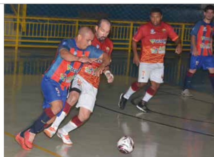
PELA TAÇA - Barcelona (camisa listrada) e Borussia brigam pelo título

O Campeonato dos Servidores também não acabou para Roma (Jurídico) e Slavia Prague (Educação), que chegaram à semifinal superando Real Madrid (Almoxarifado) e RB Leipzig (Esporte) - os jogos, disputados no último sábado (17), terminaram em