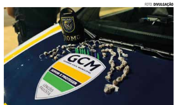
ESCONDERIJO - Após denúncia de uma testemunha anônima, GCM apreendeu porções de crack e cocaína que estavam escondidas na rua

Agentes apreenderam porções de crack e cocaína, mas não localizaram o proprietário