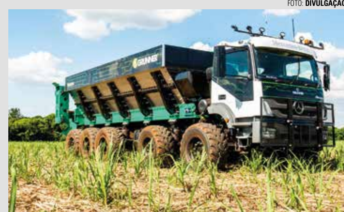
SOZINHA NO MERCADO - Detentora de patente, empresa lençoense tem exclusividade no mercado nacional durante a próxima década

Com a concessão da patente, a Grunner passou a ser a proprietária da patente que envolve ‘conjunto de conversão para aumento de bitola das rodas de caminhões rodoviários