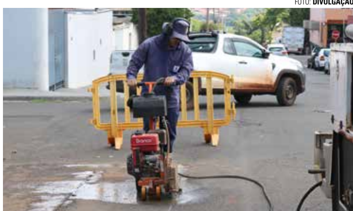
INVESTIMENTO - Iniciada na segunda-feira (19), obra executada pelo SAAE tem orçamento total de R$ 750 mil e está dividida em duas fases

A obra será dividida em etapas. A primeira fase, que deve ser concluída em 90 dias, consiste em aumentar a capacidade de distribuição da água do poço tubular profundo localizado ao lado da Escola Municipal Lina Bosi Canova, que atualmente é de 100