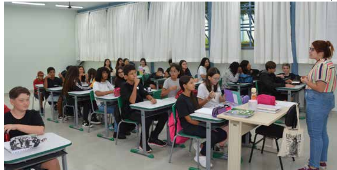
INAUGURAÇÃO - Aulas começaram nesta semana e devem acontecer em período integral gradativamente

Para receber os alunos da rede pública municipal de ensi-