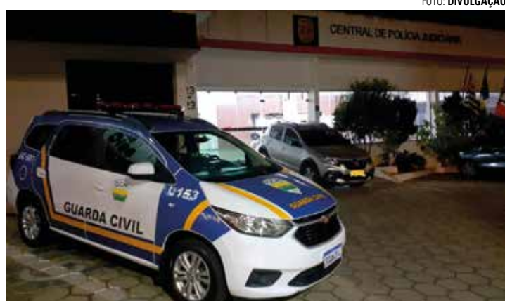
PRISÃO - Homem foi levado à CPJ de Bauru, onde foi preso pelo crime

Após receber uma denúncia de um vigilante, que avistou um homem desmontando uma motocicleta, a GCM se deslocou até o local indicado. Ao se aproximar do endereço, a equipe encontrou E.E.S., de 32 anos, junto com uma