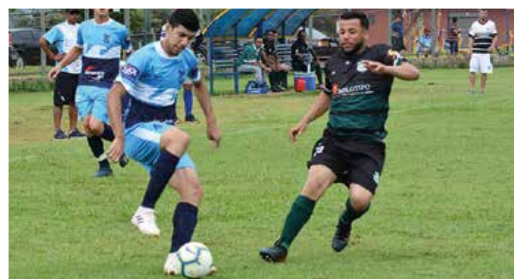
VOLTA AOS GRAMADOS - Campeonato começa no próximo domingo; na foto, registro da final de 2019, vencida pelo União Primavera (uniforme claro)

De acordo com o regulamento, todos jogam contra todos em seus respectivos grupos na primeira fase, com os dois