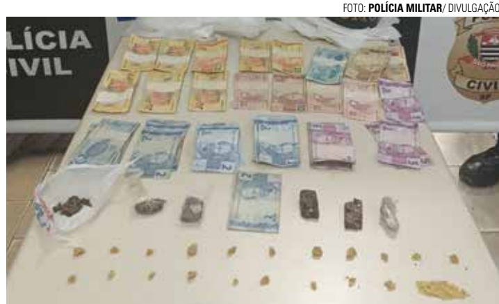
APREENSÃO - Ao todo, foram apreendidos 26g de maconha e 9g de crack

Segundo informações fornecidas pela Polícia Militar, as equipes se deslocaram até