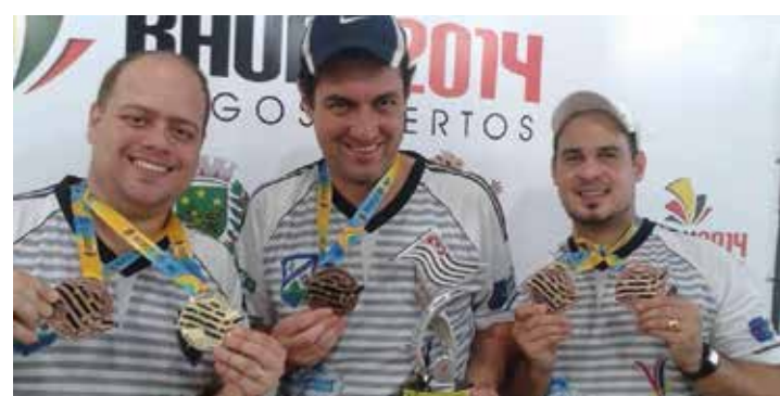
GALERIA - Atleta já conquistou diversos títulos, os mais importantes, no Open da Federação Paulista e nos Jogos Abertos

"Neste ano, devemos promover entre cinco e seis torneios no Circuito Regional de Futebol de Mesa. É um evento que existe desde 2012 e envolve participantes de Lençóis Paulista, Bauru, Botucatu, Barra Bonita e outras cidades. A ideia é trazer alguns desses campeonatos para cá em parceria com a Secretaria de Esportes e Recreação", pontua o atleta, que espera que o destaque dado à modalidade possa despertar o interesse de outros jogadores, principalmente dos mais jovens.