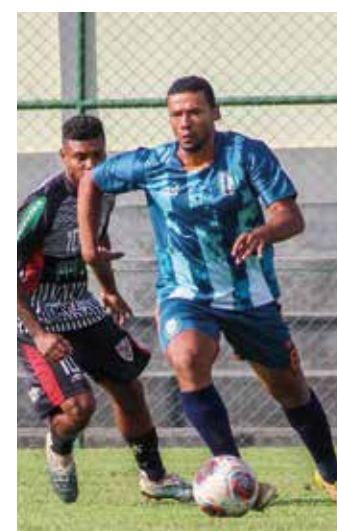
MISSÃO CUMPRIDA - Time A de Borebi (camisa listrada) venceu o Cinza por 3 a 1 e se garantiu nas quartas de final

No Grupo A, o Deportivo Macatuba ganhou de 4 a 3 da representação de Boa Esperança do Sul e avançou em segundo lugar, com seis pontos, deixando o adversário com três. A primeira colocação ficou com o Atlético Primavera (Lençóis Paulista), que chegou a nove pontos com vitória por W.O. sobre o Golinho (Areiópolis), que estava zerado e não tinha mais chance de classificação.