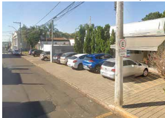
ABUSO - Vítima foi agredida e ameaçada por seu ex-companheiro