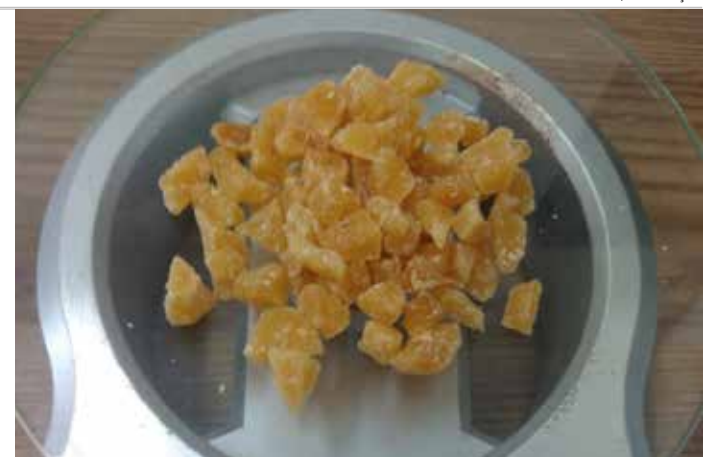
ILÍCITO - Autor do tráfico tentou esconder a droga, mas polícia encontrou e apreendeu 72 pedras de crack e uma porção avulsa durante abordagem