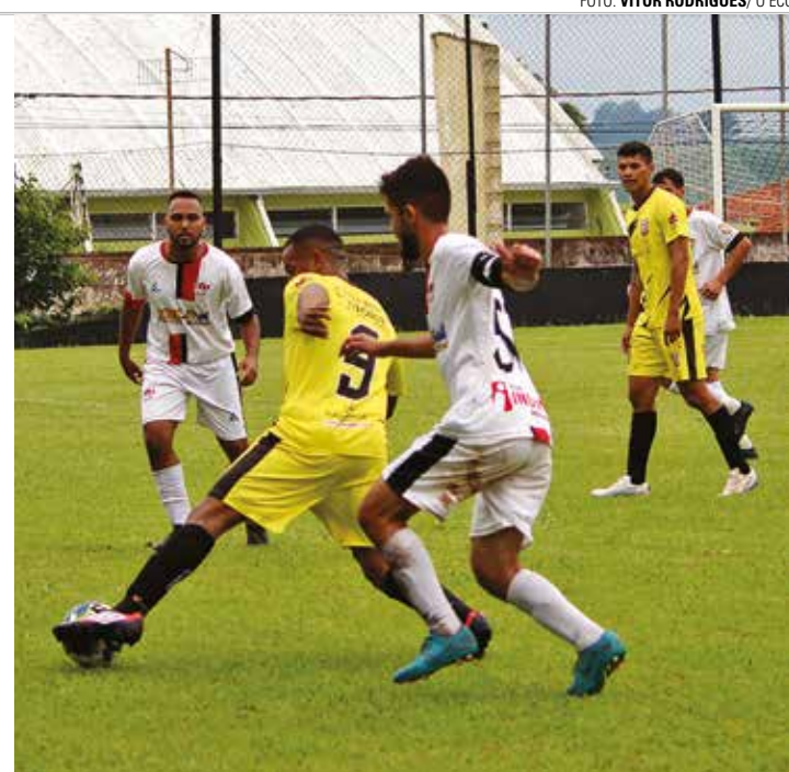
SEGUNDA RODADA - Paulista (uniforme claro) derrotou o Reduto por 7 a 1 em jogo válido pelo Grupo B; disputa aconteceu no último domingo (10)

atletas, membros de comissões técnicas, arbitragem e equipes de apoio. O campeonato é promovido pela Secretaria de Esportes