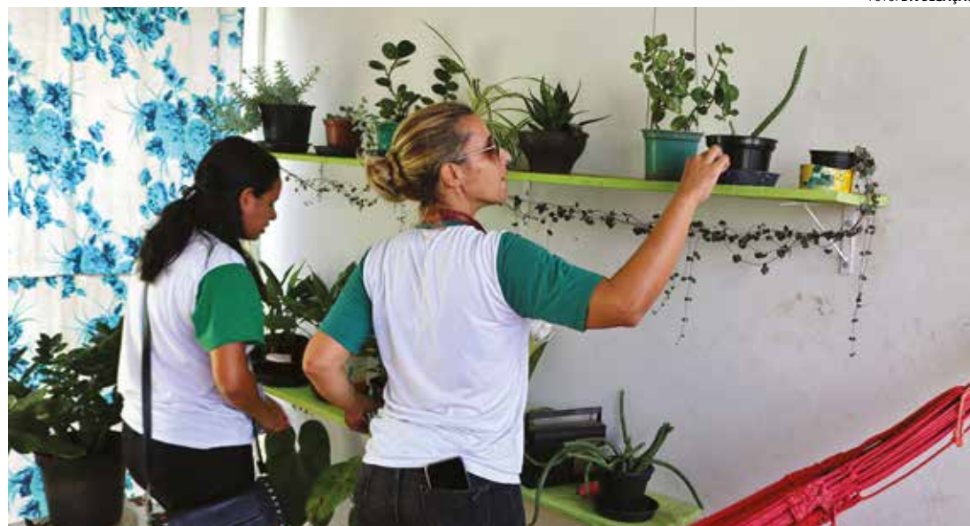
CONSCIENTIZAÇÃO - Agentes comunitários de saúde têm intensificado trabalho de orientação da população

Na microrregião, Macatuba é a cidade com mais casos, com 130 confirmados até quinta-feira (108 autóctones e 22 importados). Segundo a Vigilância Epidemiológica, não havia nenhum paciente aguardando resultado de exame. Os bairros com maior incidência eram o Centro (45) e