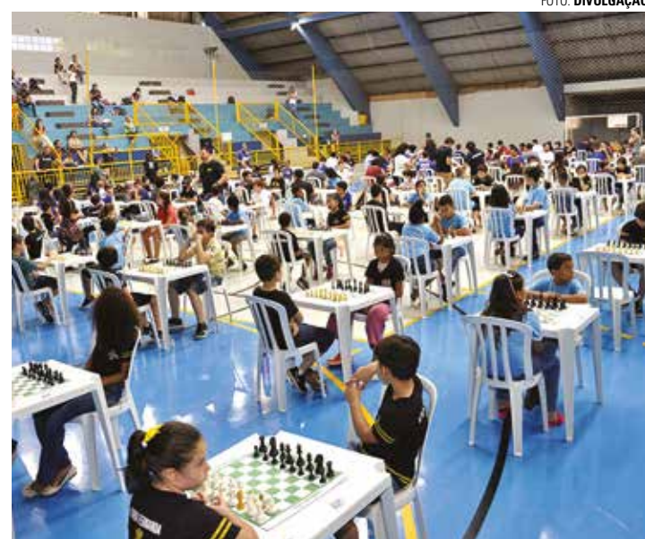
RECORDE - Torneio deve reunir mais de 230 enxadristas de várias cidades de São Paulo e outros estados; delegação lençoense tem 32 representantes