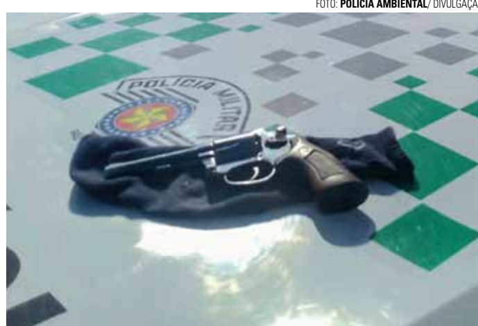
ARMA DE FOGO - Indivíduo foi preso pelo porte ilegal de um revólver

De acordo com as informações fornecidas pela Polícia Ambiental, a equipe realizava uma patrulha preventiva pelas margens do Rio Tietê quando avistou um indivíduo em uma motocicleta