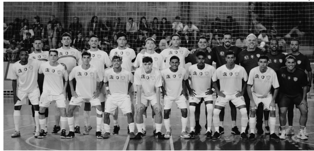
EM CASA - Equipe sub-20 de Lençóis Paulista faz sua estreia no Ginásio Demirzão contra o forte Botucatu Futsal

Montada a partir de uma peneira realizada no mês de janeiro, apenas com atletas do município, a equipe sub-20 masculina de futsal de Lençóis Paulista estreou com derrota na Copa da Liga Paulista de Futsal Junior. Em partida disputada na noite da última quinta-feira (28), na vizinha cidade de Bauru, o time lençoense encarou a forte representação do Futsal Bauru FIB e acabou derrotado pelo placar de 4 a 0.