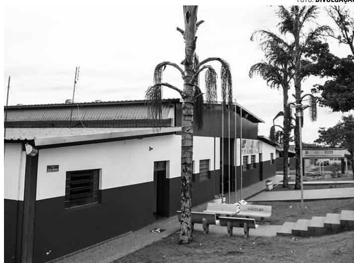
INSCRIÇÕES - Interessados devem comparecer ao CEMP de Macatuba