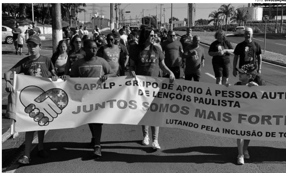
MOBILIZAÇÃO - Evento iniciado em 2017 chega à quinta edição; na foto, participantes da caminhada de 2023

A caminhada do Gapalp, que deve durar aproximadamente uma hora, é aberta a todos os in-