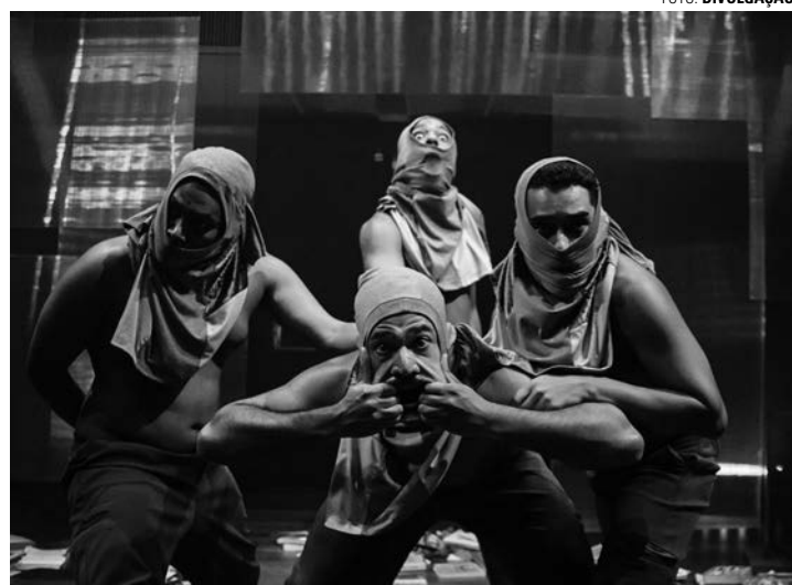
MONTAGEM - Adaptada de romance premiado, peça debate sobre preconceito, discriminação, violência e uma série de outros conflitos

O cenário é o apartamento da família, no qual Pedro observa objetos, fotografias e docu-