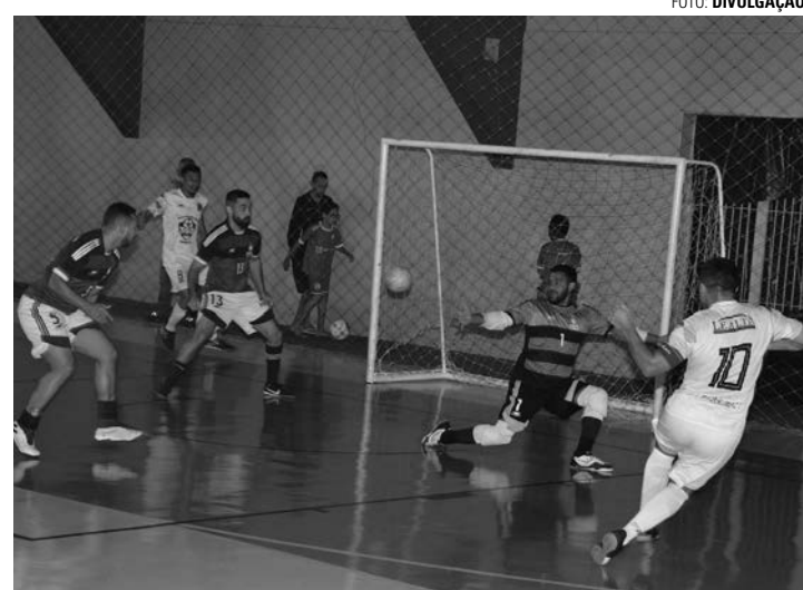
BOLA NA REDE - Jogos disputados na última quinta (28) tiveram média superior a 10,6 gols por partida, a maior da competição até o momento

Na quinta-feira (28), completando a segunda rodada da primeira fase, foram disputados três confrontos. Pelo Grupo B, o Jardim América venceu o Santa