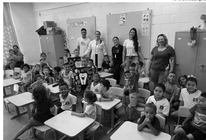
AÇÕES - No mês de março, assunto discutido com alunos foi saúde bucal

Projeto voltado para crianças e adolescentes aborda vários temas com estudantes locais