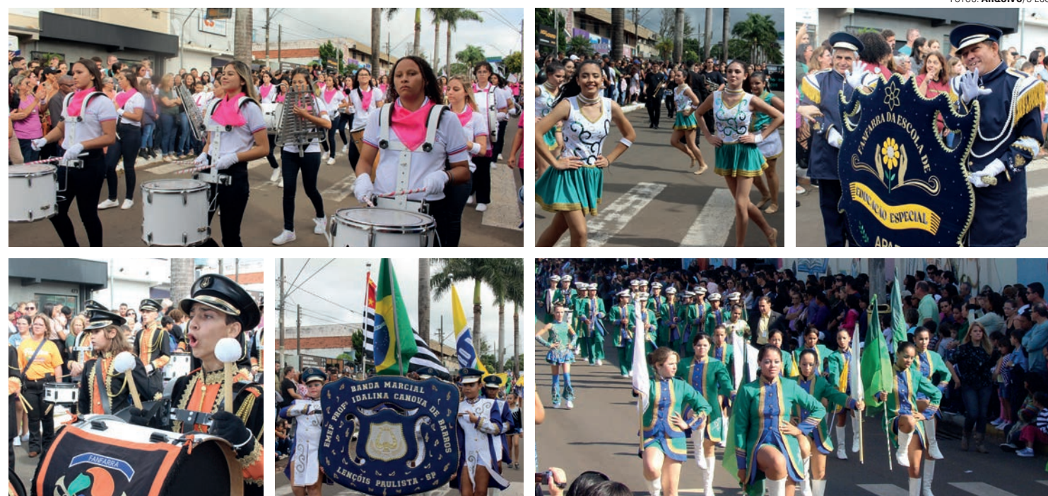
FESTA NA AVENIDA - Milhares de pessoas devem se reunir no próximo dia 28 para acompanhar o desfile cívico que marca o aniversário de Lençóis Paulista

Com o tema 'Entidades de Lençóis Paulista e suas Ações Sociais', o desfile é coordenado por equipes das secretarias de Cultura e Educação. Ao todo, 20 organizações que prestam serviços em vários segmentos devem ser homenageadas em reconhecimento por toda a dedicação. Entre elas, Associação Amorada, Rede do Câncer, Lar Nossa Se-