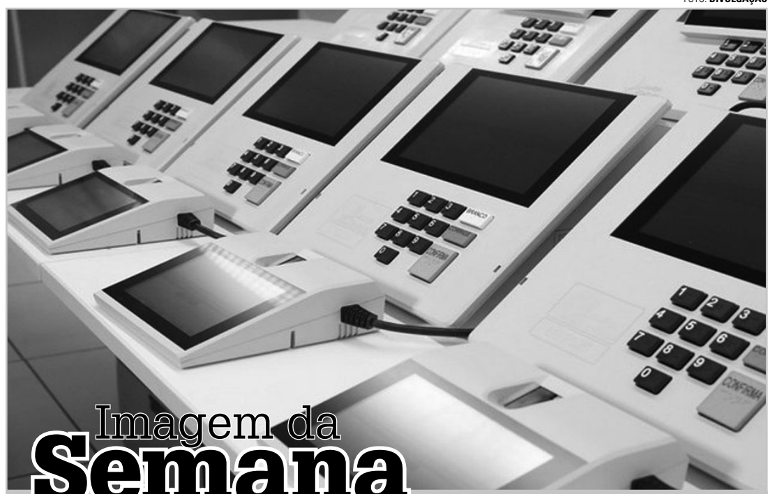
Imagem da Semana

CONTAGEM REGRESSIVA - Chegou o dia. A partir deste sábado (6), estamos a exatamente seis meses do pleito que vai definir quais serão os representantes do povo pelos próximos quatro anos nos poderes Executivo e Legislativo municipais. As eleições acontecem no dia 6 de outubro e, a partir de agora, a corrida eleitoral deve começar a ganhar contornos mais bem definidos. Aguardemos as cenas dos próximos capítulos.