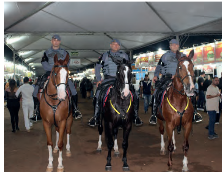
APOIO - Equipes de cavalaria da PM também estão presentes na Facilpa

O capitão orienta as pessoas a reduzirem o uso do celular para prevenir possíveis furtos, principalmente nos dias de maior movimento. Os aparelhos devem ser mantidos no bolso da frente e sem exposição constan-