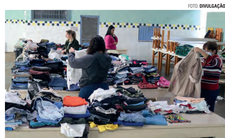
SOLIDARIEDADE - Na foto, distribuição dos agasalhos e outras roupas de frio arrecadados em Lençóis Paulista na campanha realizada em 2023

Em Lençóis Paulista, doação continua até o dia 10 de maio em vários locais do município