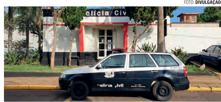
PROTEÇÃO - Mulher solicitou medida protetiva na delegacia da Polícia Civil

Ao ser indagado, o homem admitiu ter se apossado do objeto no quintal da residência, mas negou ter ameaçado e xingado a ex-mulher. A polícia entrou em contato