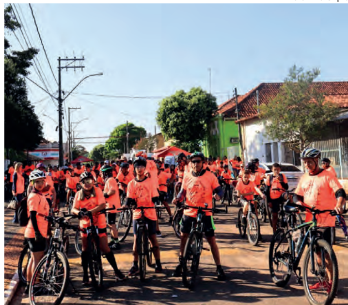
NO PEDAL - Participantes percorrem 15 quilômetros por estradas rurais de Borebi; na foto, edição do Passoio Ciclístico realizada no ano passado

No momento da inscrição, é necessário informar o nome completo e o número da camiseta para a entrega no dia do passeio. Maiores de 15 anos devem doar dois litros de leite longa vida no ato da troca. O destino das doações é o Fundo Social de Solidariedade do município, que, posteriormente,