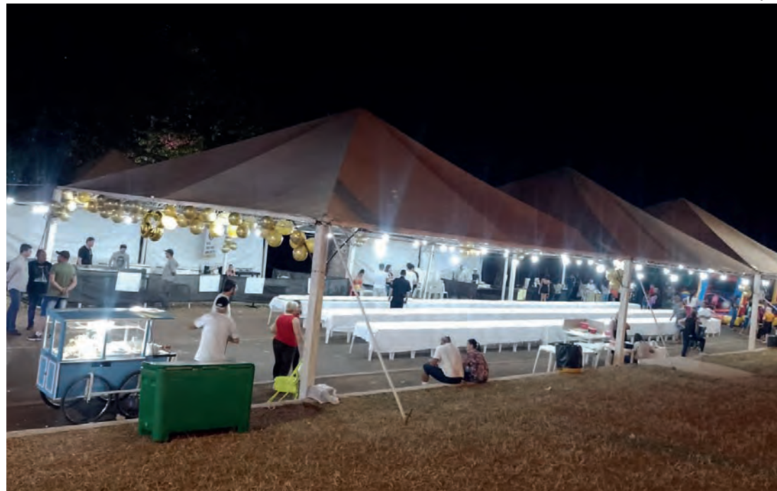
CELEBRAÇÃO - Bolo gigante já se tornou uma tradição em Areiópolis; na foto, comemoração realizada em 2023

“Durante a pandemia, fizemos uma live para comemorar o aniversário da cidade, mas acaba sendo algo muito frio.