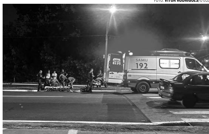
SOCORRO - Com lesão no pé, vítima foi levada à UPA para atendimento

A Polícia Militar estava estacionada no cruzamento das