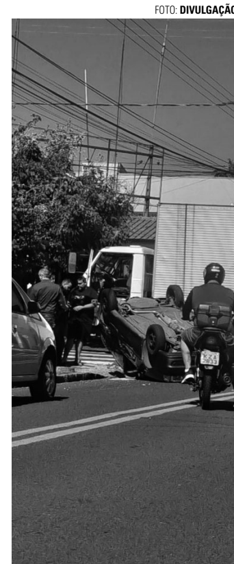
TOMBOU - Depois de se chocar contra lateral de caminhão, carro capotou em local movimentado bem no Centro de Lençóis Paulista

O motorista do caminhão, F.R.T., de 41 anos, disse que trafegava pela Rua José do Patrocínio quando parou o veículo no cruzamento com a Rua Pedro Natálio Lorenzetti para dar passagem a outro veículo. Ele relatou que, quando prosseguiu para fazer o cruzamento, o Gol colidiu com o para-choque de seu caminhão e capotou. Ambos os condutores foram ouvidos no local e liberados após prestarem depoimento. ■