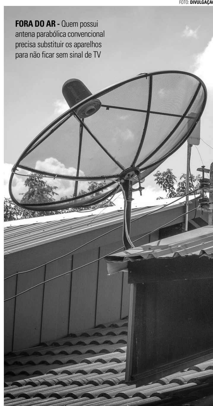
FORA DO AR - Quem possui antena parabólica convencional precisa substituir os aparelhos para não ficar sem sinal de TV

A situação é diferente em Areiópolis, onde o número de instalações já superou o total esperado inicialmente - a estimativa era de que 190 famílias se enquadrassem nas regras. Apesar disso, os atendimentos continuam sendo feitos pela entidade para famílias que tenham parabólicas em funcionamento e sejam beneficiárias de algum programa do Governo Federal, como o Bolsa Família, por exemplo. ■