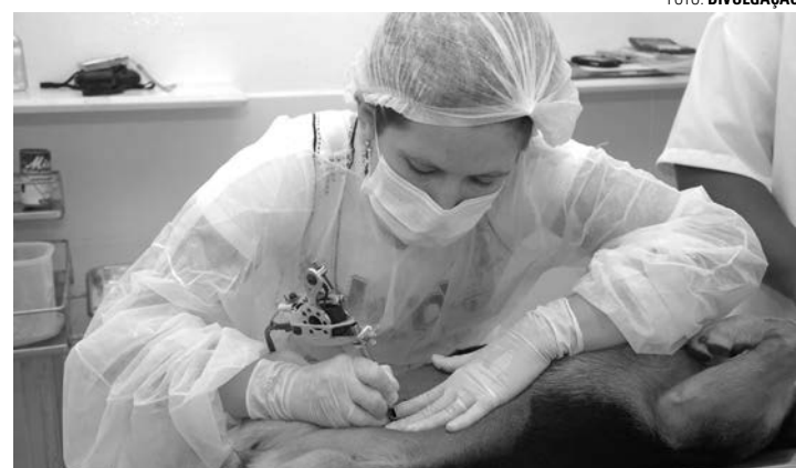
NA FILA - Castrações também devem ser feitas nas consultas regulares

Para participar do mutirão é necessário fazer um cadastro. O atendimento foi iniciado nesta semana e segue na próxima quarta-feira (22), das 14h às 16h, na