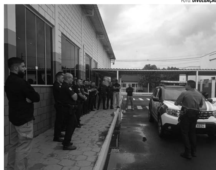
TREINAMENTO - Terceira turma da Guarda Civil de Lençóis Paulista deve passar pela formação de quatro meses a partir do dia 1 de julho

O coronel acredita que, com o reforço no efetivo, a Guarda Civil pode aumentar sua atuação em Lençóis Paulista e, além disso iniciar novos projetos de segurança na cidade. "Todos manifestaram o desejo em assumir as vagas. Com o aumento do efetivo existente, poderemos aumentar o patrulhamento,