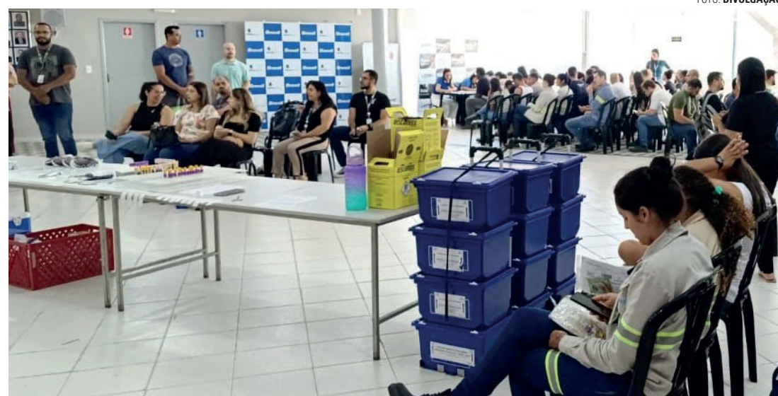
BOA AÇÃO - Atendimento aos voluntários acontece em dois períodos na sede do Rotary Club de Lençóis Paulista

A coleta em Lençóis Paulista está marcada para o dia 14 de junho, data que celebra o Dia Mundial do Doador de Sangue. O atendimento aos voluntários acontece das 8h às 12h e das 13h às 15h, na sede do Rotary Club (Avenida Padre Salústio Rodrigues Machado, 809, Jardim Ubirama). É obrigatória a apresentação de documento de identificação com foto, como RG