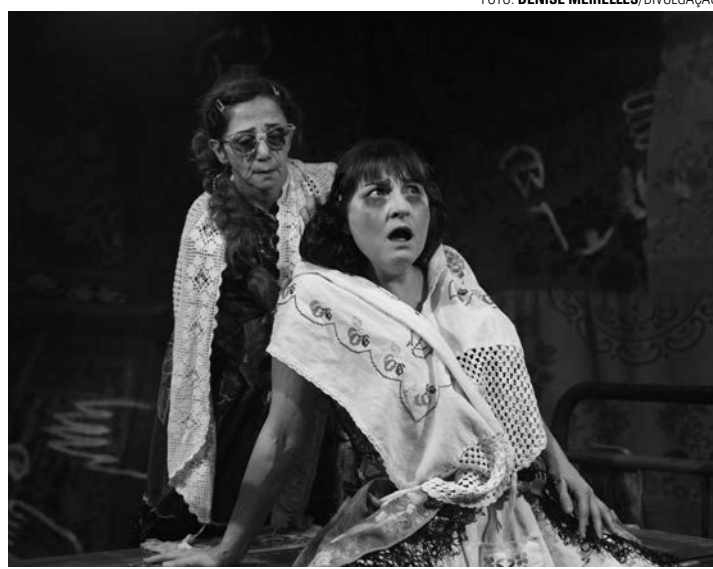
TRAMA - Peça se passa em uma cidade do interior de Minas Gerais, onde duas carpideiras esperam chegada de um corpo atrasado ao próprio velório

flexões e dilemas vividos por milhares de pessoas que choraram os seus mortos e tanto esperaram por dias melhores. O objetivo é discutir os processos da morte, transitando entre as grandes e as pequenas situações que paralisam a vida registrando as sensações de espera, medo, angústia, solidão e as mudanças de hábitos e pensamentos que todos compartilham dentro de si.