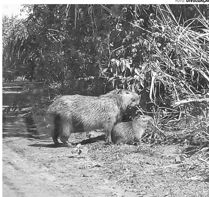
VIDA SELVAGEM - 1º Concurso de Fotografia da Ascana deve evidenciar alguns registros peculiares da vida selvagem na região de Lençóis Paulista

mento do 1º Concurso de Fotografia da Ascana, as imagens enviadas não podem apresentar nenhum tipo de manipulação gráfica, como marcas d'água, máscaras, inserções ou retiradas de elementos, remoções ou inclusões de fundos ou qualquer outra forma de montagem. Também é expressamente proibido manipular ou forçar o animal para a captação da foto.