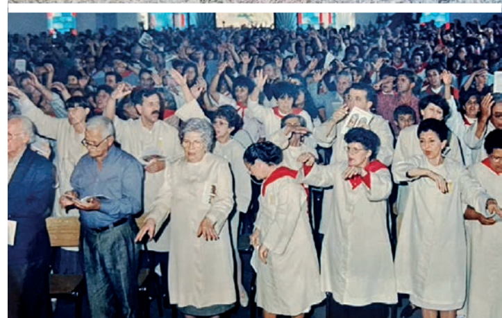
PORTAS ABERTAS - Após mais de três anos de obras viabilizadas com a ajuda da comunidade, igreja foi inaugurada no dia 9 de maio de 1999

Prepare-se para ser o profissional que a indústria precisa com os cursos do SENAI-SP na área de: