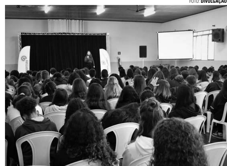
GRANDE OPORTUNIDADE - Em sua 12ª edição em Lençóis Paulista, Feira de Profissões recebe estudantes e profissionais em busca de qualificação

O Instituto Liderajovem tem como mantenedores Lwart Soluções Ambientais e Bracell. Para a realização da Profituro, a entidade também conta com o apoio da Prefeitura Municipal de Lençóis Paulista, do