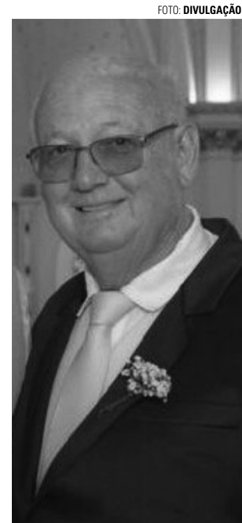
DESPEDIDA - Empresário está sendo velado na Sala de Sessões Mário Trecenti, sede legislativa da Câmara Municipal de Lençóis

Foi membro do Rotary Club de Lençóis Paulista por cinquenta anos, integrou o Conselho Deliberativo da APAE (Associação de Pais e Amigos dos Excepcionais), o Clube Esportivo Marimbondo, a Associação Rural de Lençóis Paulista, responsável pela realização da Facilpa (Feira Agropecuária, Comercial e Industrial