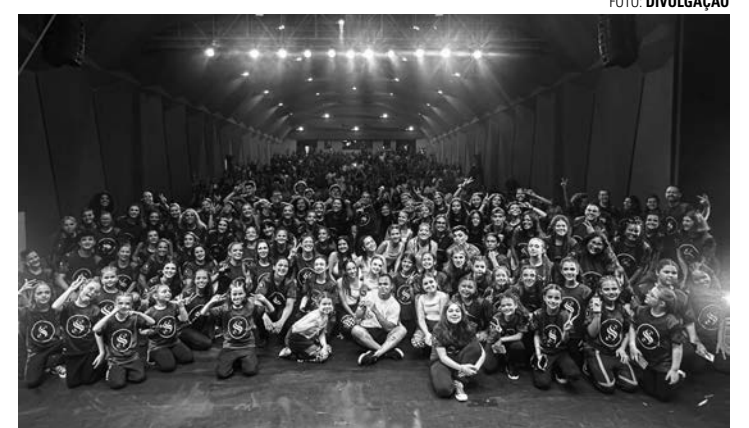
DENTRO DO CELULAR - Espetáculo de dança lançado em dezembro do ano passado volta ao palco em campanha em prol de vítimas das enchentes

grafo Marcelo Estrella, a apresentação conta com participações especiais da academia Saltare - Arte e Movimento, do Grupo Street Union e do Studio Dancefit. A entrada é condicionada à doação de um quilo de alimento não perecível em prol das vítimas das enchentes no Rio Grande do Sul. Os dançarinos também participam do movimento solidário com a doação de água.