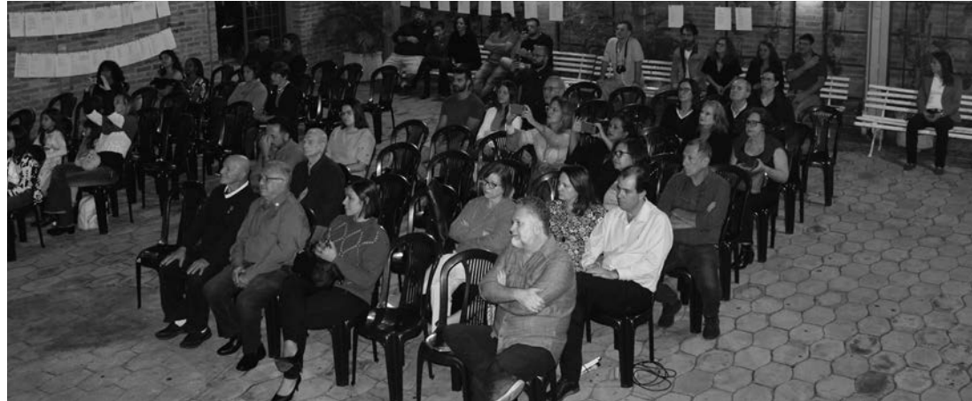
SUCESSO - Primeira edição foi realizada em maio de 2023 com a participação de dezenas de escritores e leitores