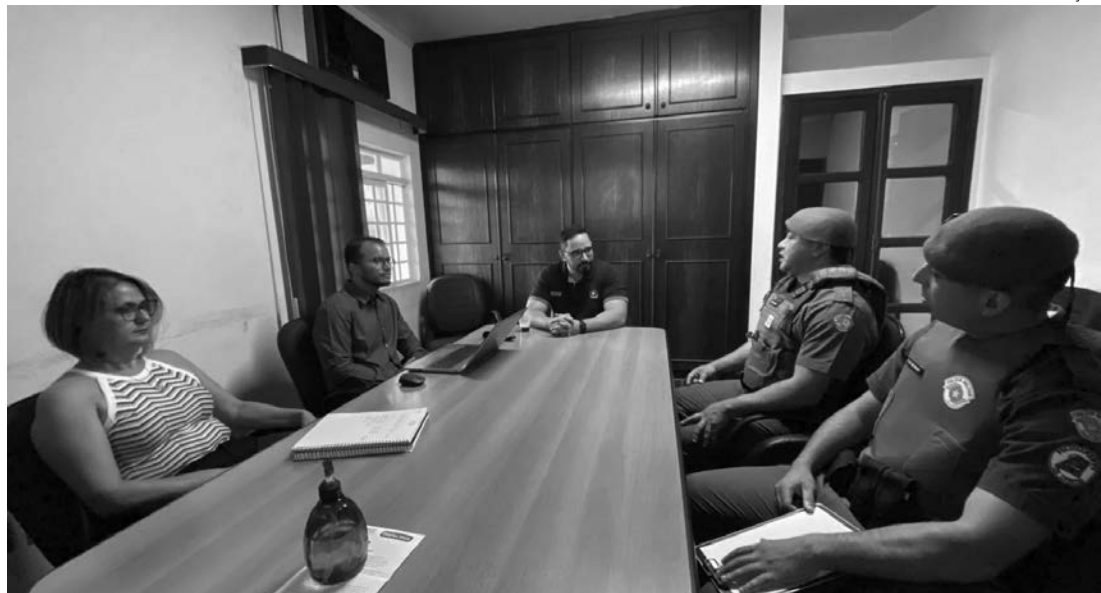
TRATATIVAS - Ampliação do programa, que foi implementado em 2019, vem sendo discutida desde o ano passado