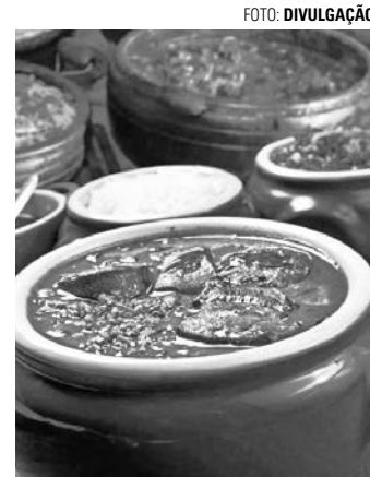
ALMOÇO - Retirada da Feijoada acontece na sede do Lions Clube

De acordo com a organização do evento, o kit é composto por um litro de feijoada com acompanhamentos de arroz, farofa, vinagrete, couve refogada e la-