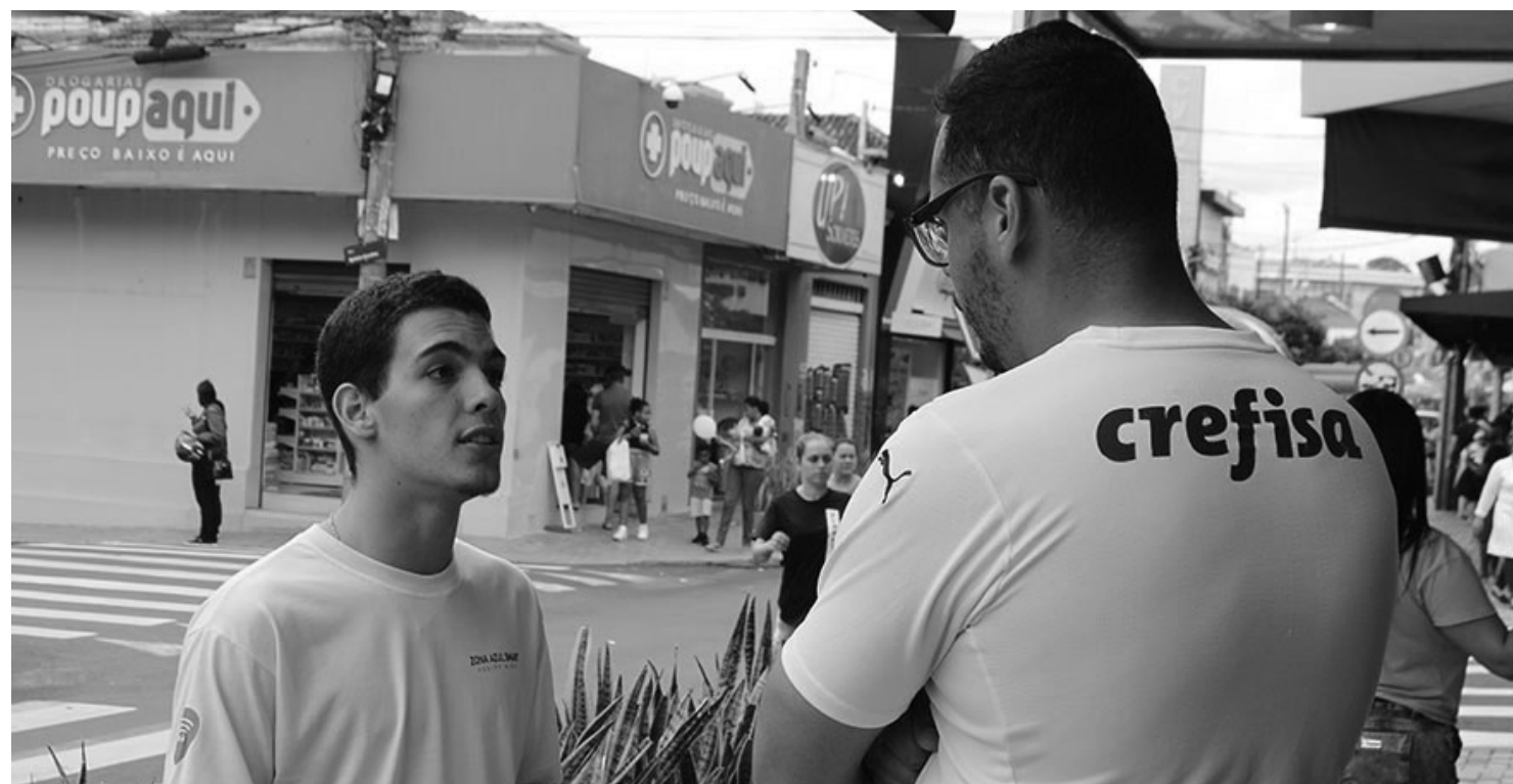
NOVO FORMATO - Mantida em parceria com a Legião Mirim desde sua implantação, Zona Azul deve ser licitada nos próximos meses pela prefeitura

Acordo de Cooperação com a Prefeitura Municipal de Lençóis Paulista foi encerrado após Tribunal de Contas questionar atual modelo de contratação; serviço deve ser licitado nos próximos meses