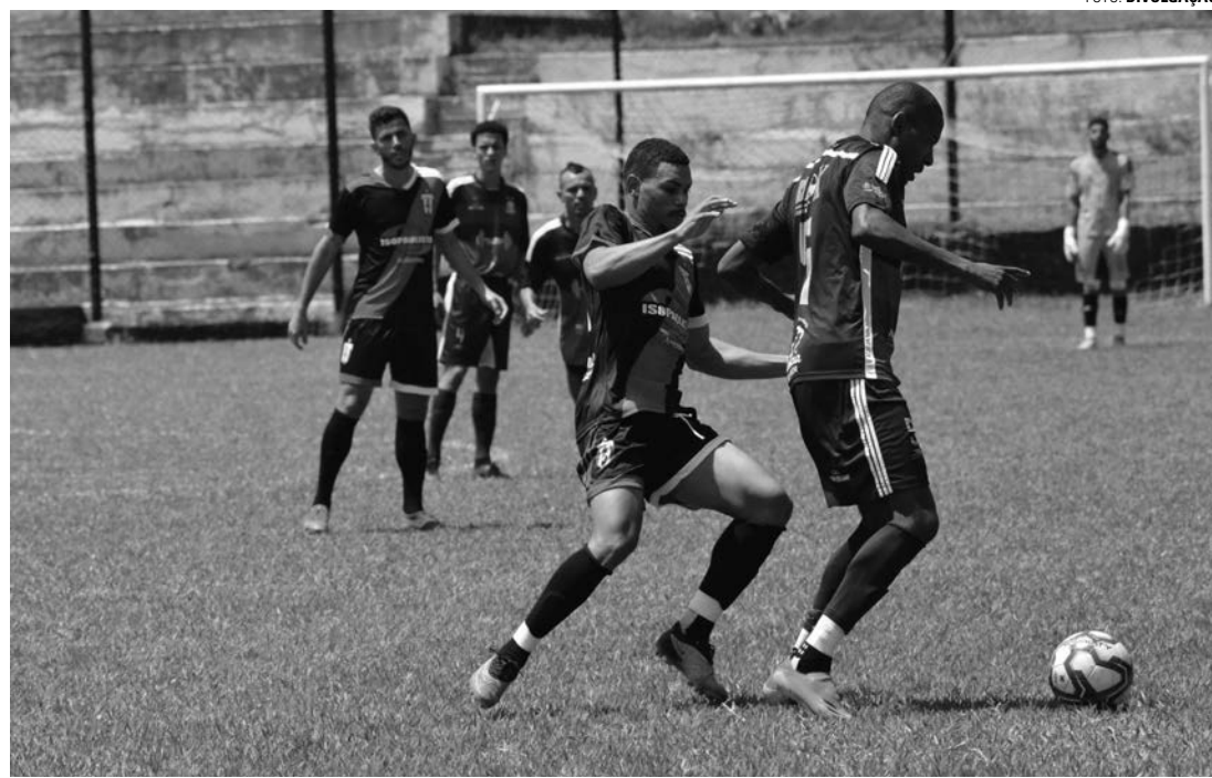
TODOS PELO RIO GRANDE DO SUL - Confrontos do torneio Futebol e Solidariedade acontecem durante todo o domingo no Bregão; mais de 20 times de Lençóis Paulista, Borebi, Bauru e Macatuba estão confirmados no evento

Na data, estavam confirmados Alfredo Guedes, Atlético Caju, Atlético Guarani, Atlético Primavera, Complexo Caju, Esportivo União, Grêmio Cecap, Grêmio da Vila, Juventude, Master Alfredo Guedes, Nacional, Nova Lençóis, Paulista, Ponte Preta, Raça Carolina, Reduto Atletico, São Cristó-