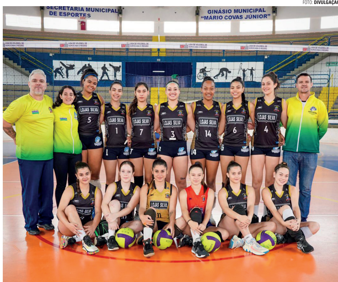
EM BUSCA DO OURO - Equipe feminina de vôlei encara forte time do SESI Bauru na disputa dos Jogos Regionais

ques até na quinta-feira eram as equipes femininas de basquete, ciclismo e ginástica rítmica, e a masculina de tênis de mesa, que garantiram o segundo lugar. Os times masculinos de ciclismo, capoeira e natação, além do feminino de tênis, ficaram em terceiro. No sub-21,