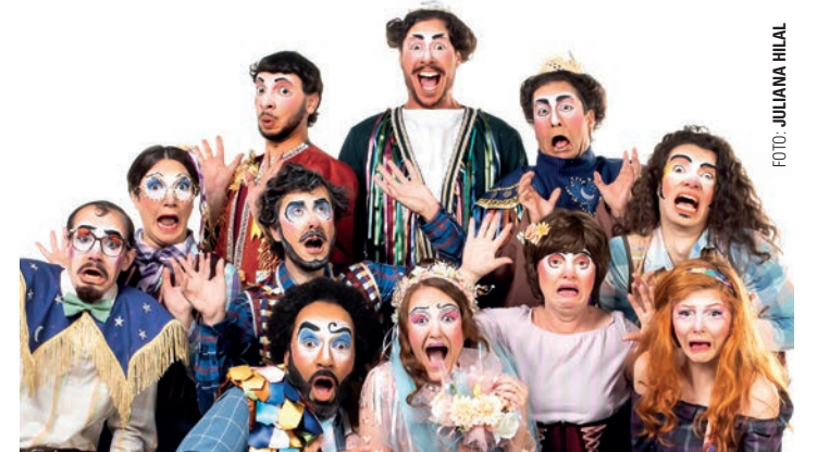
ADAPTAÇÃO - Peça se passa na época das festas juninas em uma cidade fictícia do interior, onde a filha de um fazendeiro planeja seu casamento, enquanto sua irmã mais nova quer fugir com o namorado

Com cerca de 100 minutos de duração, a peça tem classificação indicativa livre, mas é recomendada para crianças a partir dos 12 anos de idade. A entrada é gratuita, mas os lugares são limitados. A distri-