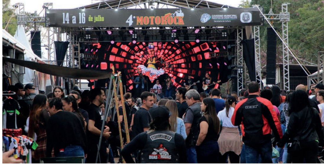
GRANDE FESTA - Organização espera repetir o sucesso de 2023 e reunir mais de 20 mil pessoas durante o evento

Para o domingo, o recinto de exposições também abre espaço para outros possantes de respeito. A partir das 15h, acontece um encontro de carros antigos com colecionadores da cidade e região exibindo as suas máquinas dos mais variados modelos, marcas