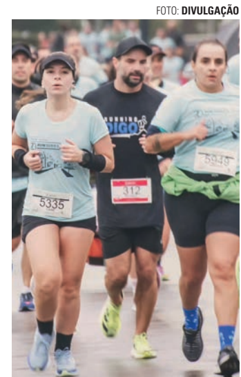
PROVA - Com percursos de quatro e oito quilômetros, corrida contempla um trajeto que passa por diversos bairros da cidade

Para os participantes inscritos, a retirada dos kits contendo uma camiseta (a numeração deve ser selecionada no ato da inscri-