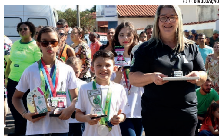
DESTAQUE - Alunos das escolas Waldomiro Fantini, Trajano Maciel Filho e Odila Galli Lista também participam de competições de xadrez na região

A professora relata que ainda não tem sido possível participar de muitas competições devido à dificuldade de transporte e os custos com alimentação e outras despesas para os alunos. Apesar disso, as crianças têm participado de vários jogos na região. Orgulhosa, ela afirma que ensina as regras e os movimentos básicos, mas os