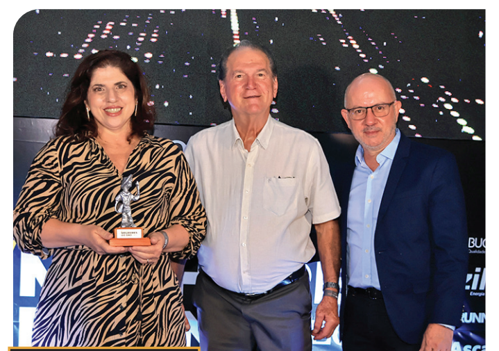
prêmio MELHORES DO ANO O ECO 2024 MACATUBA RZ calçados