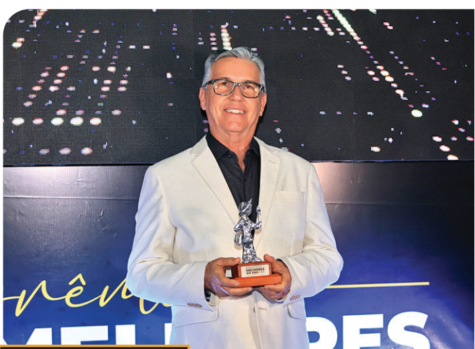
prêmio MELHORES DO ANO O ECO 2024 MACATUBA Ascana A FORÇA DA NOSSA REGIÃO