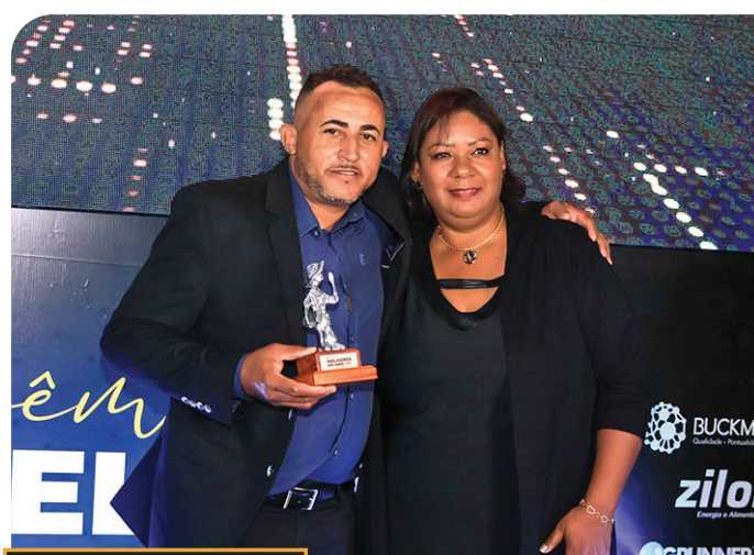
prêmio MELHORES DO ANO O ECO 2024 MACATUBA Bahia