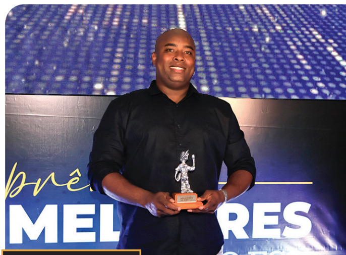
prêmio MELHORES DO ANO O ECO 2024 MACATUBA SE7EN SOCCER TRAINING