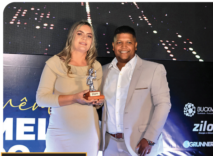
prêmio MELHORES DO ANO O ECO 2024 MACATUBA ETIA LI ESPAÇO RECREAÇÃO