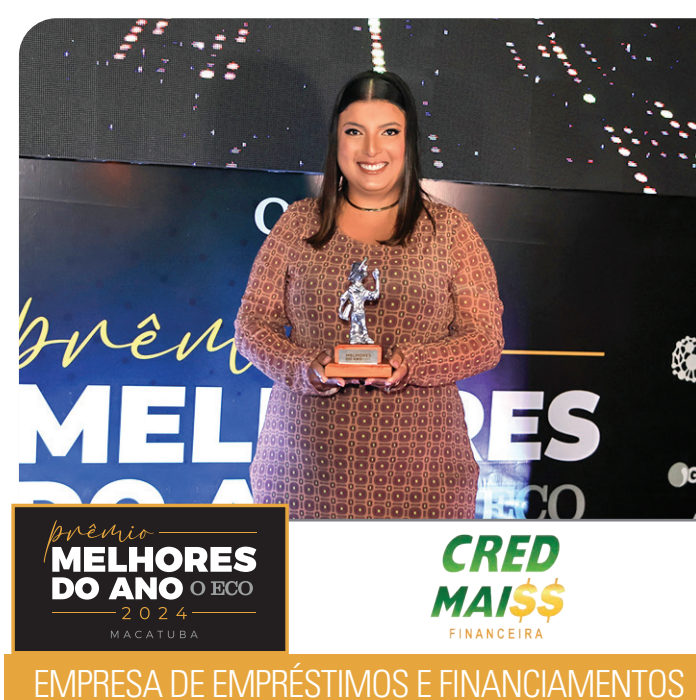
EMPRESA DE EMPRÉSTIMOS E FINANCIAMENTOS