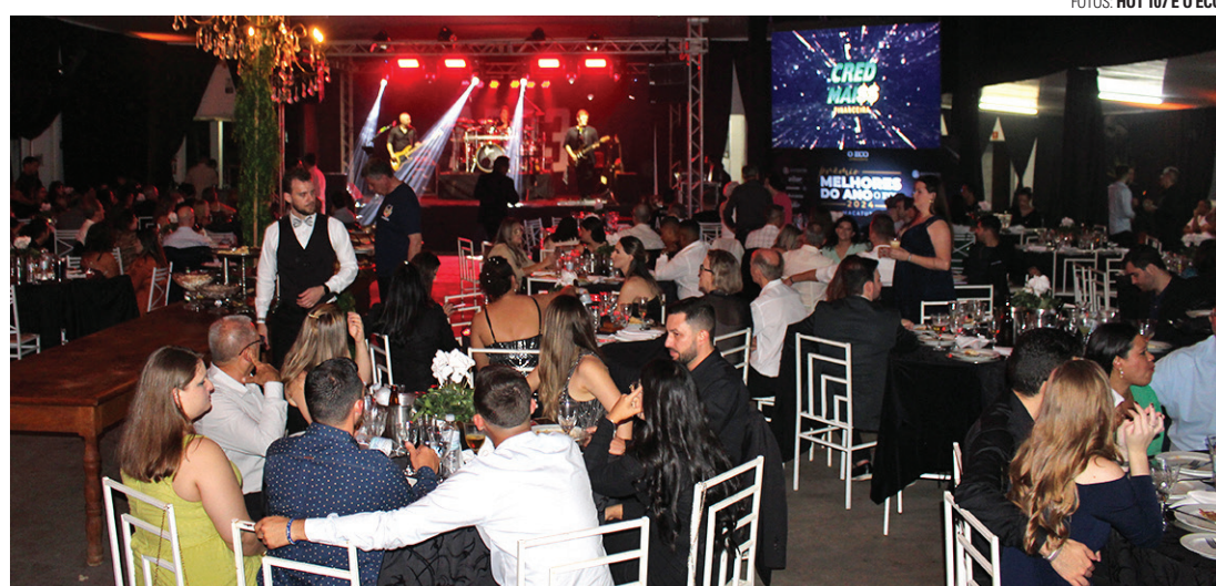
PARA TODOS OS GOSTOS - ABR3 apresentou repertório bem eclético para animar o público de todos os estilos

O Melhores do Ano Macatuba 2024 premiou 37 empresas, profissionais liberais e personalidades que receberam o merecido reconhecimento da população macatubense pelo importante tra-