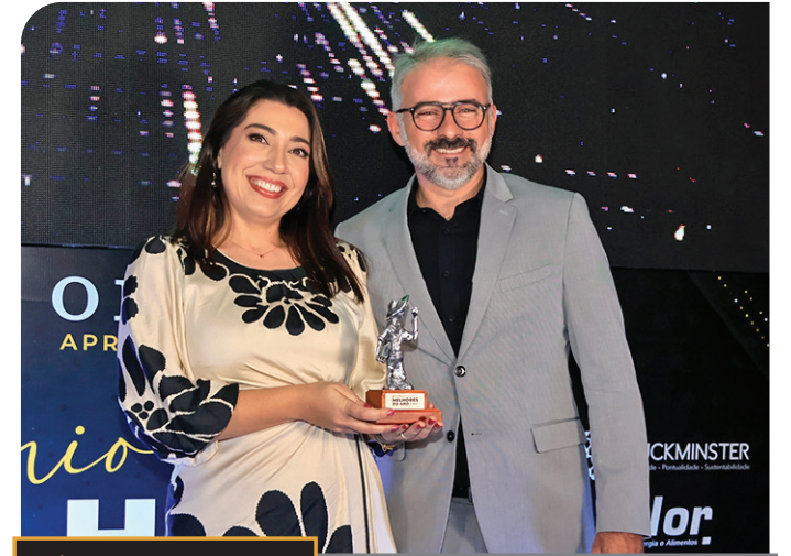
prêmio MELHORES DO ANO O ECO 2024 MACATUBA zilor. Energia e Alimentos