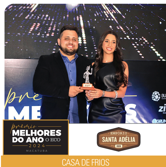
CASA DE FRIOS