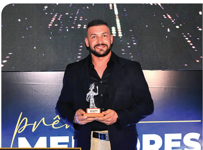
prêmio MELHORES DO ANO O ECO 2024 MACATUBA PC SEGURANÇA