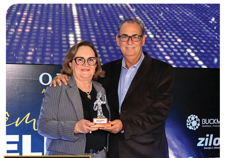
prêmio MELHORES DO ANO O ECO 2024 MACATUBA IRMÃOS PANICO FUNERÁRIA