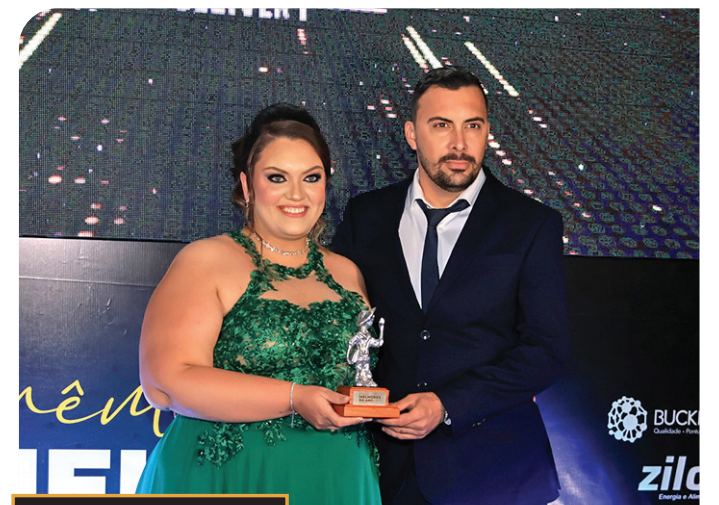
prêmio MELHORES DO ANO O ECO 2024 MACATUBA The BURGER DELIVERY