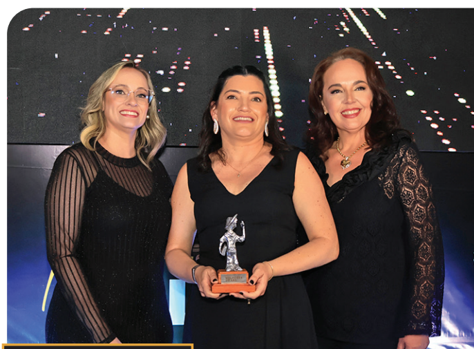
prêmio MELHORES DO ANO O ECO 2024 MACATUBA ESCOLA WALDOMIRO FANTINI ESCOLA PÚBLICA