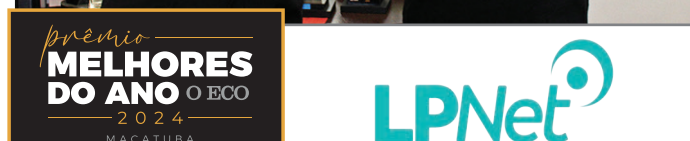
PROVEDOR DE INTERNET