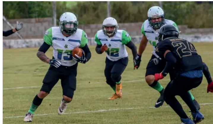
EM CAMPO - Guarás tenta vitória para seguir em busca da classificação

O confronto entre Guarás e Defenders acontece a partir das 14h, no Campo da Usina Santa Adélia. No mesmo local, às 10h, se enfrentam Leme Lizards e Avaré Lions. Na primeira rodada, no dia 18 de agosto, na cidade de Leme, o Guarás não conseguiu impor se ritmo dian-