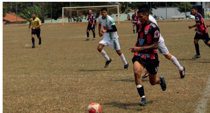
NO BREGÃO - Reduto Atleticoano (camisa listrada) enfrenta o Atlético Guarani pela nona rodada, no Estádio Municipal Archangelo Brega, às 13h

Todos entram em campo neste domingo (15) e, com exceção de Atlético Guarani e Esportivo União, que estão fora do alcance da zona de classificação, os demais seguem na briga por uma vaga na semifinal da competição, que é promovida pela Secretaria de Esportes e Recreação com organização da empresa EMC