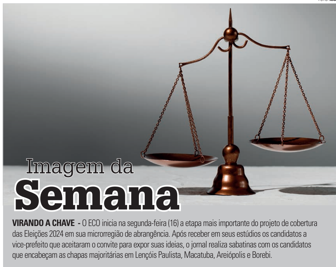
Imagem da Semana

Esse evento contribuirá para os preparativos da COP-30, que será realizada no próximo ano em Belém do Pará, marcando o início da segunda fase de implementação do Acordo de Paris. O encontro será importante porque se espera que os países apresentem novas e mais ambiciosas Contribuições Nacionalmente Determinadas (NDCs, na sigla em inglês). O êxito da COP-30 estará ligado aos resultados obtidos nas edições anteriores, especialmente em Dubai (COP-28) e Baku (COP-29), onde questões-chave sobre financiamento climático serão definidas, possibilitando o fortalecimento das NDCs dos países em desenvolvimento. Neste contexto, a inclusão dos oceanos como um componente central nas estratégias de mitigação e adaptação às mudanças climáticas será fundamental para o sucesso dessas negociações e para a proteção efetiva deste recurso vital para o planeta.