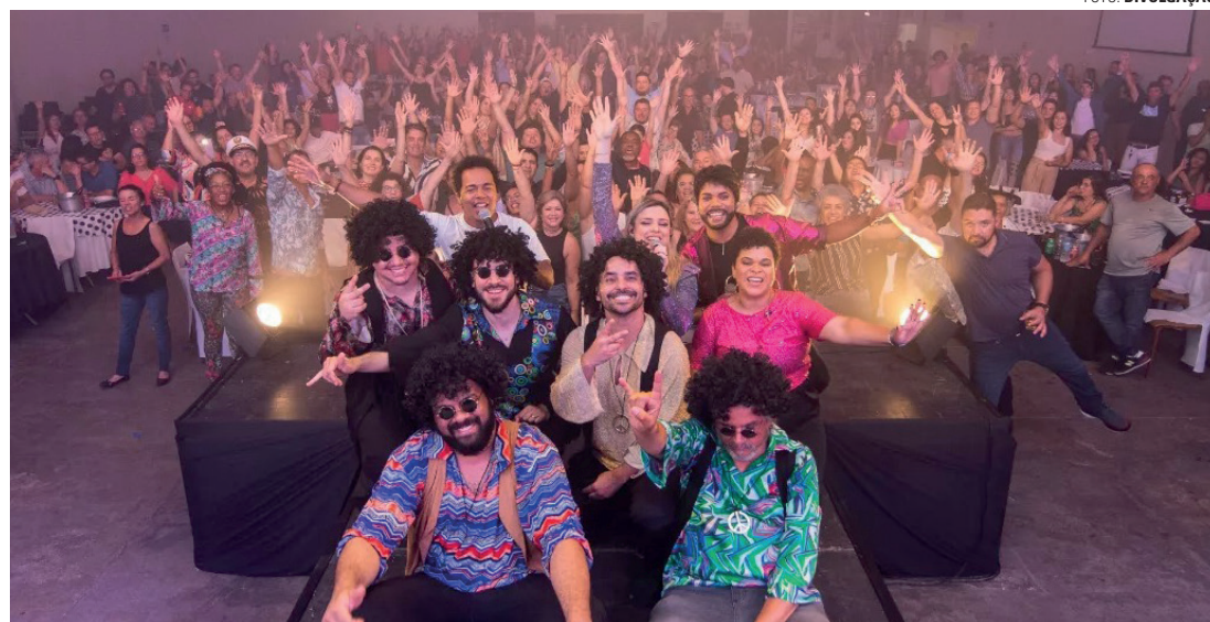
FLASHBACK - Baile faz uma volta ao passado e retoma os grandes sucessos musicais das últimas décadas

60, 70, 80 e 90, o Baile do Flashback do Lions Clube é ideal para quem quer aproveitar a pista de dança e se