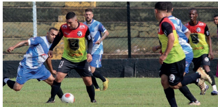
TUDO OU NADA - União Primavera (calção claro) disputa com Nova Lençóis e Raça Carolina as duas últimas vagas para o mata-mata

Quatro partidas marcadas para a manhã deste domingo (15) encerram a primeira fase da Série A do Campeonato Amador de Futebol de Lençóis Paulista. Com o título dos pontos corridos garantido ao Atlético Primavera, as atenções se voltam principalmente à parte de baixo da tabela da competição promovida pela Secretaria de Esportes e Recreação com organização da EMC Eventos Esportivos.