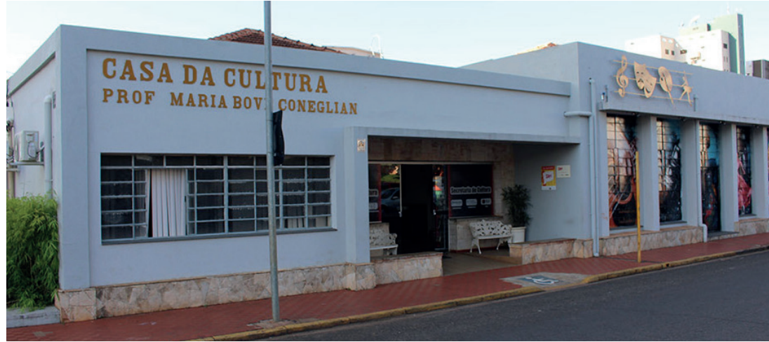
PROJETOS - Detalhes do edital de chamamento público podem ser conferidos a partir da segunda-feira (16)

O edital foi elaborado com base em dados do censo cultural e em reuniões realizadas nos fóruns de cultura com a participação dos artistas e fazedores de cultura da cidade. De acordo a pasta, a distribuição dos recursos foi planejada a partir dos apontamentos buscando garantir que as necessidades e demandas da classe artística local fossem plenamente atendidas. O número de projetos a ser aprovado em cada