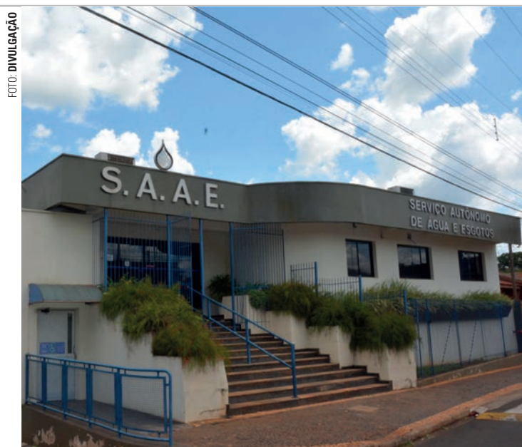
SAAE - Plano Municipal estabelece bases para os serviços de saneamento

"O Plano Municipal de Saneamento Básico é de extrema importância, pois estabelece as bases e busca melhorias de eficiência e de sustentabilidade