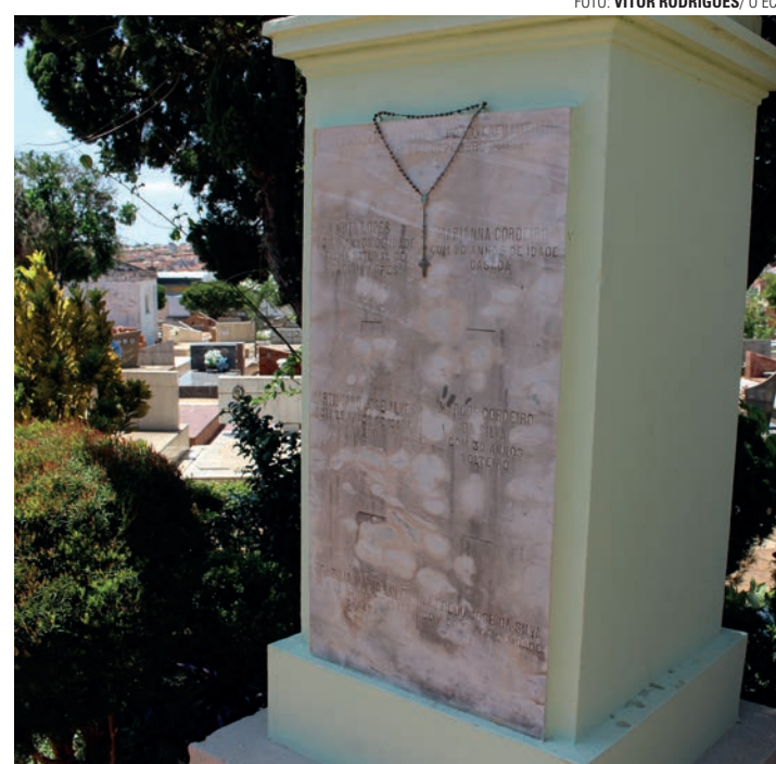
TRAGÉDIA - Em 1922 uma família morreu envenenada ao comer uma macarronada cuja farinha utilizada havia sido contaminada por arsênio