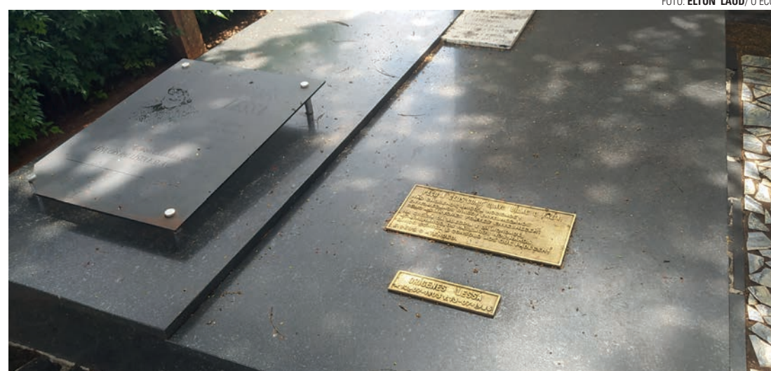
LENÇOENSE IMORTAL - Túmulo do escritor Orígenes Lessa, membro da ABL (Academia Brasileira de Letras) e o maior expoente da cultura lençoense, que morreu em 1986 e teve atendido o desejo de ser sepultado em sua terra

Lembrando que, no século XIX, os caixões funerários só eram acessíveis a uma elite. Os demais alugavam o caixão, que ia e voltava. Ou simplesmente os mortos eram transportados em banguês, espécies de redes