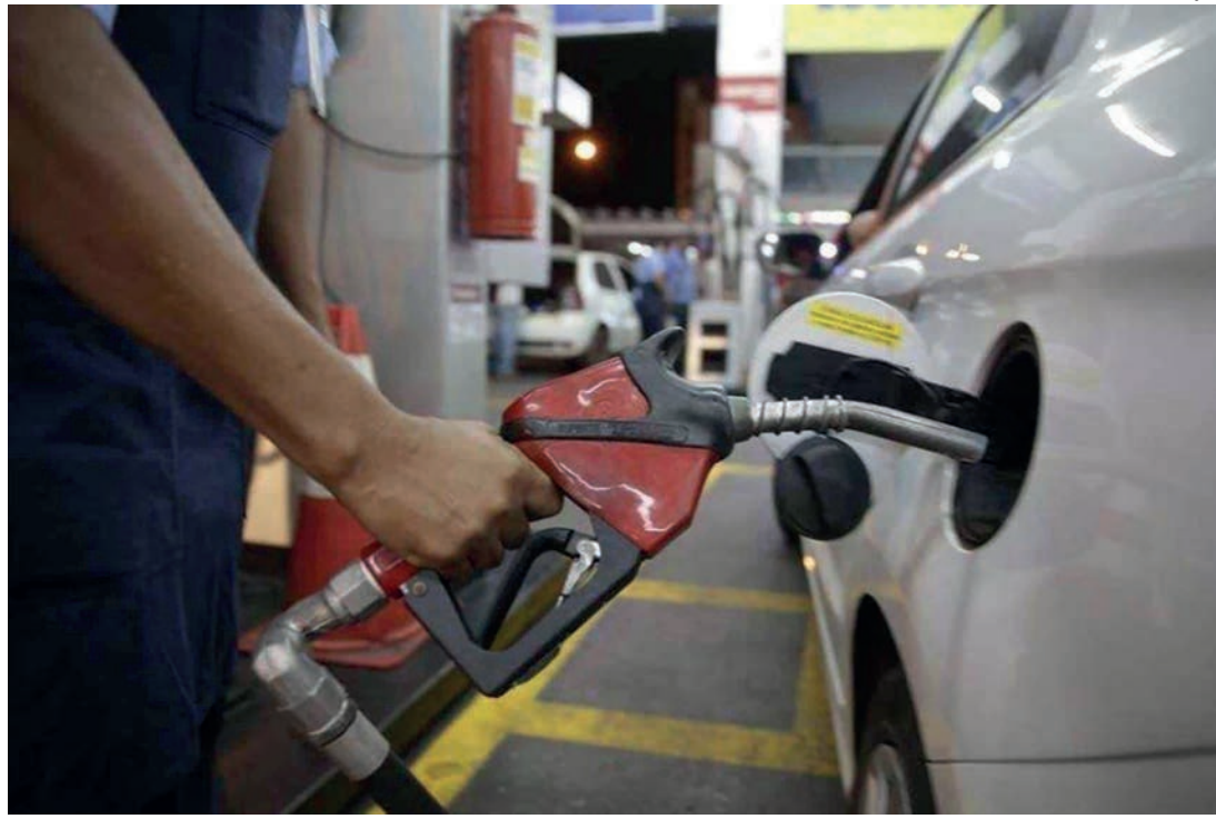
NO BOLSO - Gasolina, etanol e diesel estão mais caros desde o último sábado (1) em todo o território brasileiro

todo o ano de 2024 sem reajuste por decisão do Governo Federal, o impacto foi ainda mais expressivo em decorrência de outro aumento anunciado na sexta-feira (31) pela Petrobras, que elevou em 6,29% (R$ 0,22) o valor do litro comercializado às distribuidoras, atribuindo a medida à pressão sofrida a partir da defasagem do preço do combustível em relação ao mercado internacional.