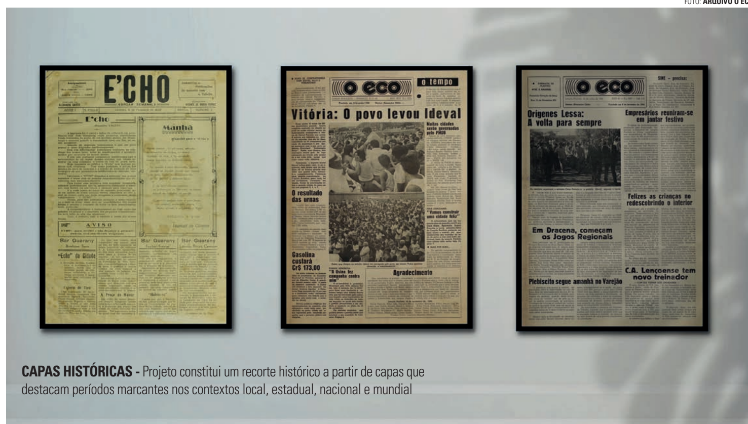
CAPAS HISTÓRICAS - Projeto constitui um recorte histórico a partir de capas que destacam períodos marcantes nos contextos local, estadual, nacional e mundial