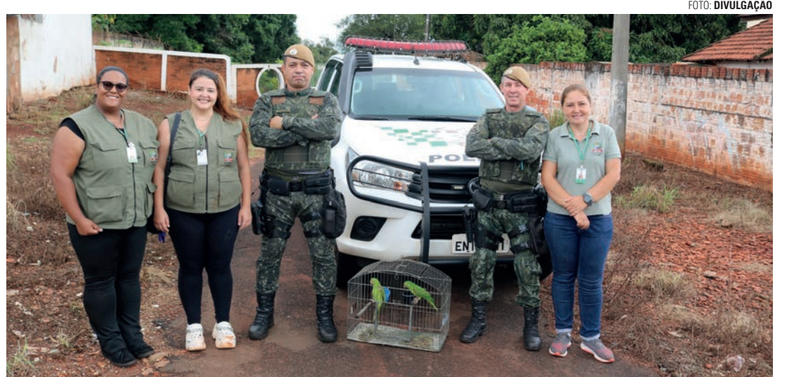
LIBERDADE - Aves silvestres foram retiradas do imóvel para serem reintroduzidas ao seu habitat natural

Ação aconteceu após denúncia e teve apoio da GCM e Polícia Ambiental