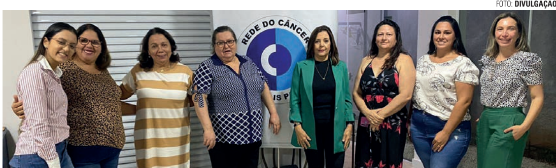
TREINAMENTO - Capacitação de voluntários acontece anualmente buscando ampliar o quadro de colaboradores

Ação na quarta (12) visa ampliar quadro de colaboradores da entidade