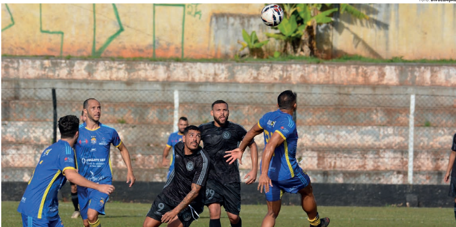
MATA-MATA - Três das quatro partidas marcadas para este domingo (2) são válidas pela ida das oitavas; quem vencer por três gols ou mais avança direto

Amanhã deste domingo (2) movimentará a Copa União de Futebol Amador de Lençóis Paulista. Promovida pela Secretaria de Esportes e Recreação, com organização da LLFA (Liga Lençoense de Futebol Amador), a competição tem quatro confrontos agendados para a rodada. Os jogos acontecem no Estádio Municipal Archangelo Brega (Bregão) e no Estádio Distrital Eugênio Paccola (Cecap). Três das quatro partidas são válidas pela ida das oitavas de final. No Bregão, às 8h, o Reduto Athleticano, único que precisou disputar um jogo preliminar para assegurar sua vaga na fase