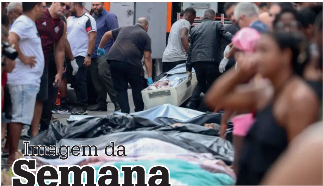
Imagem da Semana

CENÁRIO DE GUERRA - A semana foi marcada pelo retrato da barbárie no Rio de Janeiro. O balanço da megaoperação contra o Comando Vermelho, realizada pelas forças de segurança do estado, foi de 121 mortos, incluindo quatro policiais. A imagem de dezenas de corpos enfileirados em via pública pelos moradores das comunidades girou o mundo, expondo uma realidade calamitosa no país. A repercussão mobilizou autoridades de todas as esferas. É um fato tão relevante quanto ocorreu nessa sexta-feira (31).