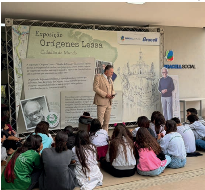
HOMENAGEM - Mostra reúne objetos pessoais, imagens históricas e um percurso interativo, inspirado em livro do célebre escritor lençoense