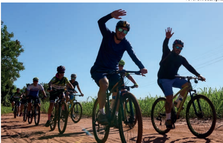
PEDALADA - Evento reúne ciclistas de toda a região em um momento de lazer, saúde e também de conscientização sobre a segurança no trânsito

inscrições podem ser feitas na sede da Ascana e nas bicicletarias Cross Bike e Gabriel Bike. Em Macatuba, os interessados devem se dirigir ao Ambulatório da Ascana. Já em Pederneiras, o atendimento acontece na bicicletaria Marquinhos Bike Sports. Os primeiros 400 inscritos ganham uma camiseta exclusiva.