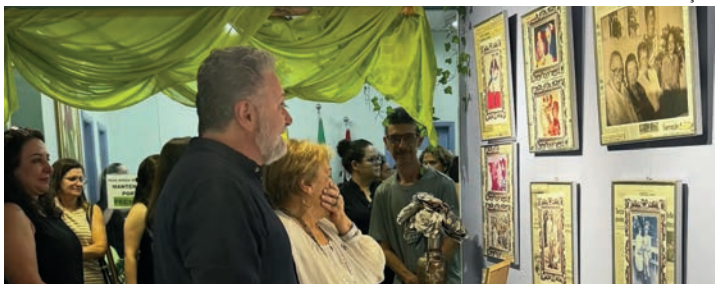
GUARDIÃO DA HISTÓRIA Exposição reúne fotografias, recortes de jornal, textos e objetos ligados ao jornalista que fundou O ECO em 1938

Parte de seu rico legado está representado na mostra, que reú-