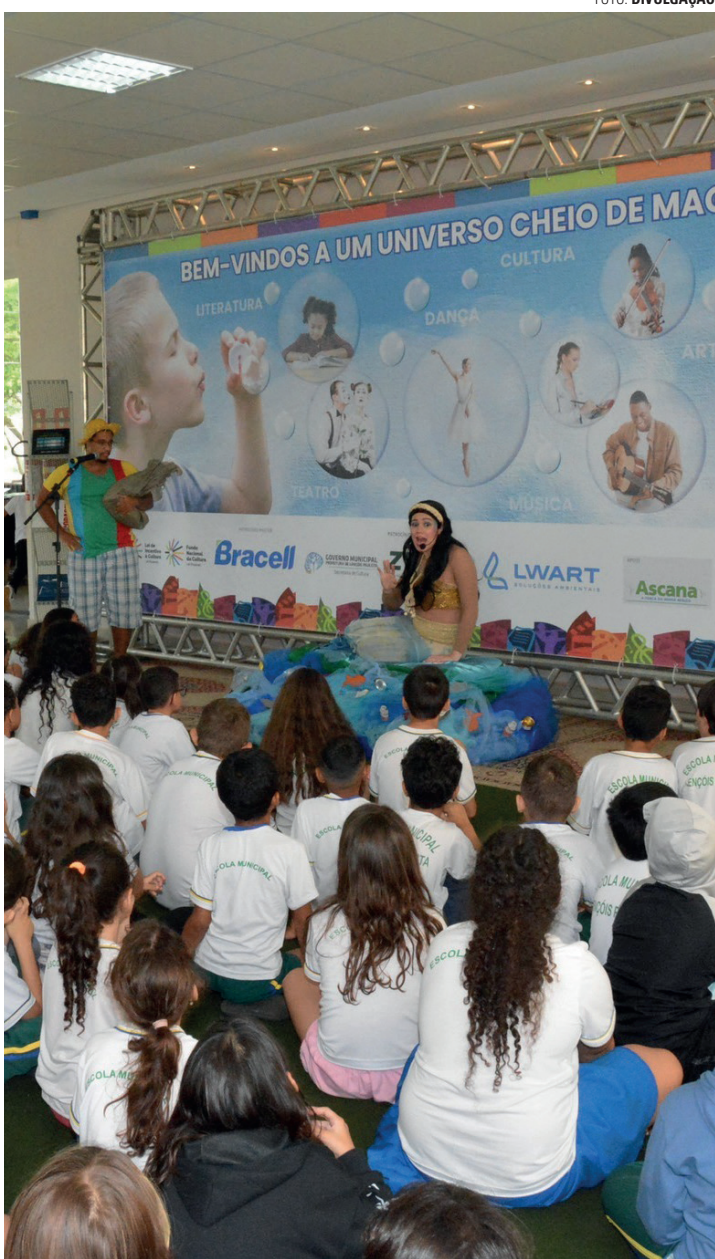
PARA TODOS - Festival promove diversas atrações para crianças, jovens e adultos até o próximo domingo (23); veja ao lado toda a programação

A abertura do FILLP acontece a partir das 20h deste