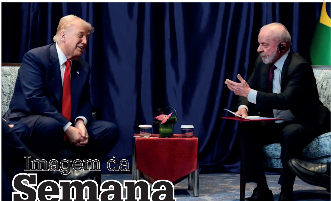
Imagem da Semana

RECUO - O assunto que mais repercutiu nessa sexta-feira (14), que não poderia ficar fora da coluna desta semana, foi o recuo dos EUA em relação às taxas impostas sobre produtos brasileiros, como café, carne, banana, açaí e outros. Ao menos por enquanto, foi uma redução parcial, referente às chamadas taxas de reciprocidade, que o presidente Donald Trump impôs a diversos países no mês de abril, mas já é um começo.