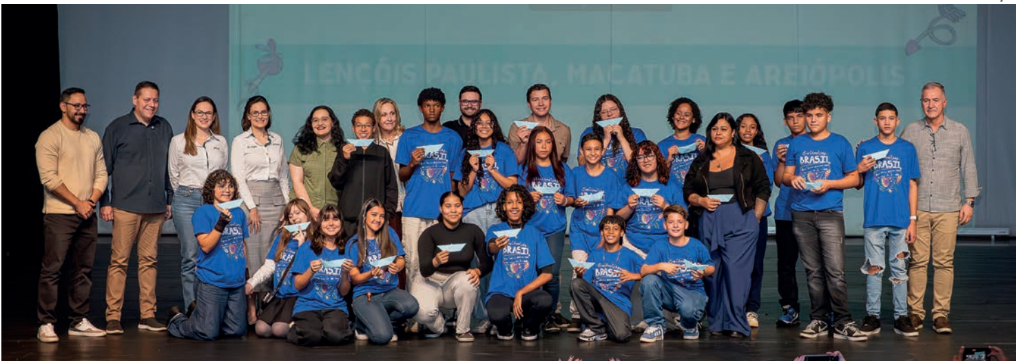
PARTIU EUROPA - Participantes de Lençóis Paulista, Macatuba e Areiópolis vão viver uma jornada de aprendizado, arte e cidadania

Estudantes selecionados na microrregião viajam para intercâmbio de 10 dias em Portugal