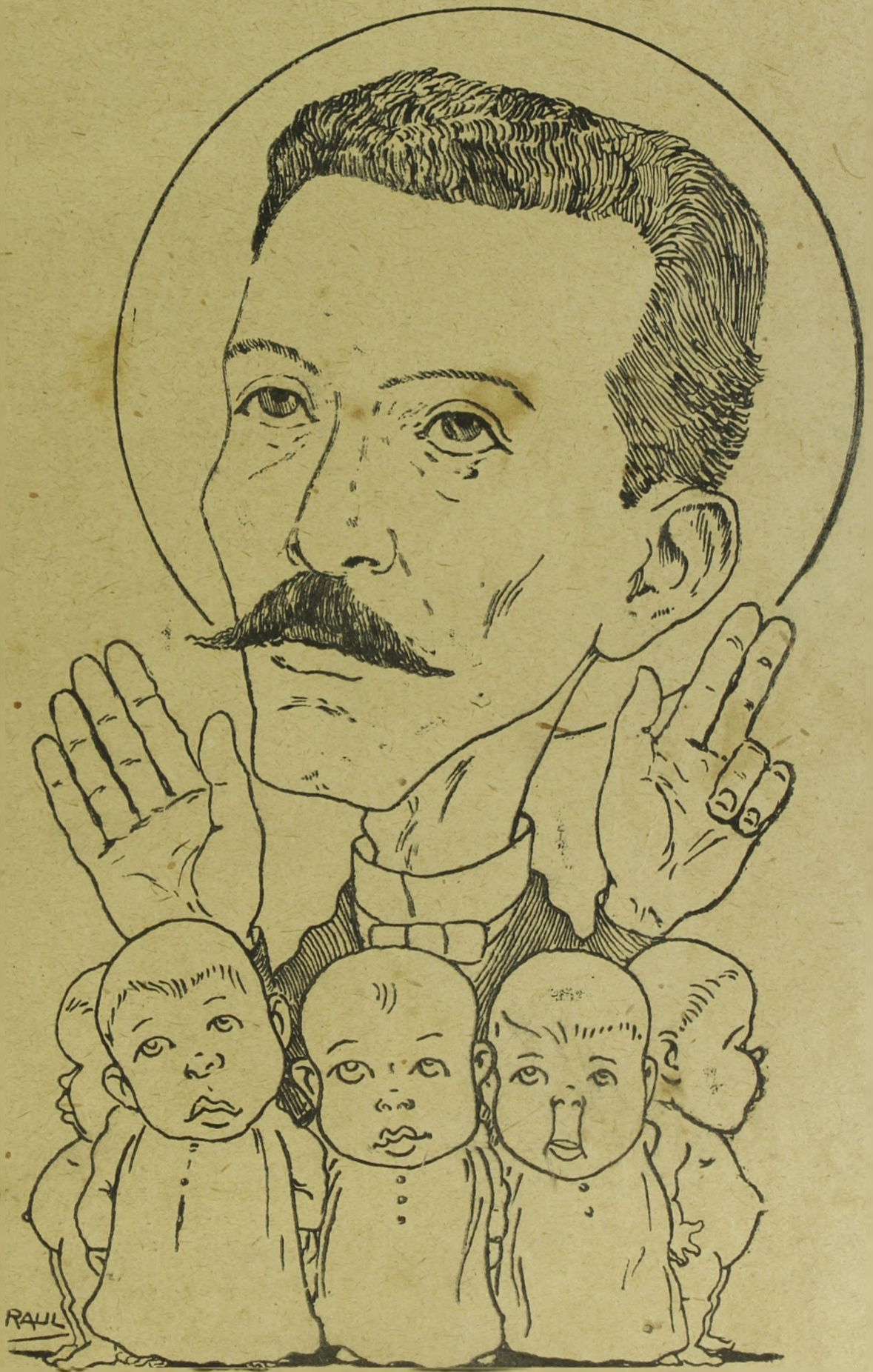
Desenho de Raul.