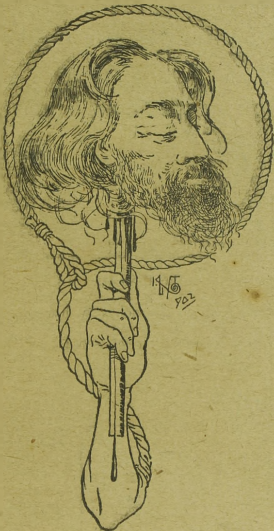
A nossa homenagem ..

O Acre... ora já viram que espiga?! Qual o brasileiro que não fallará neste assumpto com acre... monia?