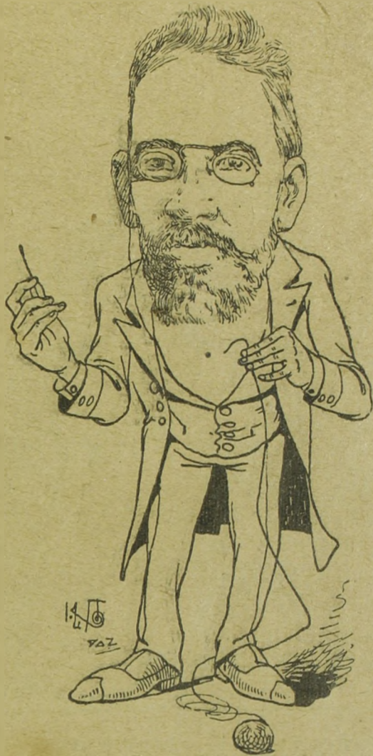
Machado de Assis