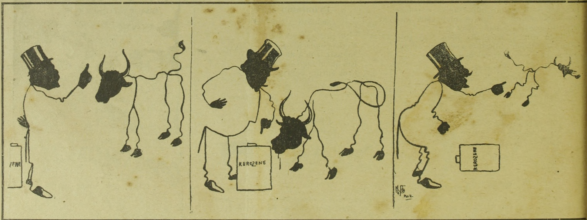
(Desenho de Calixto).