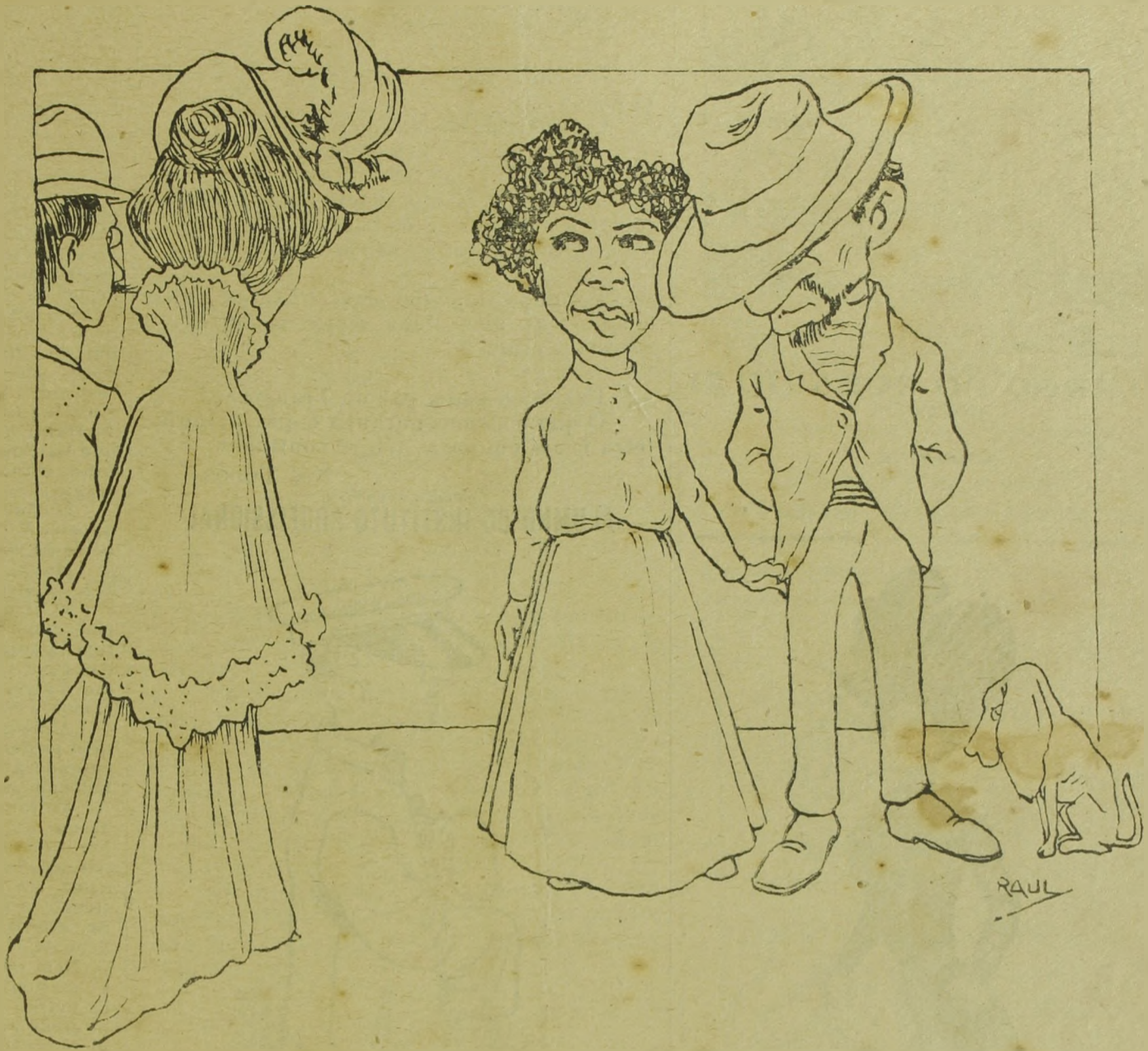
--O' Chico, repara que diabo de máu gosto o d'aquelle chapéu da madama...