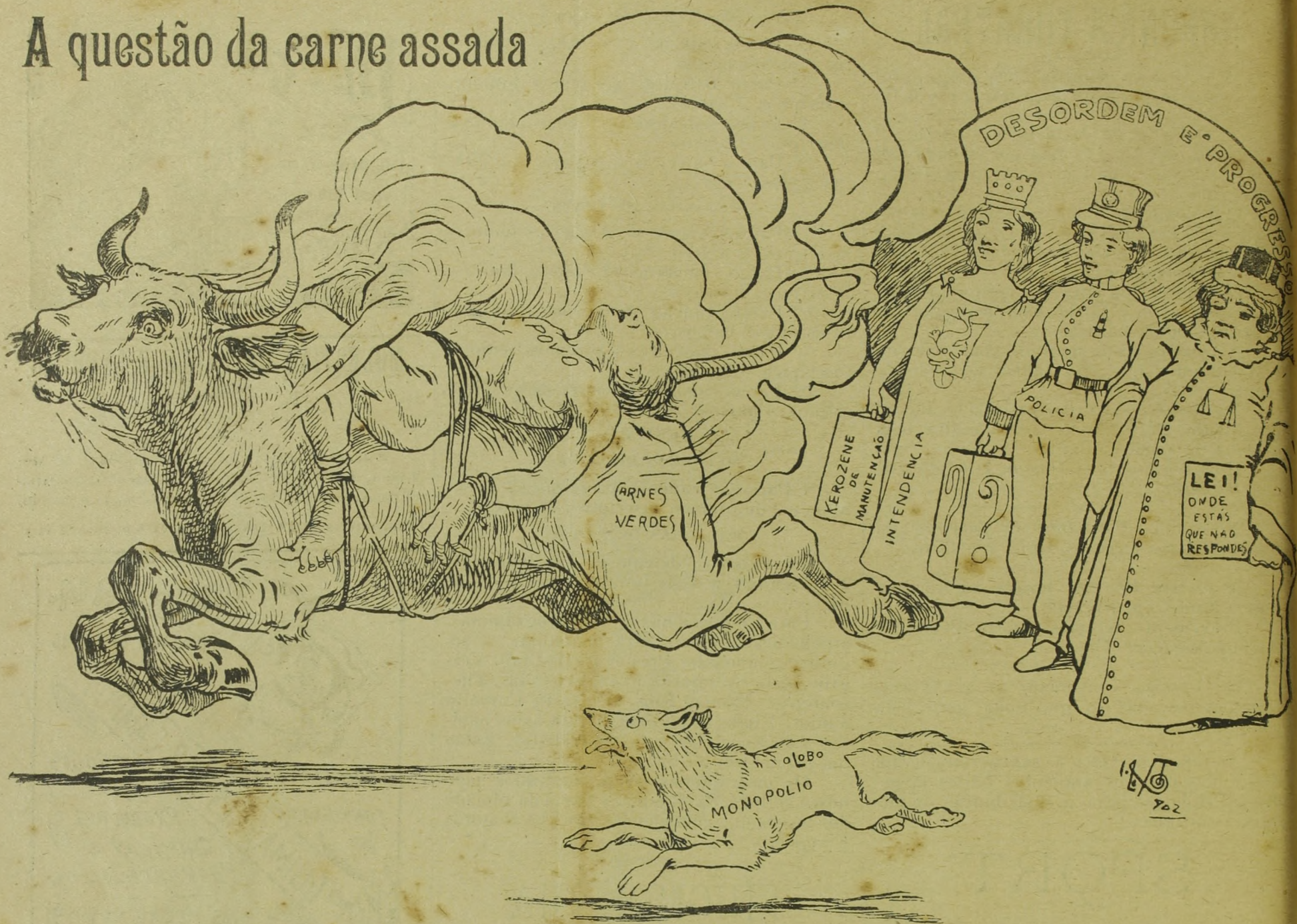
Touradas de novo genero, com a tortura do povo e a humilhação da Justiça.