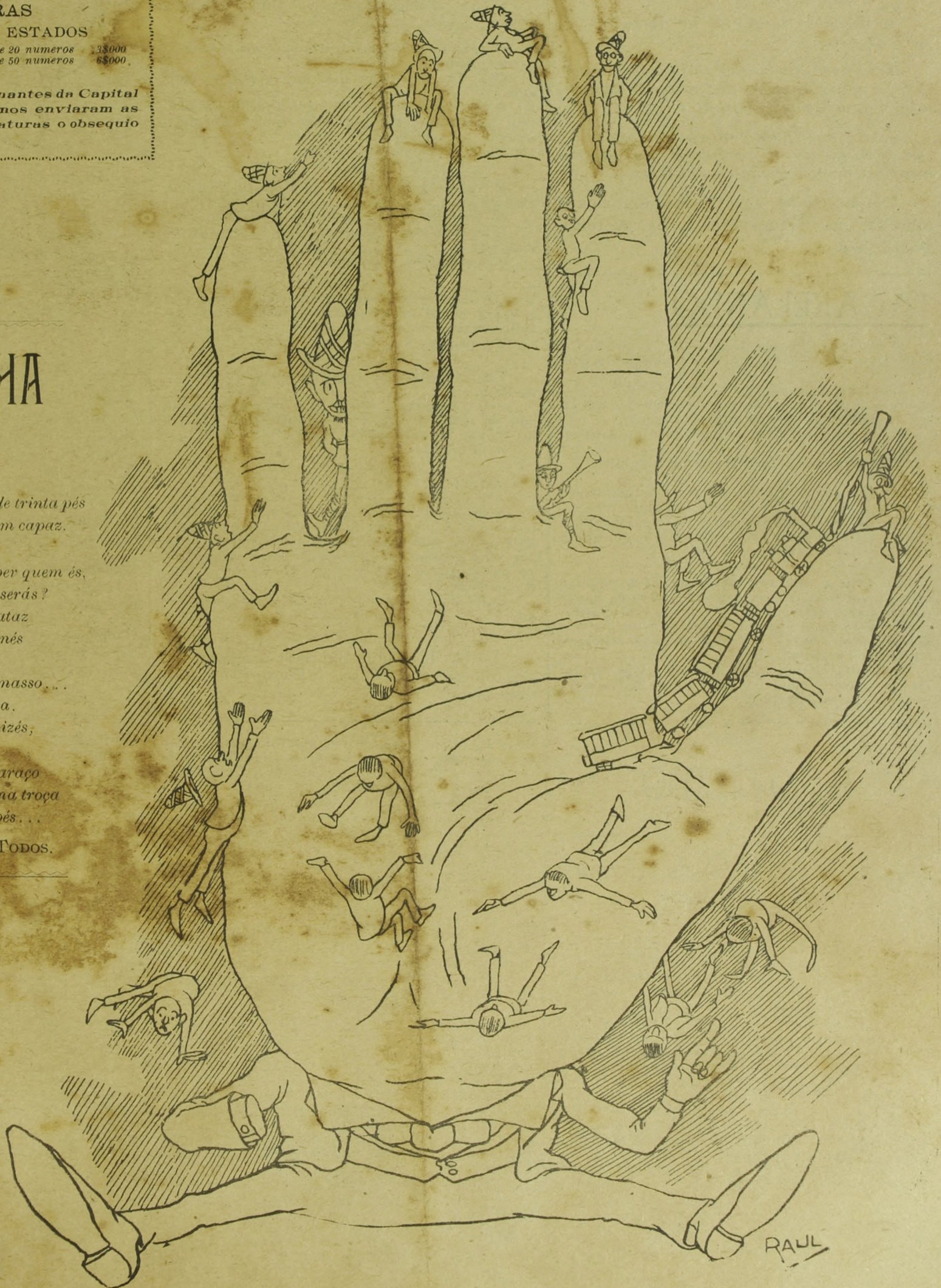
(Desenho de Raul)