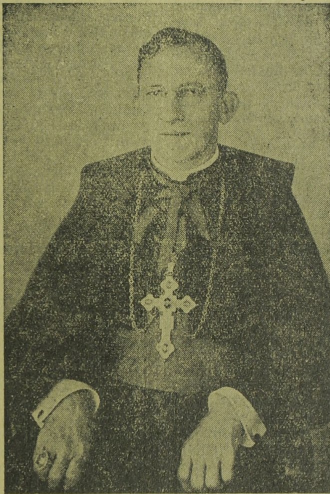
O. Exmo. Revmo. Snr. Bispo Diocesano.

O exmo. revmo. sr. Bispo Diocesano estará presente.