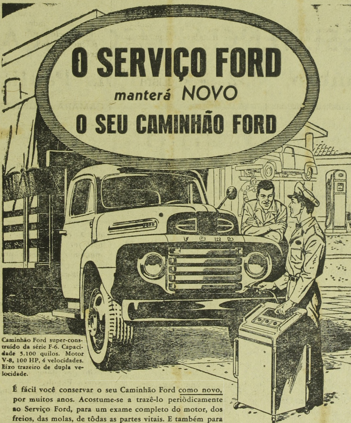
Caminhão Ford super-construído da série F-6. Capacidade 5.100 quilos. Motor V-8, 100 HP, 4 velocidades. Eixo trazeiro de dupla velocidade.

É fácil você conservar o seu Caminhão Ford como novo, por muitos anos. Acostume-se a trazê-lo periodicamente ao Serviço Ford, para um exame completo do motor, dos freios, das molas, de tôdas as partes vitais. E também para uma lubrificação geral. Se fôr preciso algum conserto ou substituição de peças, lembre-se disto: Nós podemos garantir um serviço mais rápido e perfeito. Porque nós conhecemos os produtos Ford melhor do que ninguém. E, naturalmente, usamos Peças Ford Legítimas.