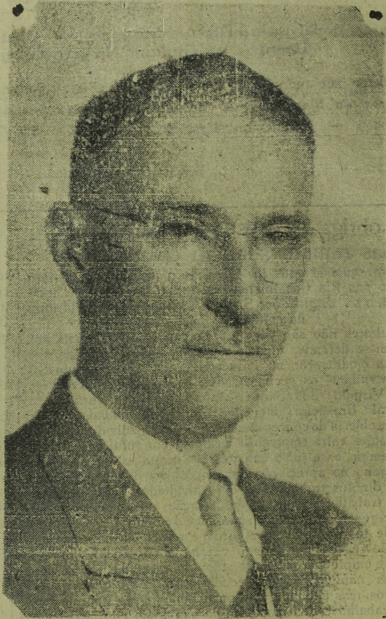
Geraldo de Barros