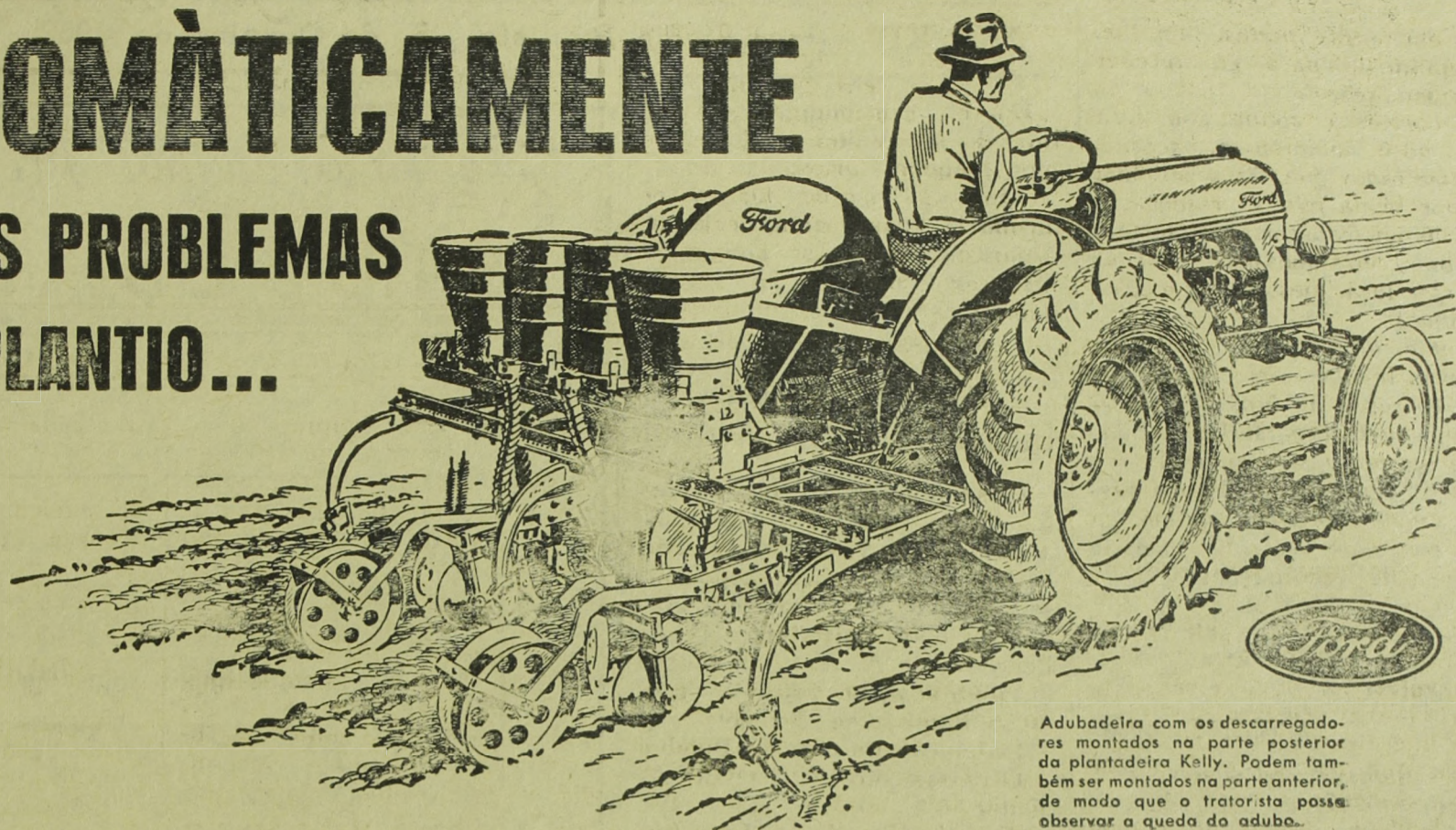
Adubadeira com os descarregadores montados na parte posterior da plantadeira Kelly. Podem também ser montados na parte anterior, de modo que o tratorista possa observar a queda do adubo.

A PLANTADEIRA KELLY, acionada pelo Contrôlo Hidráulico do Trator Ford, foi construída para muitos anos de trabalho pesado. É toda de ferro e aço. Com este implemento, você tem uma plantadeira completa, para qualquer tipo de plantio, controlada pela ação hidráulica do Trator Ford. Abre sulcos e lança sementes no espaçamento desejado. Rapidamente engatada à armação do cultivador ou sulcador Dearborn. Funciona automaticamente: quando levantada, interrompe-se o lançamento