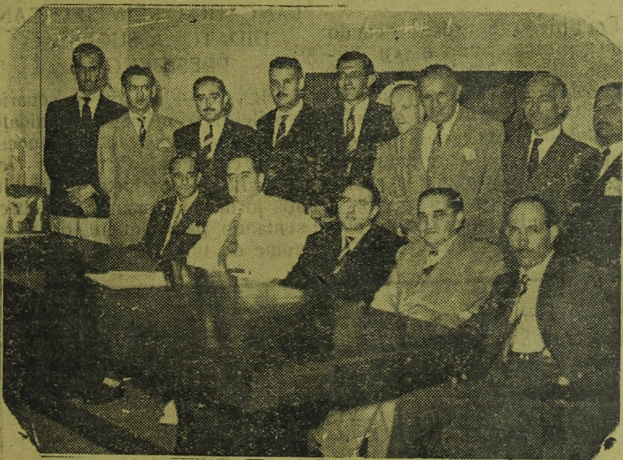
Em clichê, apresentamos a primeira turma que esteve em São Paulo, afim de solicitar a elevação do nosso município à categoria de comarca.