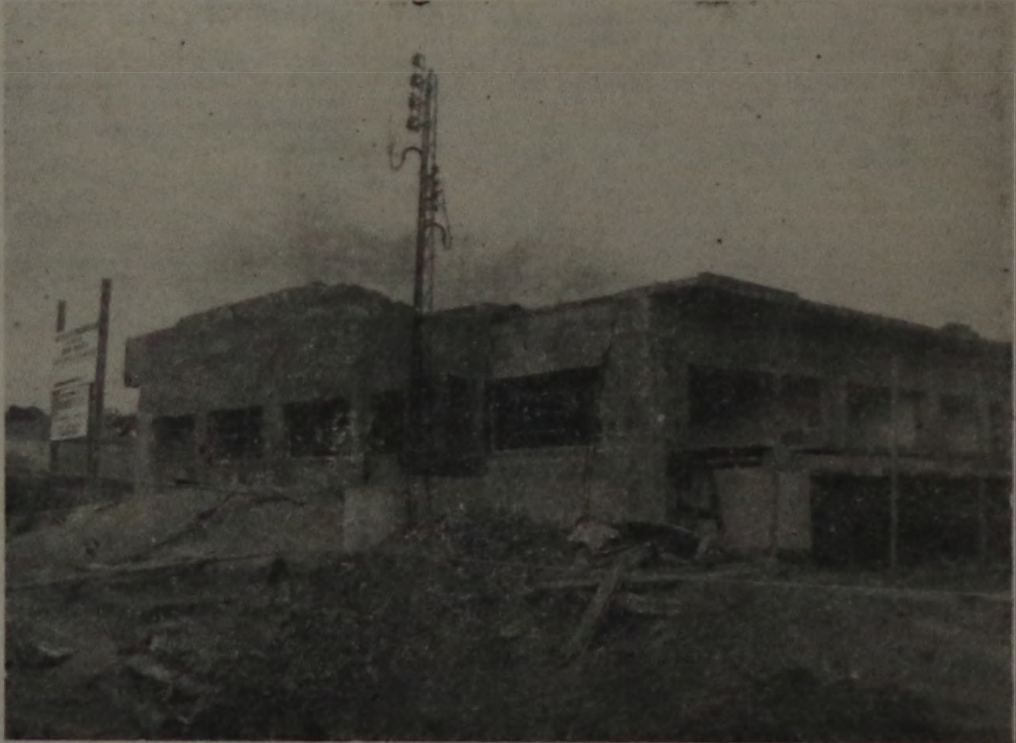
A foto acima e a da página 3, documentam claramente o que o fenômeno causou no Hospital dos Canavieiros.

Contudo, no dia seguinte, dia 31 ao sair da noite, o fenômeno se repetiu e novamente árvores foram arrancadas, com raios, em vários pontos da cidade.