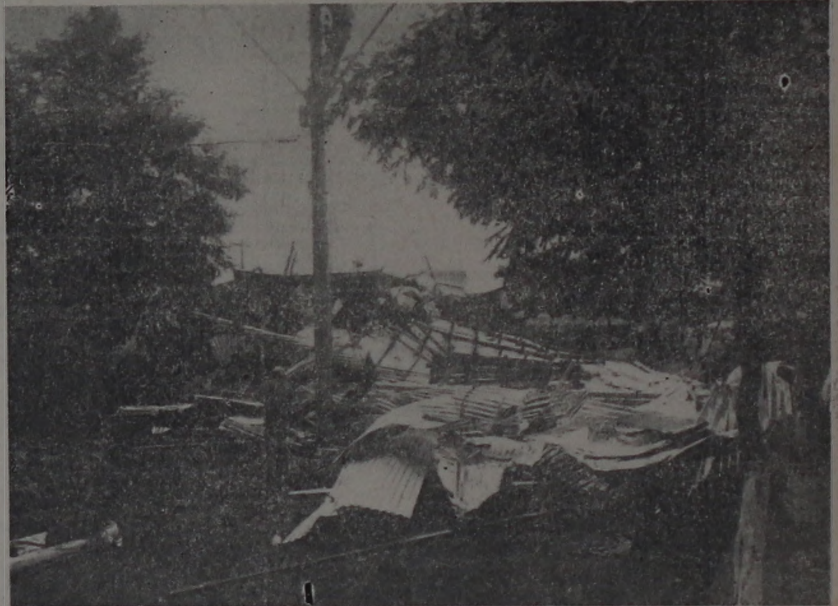
Voando cerca de 80 mts. a cobertura ficou assim, na Rua Geraldo de Barros